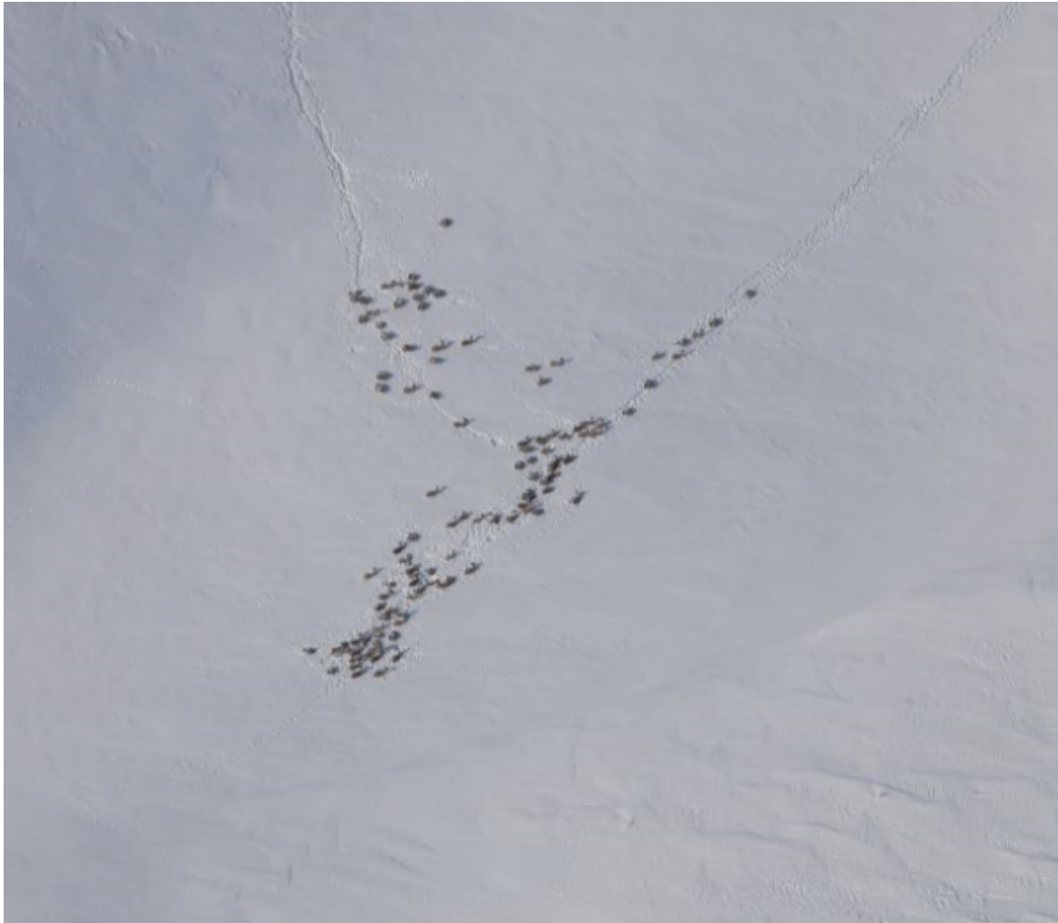
Bilde av den største flokken.