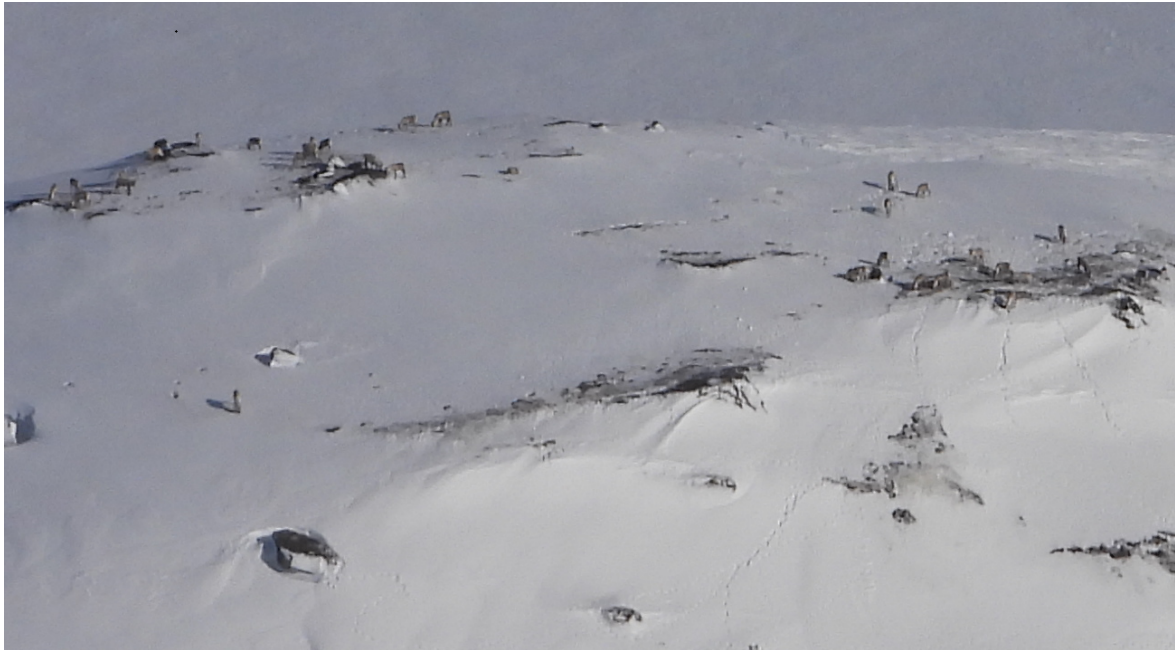
Dyr mellom Håheller og Øyuvsvatn.