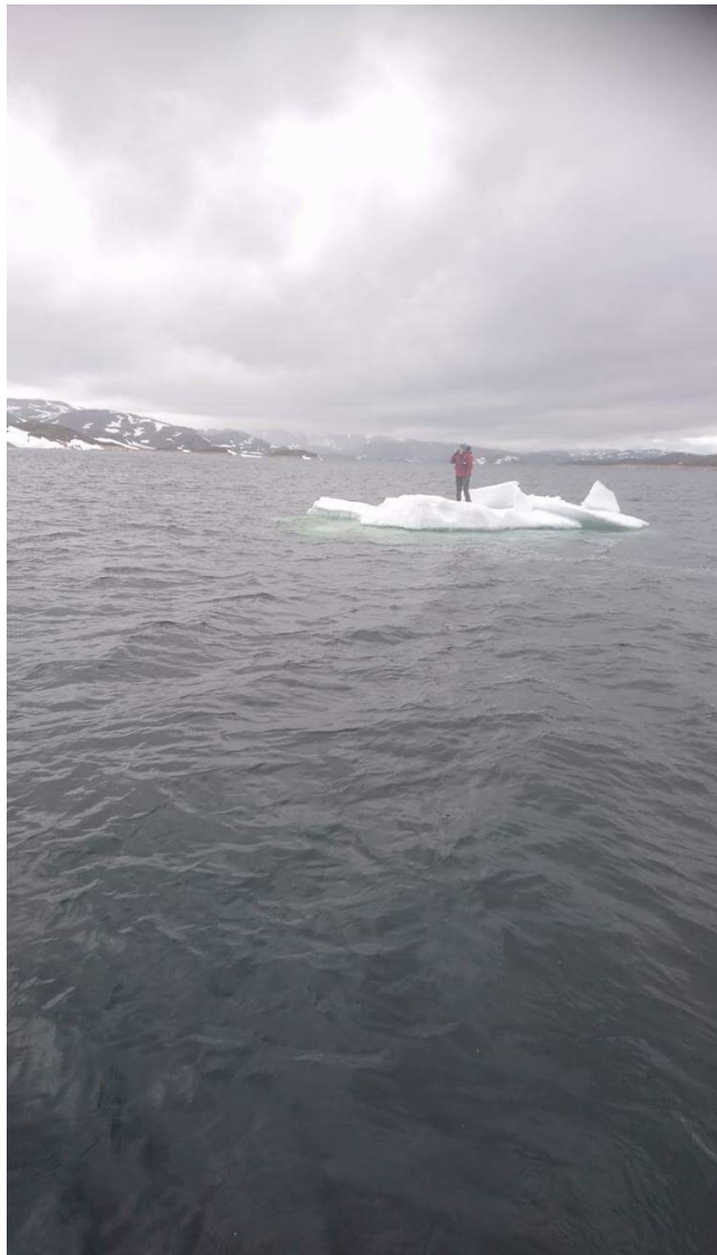
Rosskreppfjorden, juni 2017.

Utvalg: AU i verneområdestyret for SVR Møtested: Skype, Skype-møte Dato: 07.05.2019 Tidspunkt: 08:00