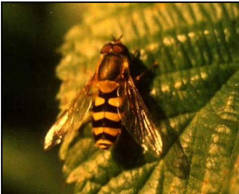
Blomsterflugene er viktige for plantepollinering. Larvane av mange artar èt bladlus og er såleis positive for plantelivet.