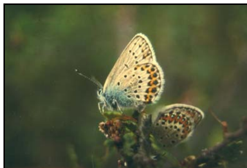
På varme sumardagar flyg blåvengene i opnare lende. Larvane lever på erteplanter.