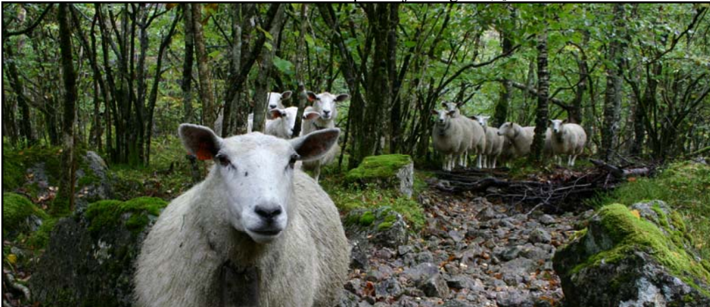
Saubeite set tydeleg preg på marksjiktet og "beiteskogen".

Beiting vil kunne halda fram slik det har vore praktisert dei seinare åra. Vesentleg endring av beitebruk og nye dyreslag som vil kunne ha uheldig innverknad på naturmiljøet, t.d. meir konsentrert/uheldig beitepress eller redusert naturleg forynging av treslag, er likevel ikkje tillate. Naudsynte tiltak/inngrep i samband med beitedrifta, som t.d. utbetring av skårfeste og oppsetting av gjerde er i utgangspunktet i strid med regelverket. Eventuelle tiltak i samband med beitedrift vil måtte vurderast i høve til dispensasjonsregelen, § 7 i forskriftene.