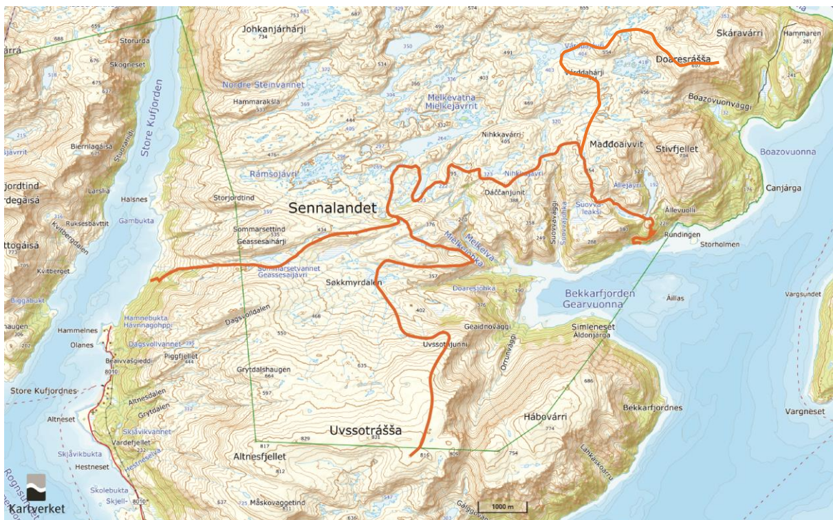
Figur 1: Kart over kjørespor der kjøring tillates i forbindelse med reindrift. Det nye kjøresporet fra Store Kufjord er tegnet inn i samråd med Bekkarfjord siida under befaring med helikopter i oktober 2020. Nasjonalparkstyret og siidaen vil befare området i sommer (2022) for å finne nøyaktig trasé for kjøresporet i Leakševággi.

Tillatelsen gjelder ikke transport av byggematerialer til større byggeprosjekter eller andre operasjoner som ikke er en del av den daglige reindriften. Dette må siidaen søke spesielt om til nasjonalparkstyret.