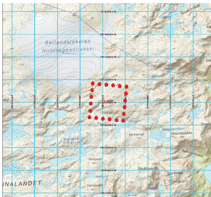
Takseringsruta på 1,5 x 1,5 km, med punkt for hver 300 meter.