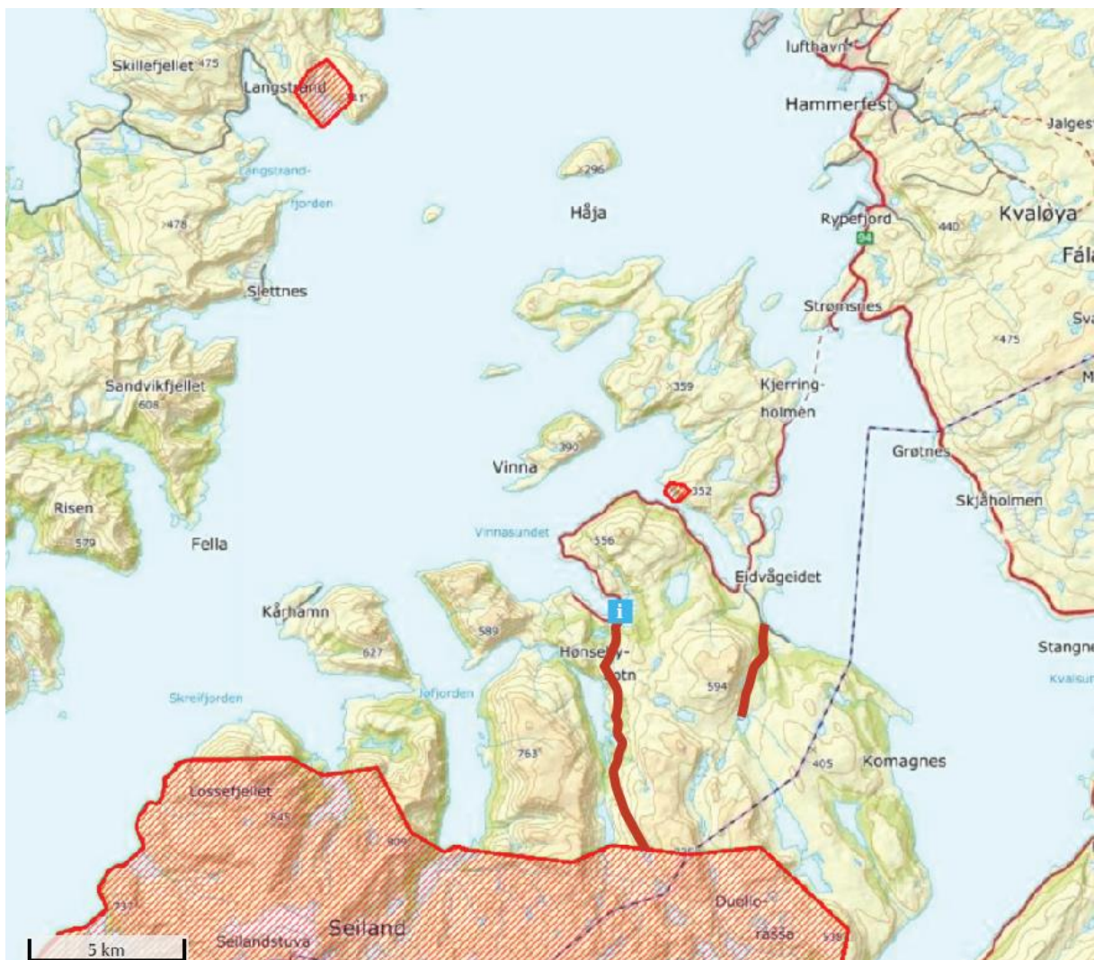
Figur 1: Seiland nasjonalpark og Eidvågen naturreservat (fuglefjell med krykkje) med rød skravur. Turstiene fra Hønseby inn til parkgrensa og fra Vassbukta inn til Tindstua er tegnet inn med rød strek. Startpunkt Hønseby er markert med blått info-ikon.

På nordre Seiland er det to mye brukte innfartsårer inn til parken, som nasjonalparkstyret spesielt ber om holdes utenfor rammeplanen for vindkraft. Fra Hønseby til Storvannet og videre til parkgrensen er det merket en tursti inn til parken (fig. 1). Vindkraftanlegg i dette området vil ha en svært negativ innvirkning på de besøkendes opplevelse av nasjonalparken. Det samme gjelder turstien fra Vassbukta til Tindstua, som er en mye brukt tursti for dem som vil ha en kortere tur på Seiland. Tettstedet Hønseby på nordre Seiland er startpunkt for besøkende til nasjonalparken. Her er det investert i utstilling, informasjon og annen småskala infrastruktur som skal ønske besøkende velkommen til Seiland. Igjen vil vi påpeke at Seiland er en av få nasjonalparker uten særlig tilrettelegging, og at det er dette de besøkende kommer for å oppleve.