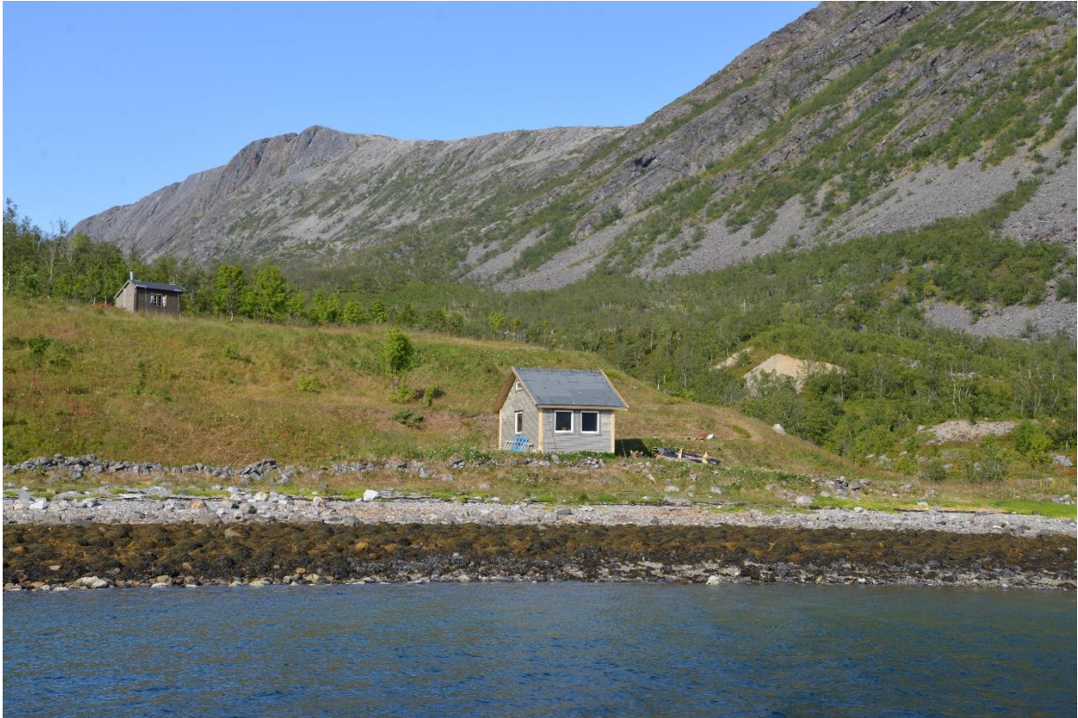
Thomassens hytter i Olderbukta. Bilde tatt i august 2019.