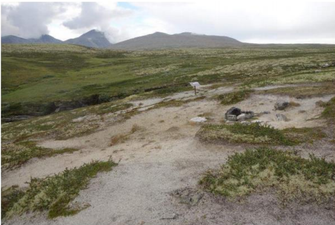
Figur 40. Stor tetthet av sensitive enheter i området vest for parkeringsplassen rundt informasjonsskiltene. Her er det både eksponert og svært fint substrat.