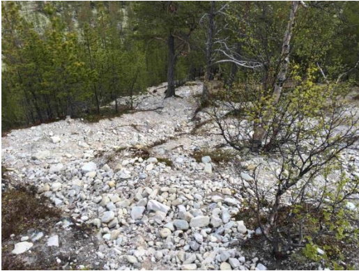
Figur3: Øvre del av "Brattbakken" innenfor Straumbu