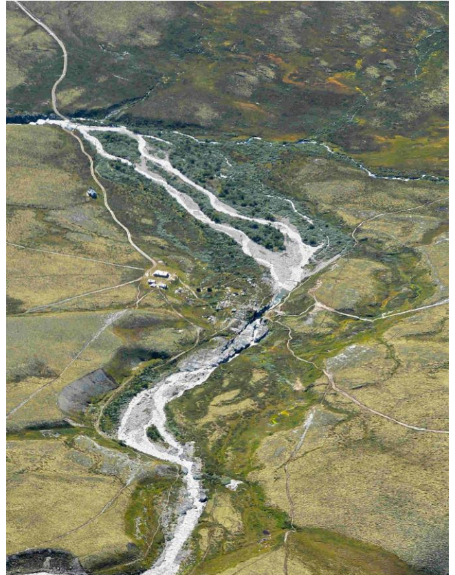
Figur 2: Vesle Ula ved Peer Gynt.

På turiststien fra Straumbu og inn til Bjørnhollia er det spesielt to lokaliteter som er sterkt utsatt for slitasje og erosjon: «Brattbakken» i overgangen fra Atnsjømyrene naturreservat til Myldingi naturreservat (figur 3) og stien ned fra Musvollkampen mot Bjørnhollia (figur 4) er begge utsatt for så stor slitasje at vannet har fått begynt å jobbe med stien med det resultat at erosjonsskader har oppstått. Ved begge disse lokalitetene er det behov for avbøtende tiltak for å stanse videre erosjon. I tabell 2 er det vist en oversikt over områder med erosjon i tilknytning til godkjente merka stier