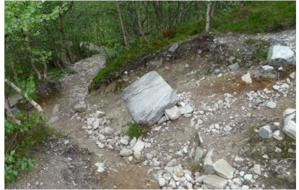
Figur 4: Sti ned fra Musvollkampen mot Bjørnhollia