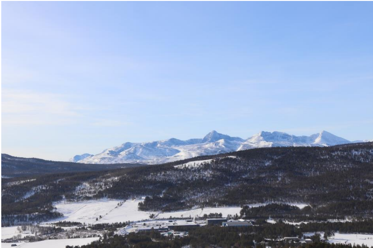
Rondane panorama, sett fra Folldal gruver, (08.03.22).