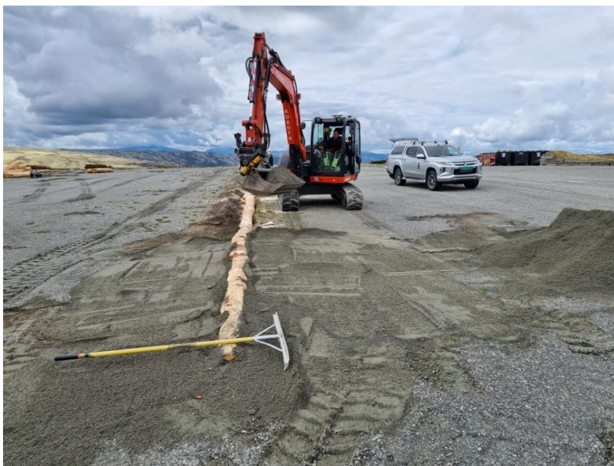
Vedlikehold av parkeringsplassen ved Spranget, Frydalen LVO (24.06.21).