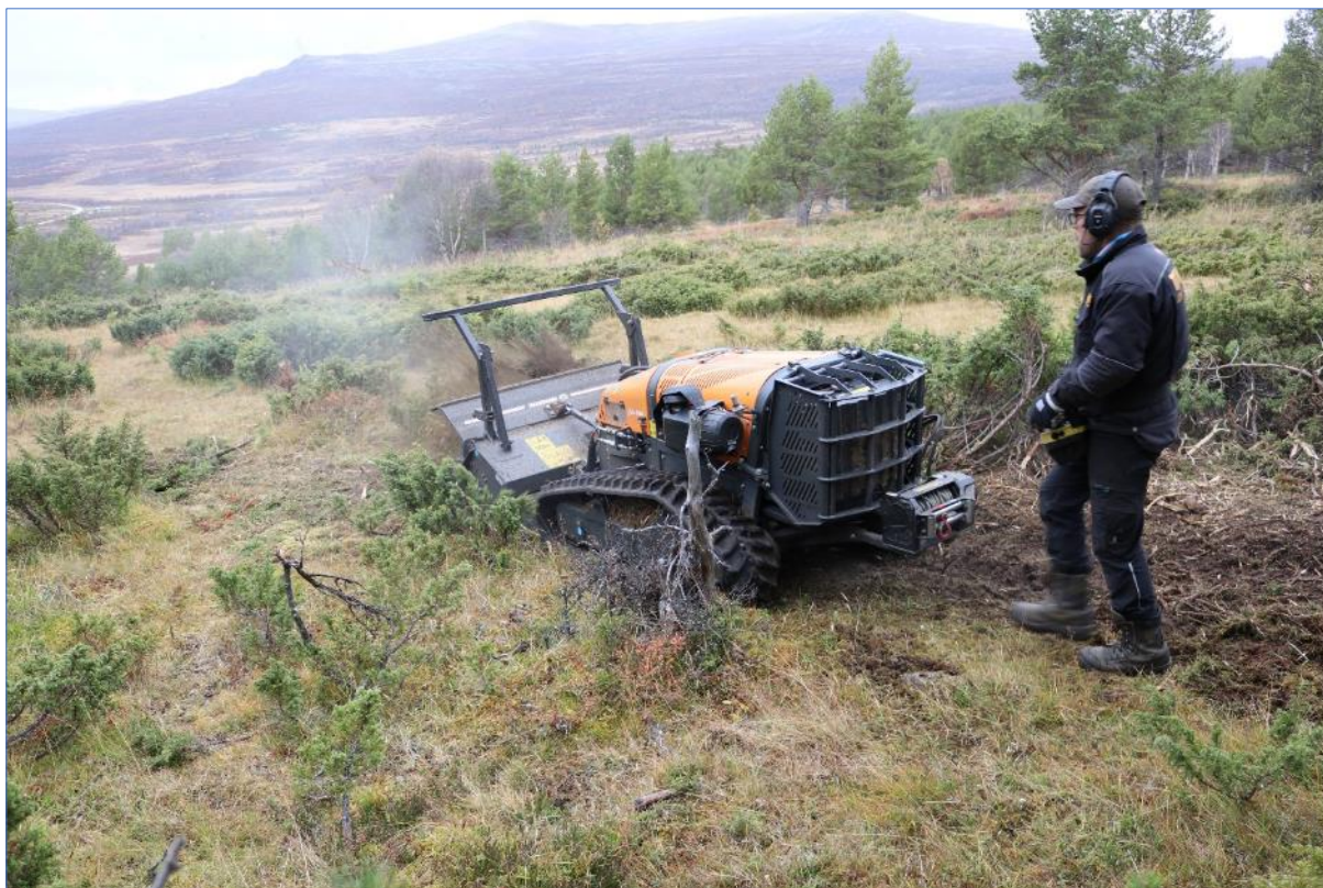
Bruk av «dieselgeit» for rydding einer i Grimsdalen LVO, Tønne Utmarkservice. (07.10.22).