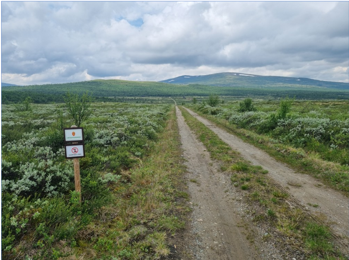
Informasjon ved Grimsdalsgruva, (21.07.22)

Tildelte midler og forbruk er vist i tabell 9.