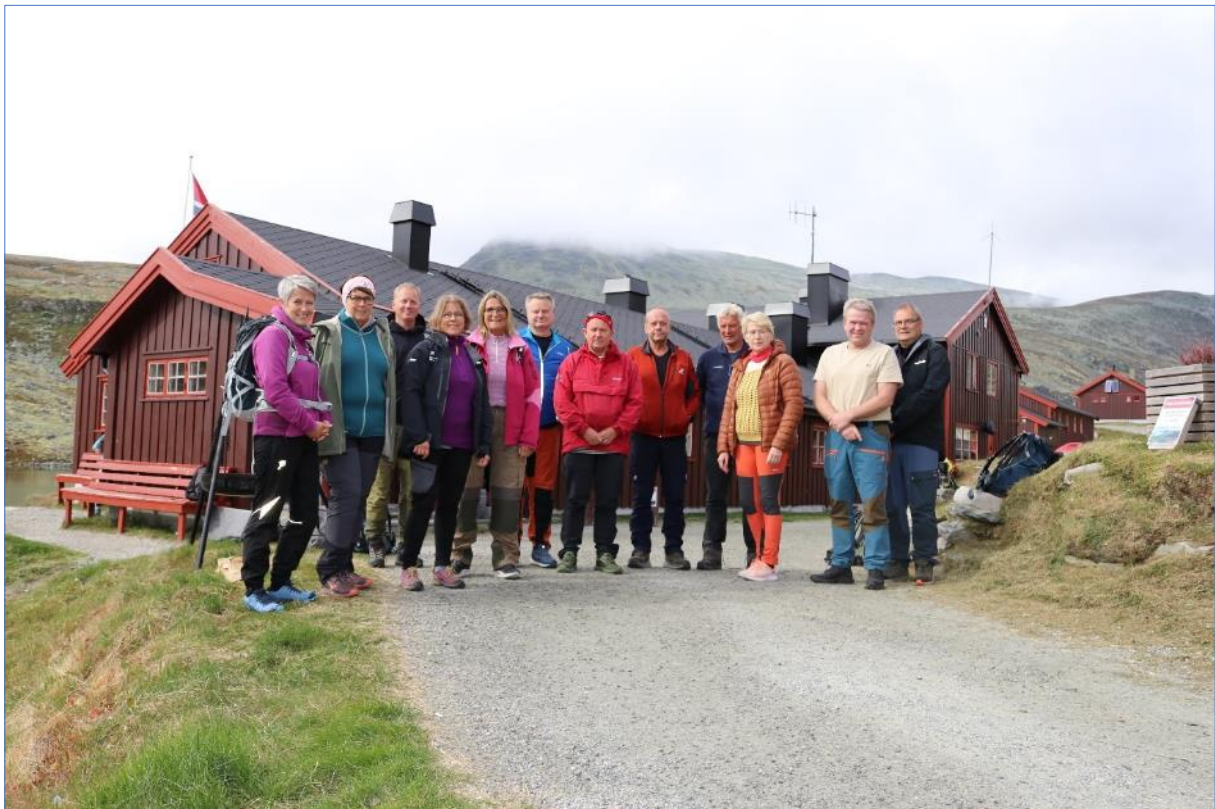
Fra befaring med Rondane-Dovre nasjonalparkstyre (02.09.22) til Rondvassbu, Rondane NP.

Rondane er i dag en av Norges mest besøkte nasjonalparker.