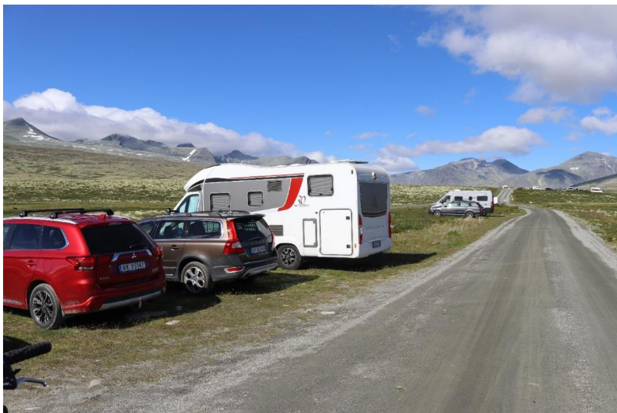
Frå vegen mellom Reinsbommen og Spranget (07:07:22).