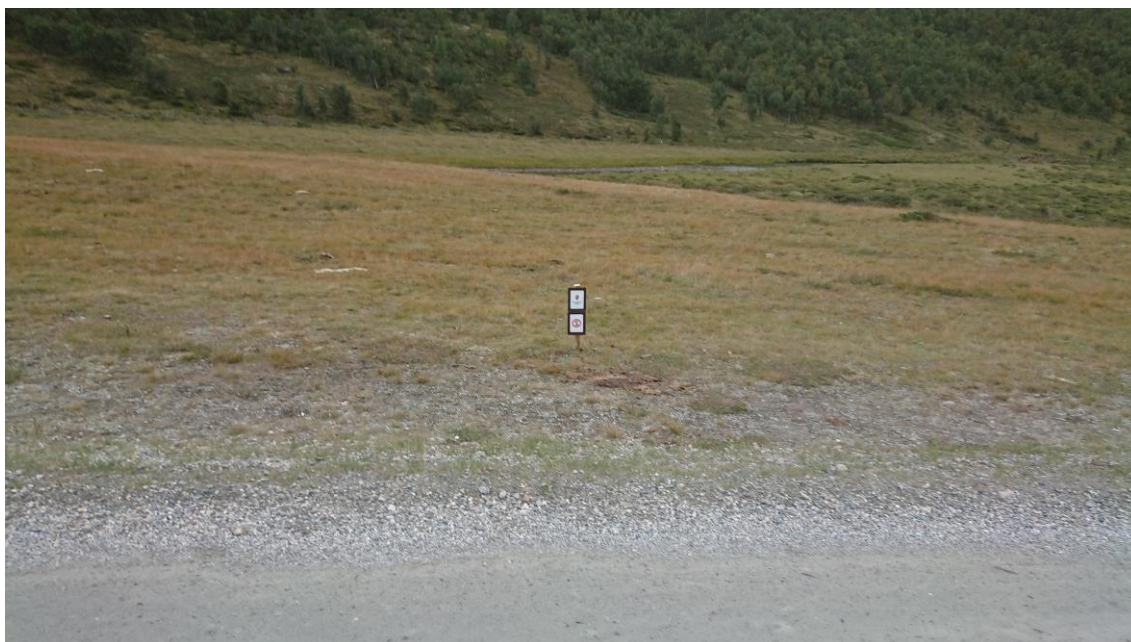
Skilting av hvor det ikke er tillatt å parkere/kjøre.

Tidligere har det vært en kultur for å parkere langs veien i Grimsdalen på flere steder. Nå blir de besøkende henvist til å benytte parkeringsplassene ved Bjørnsgardseter (Barthbua), Tollevshaugen (Løken), Grønbakken og Helleberget. Fjellstyret drifter på disse plassene en enkel utedo. I 2021 kom det også opp informasjon om anbefalte overnattingssteder i Dovre og Folldal. Det er mange besøkende til Grimsdalen. Disse tiltakene har styrt overnattingen til færre steder. Der det er mulig å håndtere søppel mm.