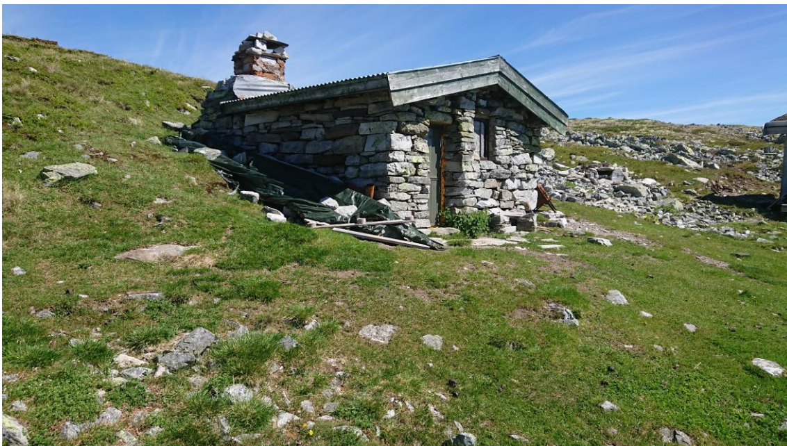
Platting fjernet ved steinbu ved Rundhøa i Vulufjell.