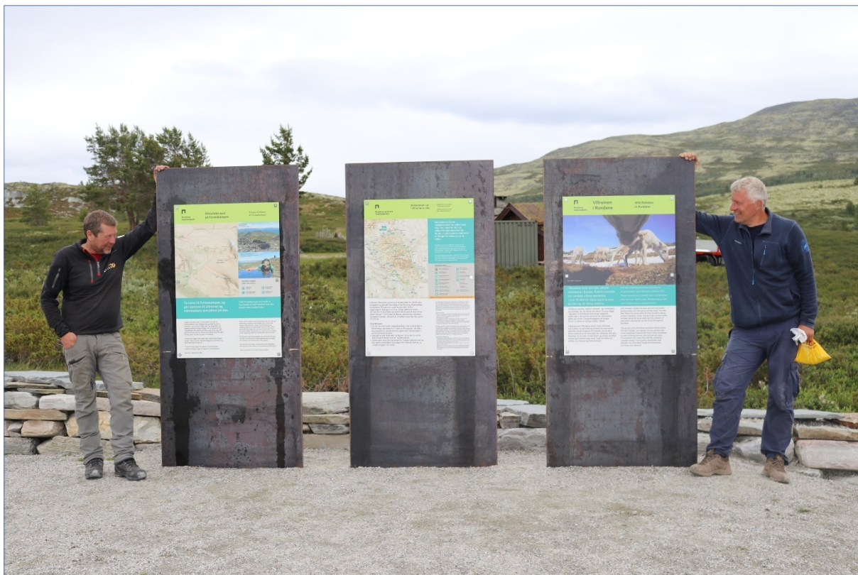
Infopunkt Høvringen.