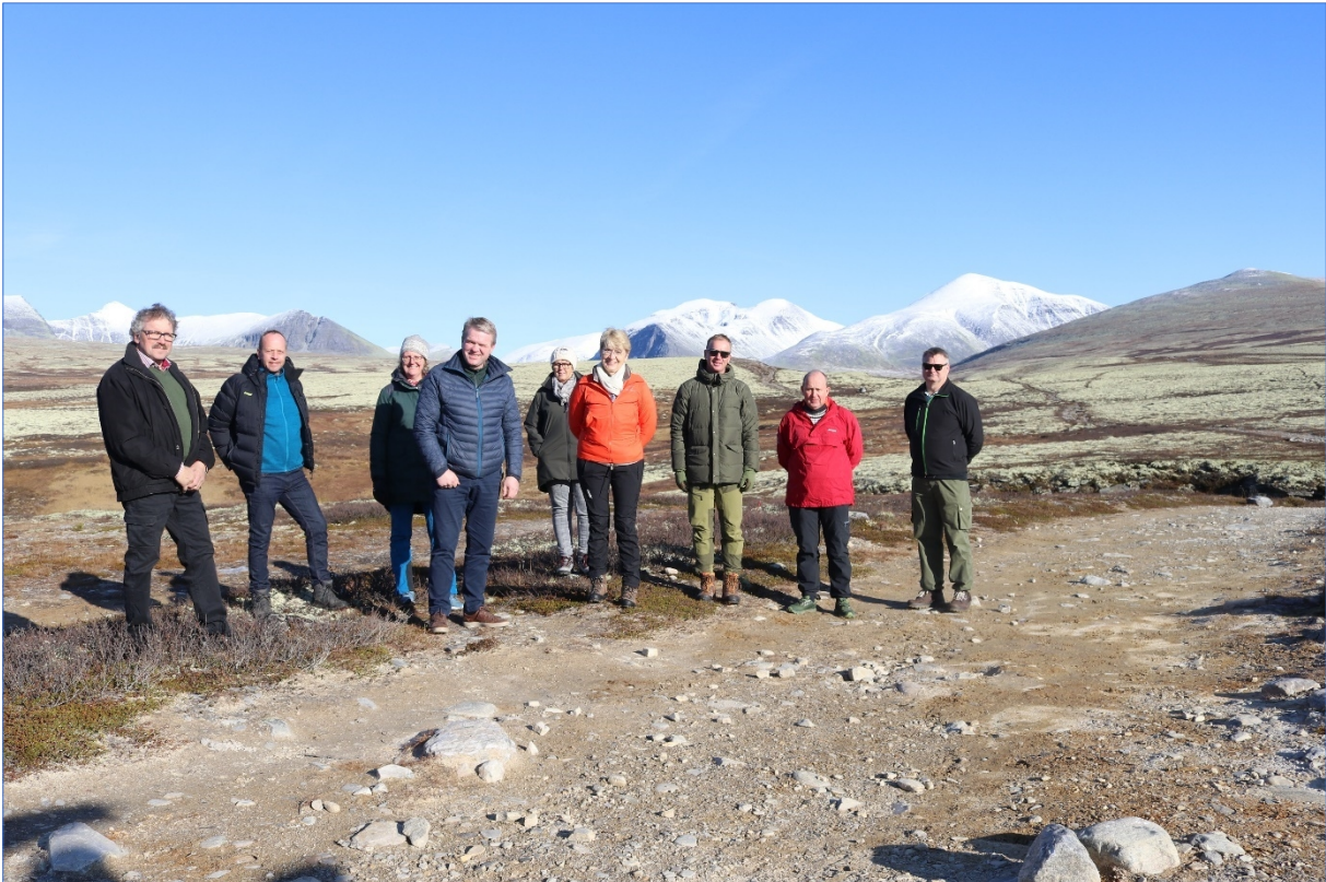
Rondane-Dovre nasjonalparkstyre på befaring ved Spranget 14.10.20. Foto: Rondane-Dovre nasjonalparkstyre.