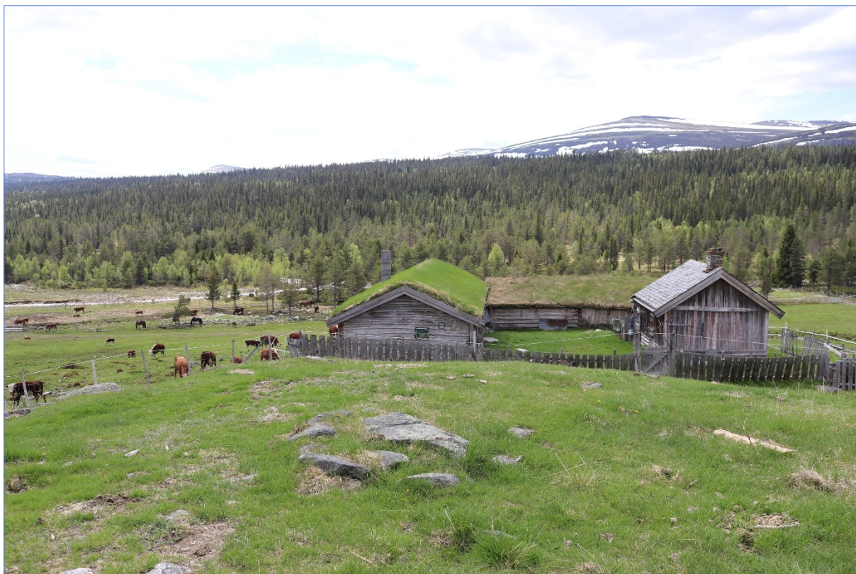
Øyasætre. Foto: Rondane-Dovre nasjonalparkstyre.