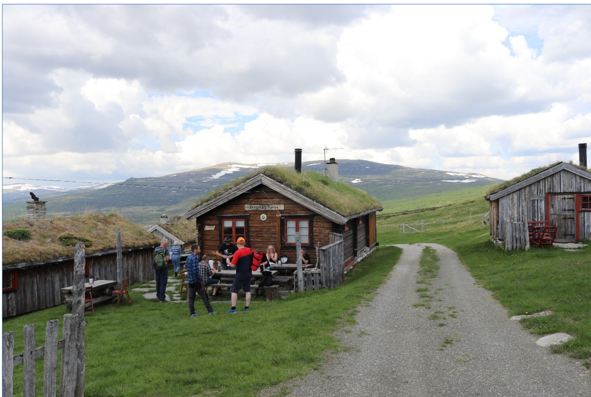
«Arbeidsgruppe Grimsdalen» - befaring ved Tolleivshaugen, 17.06.20.