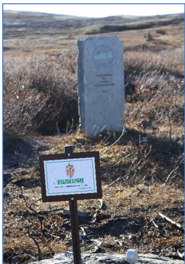
Grense Dovre nasjonalpark ved Kongevegen.