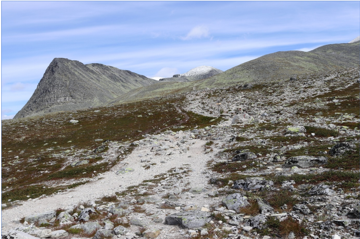
Mot Rondeslottet.

Sekretariatet for Rondane-Dovre nasjonalparkstyre