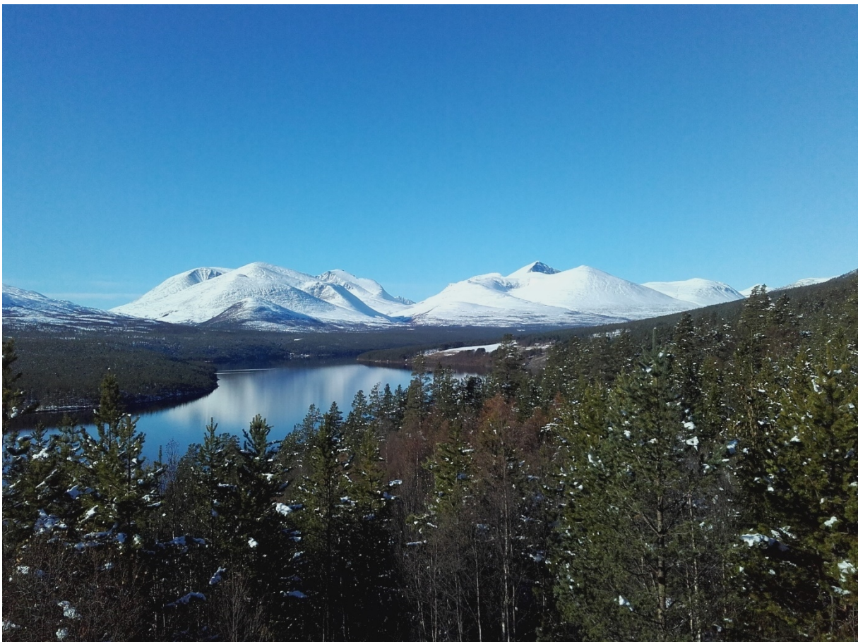
Atnasjøen og Rondane.

Rondane er i dag en av Norges mest besøkte nasjonalparker.