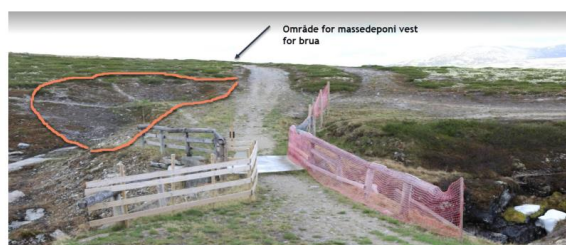
Figur 2: Steder med oransje markering viser områder massene kan legges.