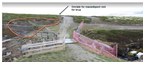
Figur 2: Steder med oransje markering viser områder massene kan legges.