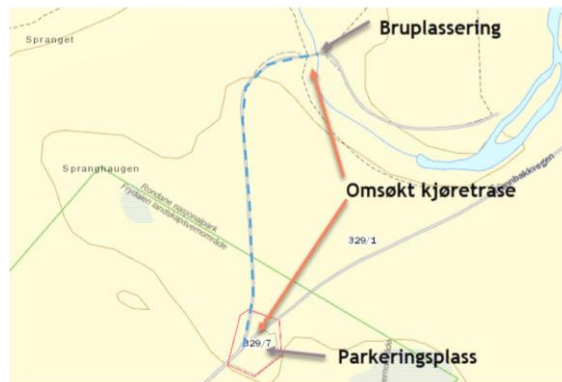
Figur 1: Kjøretrasé vist med blå stiplet linje