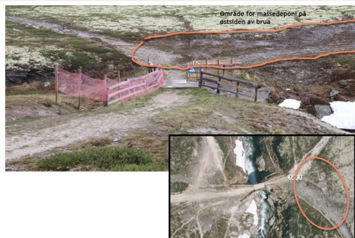
Figur 3: Steder med oransje markering viser områder massene kan legges.

Dispensasjonen er gitt etter verneforskriften og naturmangfoldloven. Tiltakshaver har selv ansvar for innhenting av samtykke fra berørte grunneiere der dette er nødvendig og for at det foreligger de nødvendige tillatelser fra andre myndigheter.