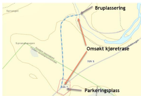
Figur 1: Kjøretrasé vist med blå stiplet linje