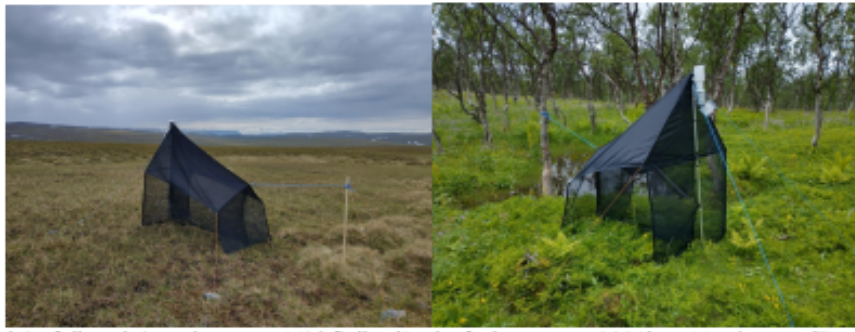
Bilde 1. Malaisefelle-telt i nærheten av Midtjellet (Berlevåg kommune 2021) og Matduottar (Tana kommune 2021). Insektene flyr inn i en plastflaske i toppen av fellen og faller ned i en samleflaske med 80% sprit som er beskyttet mot sollys med aluminiumstape.