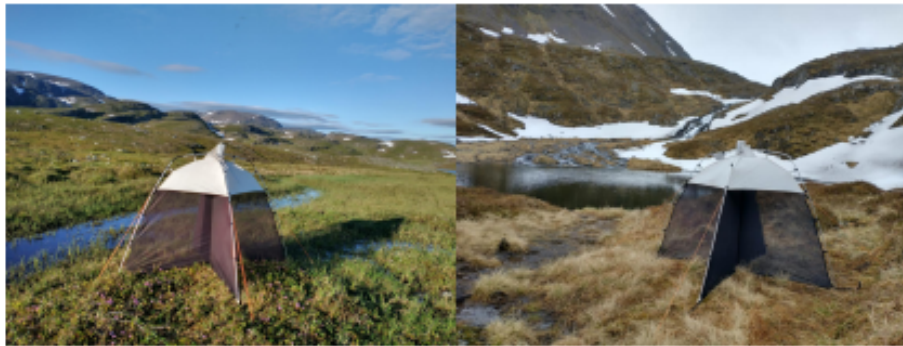
Bilde 2. SLAM-felle på fjellene i nærheten av Bognelvdalen (Alta kommune 2021) og Vassdalen (Loppa kommune 2021). Selvstående kryssfelle som fungerer etter samme prinsipp som Malaisefellene.