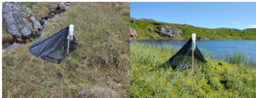
Bilde 3. Klekkfeller på fjellene i nærheten av Vassbotndalen (Alta kommune 2021) og Øretoppen (Sør-Varanger kommune 2021). Fellen fungerer etter samme prinsipp som Malaisefellene.