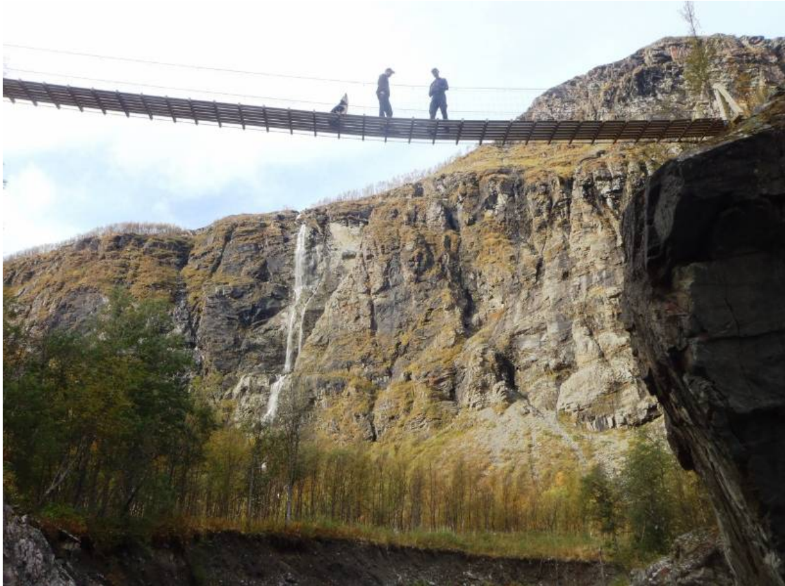
Ny hengebru over Kjelelva