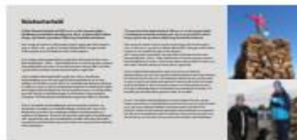
1150 x 530 mm