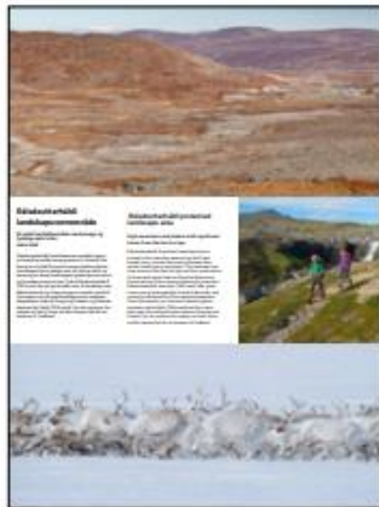
1150 x 1370 mm