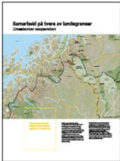
1150 x 1370 mm