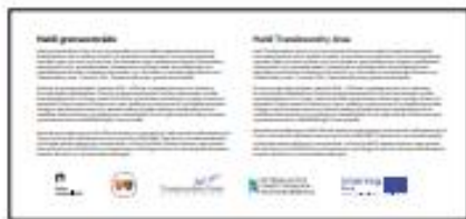
1150 x 530 mm