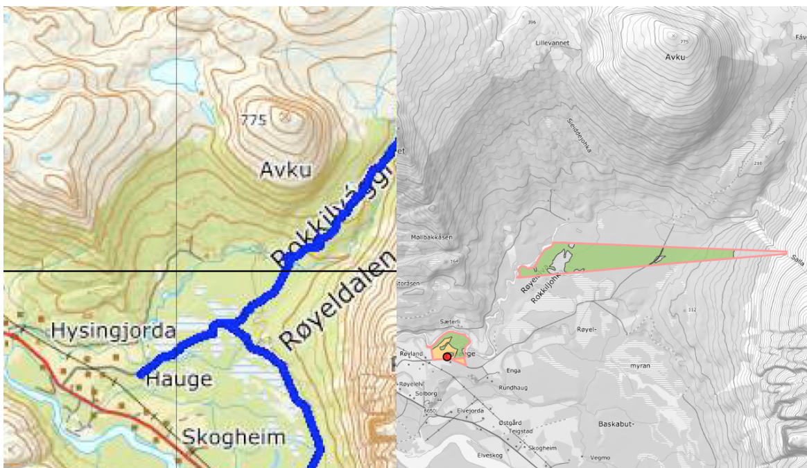
Bilde: Kartutsnittene viser løype over gnr. 22, bnr. 8 i Røyelvdalen.