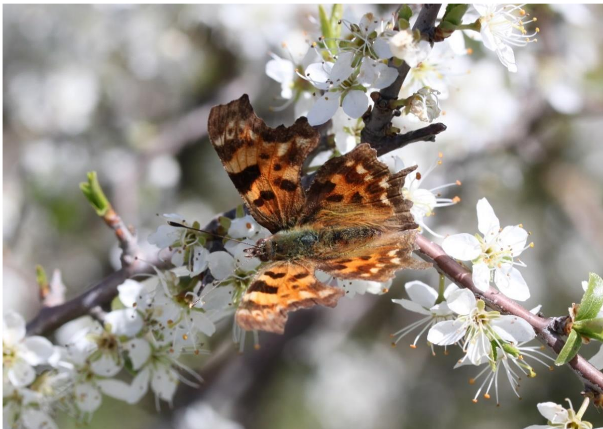
Figur 15. Sommerfuglen Hvit c Polygonia c-album på slåpetorn på Spornes, Arendal kommune.