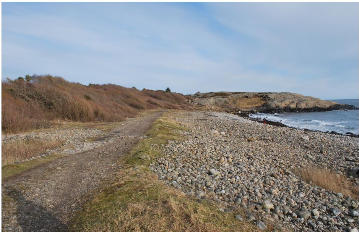
Figur 6. I 2020 er det gjengroing med tette kratt av selje, vier og diverse busker som preger arealene på oppsiden av Tangveien. Gras- og vegetasjonsdekke forekommer langs veien og inn mot kratt.