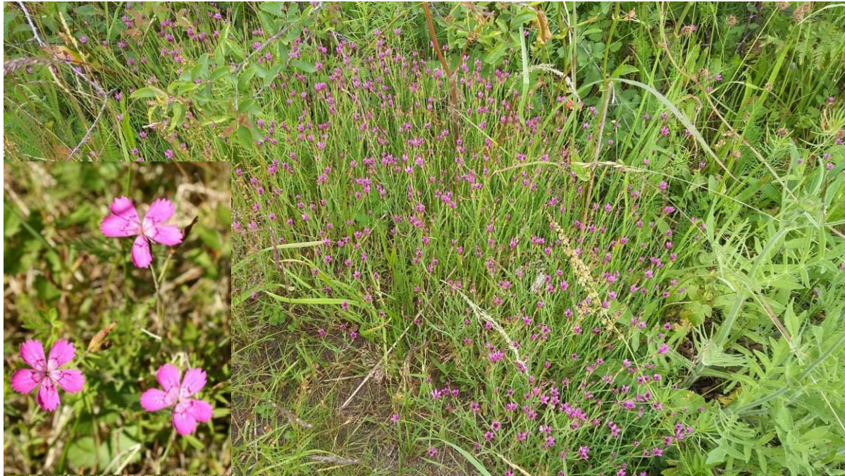
Figur 8. Engnellik er ei plante i tilbakegang mange steder på Agder. Her er ei stor tue med engnellik midt oppe på ei stor maurtue med engskogmaur 1 i enga nær parkeringsplassen på Spornes. Det vokser engnellik mange steder innen skjøtelsesplanområdet på Spornes.