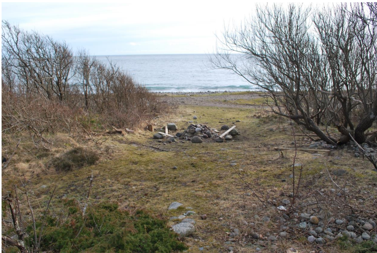
Figur 28. Opparbeida rasteplass inne i selje-beltet på oppsiden av Tangveien.