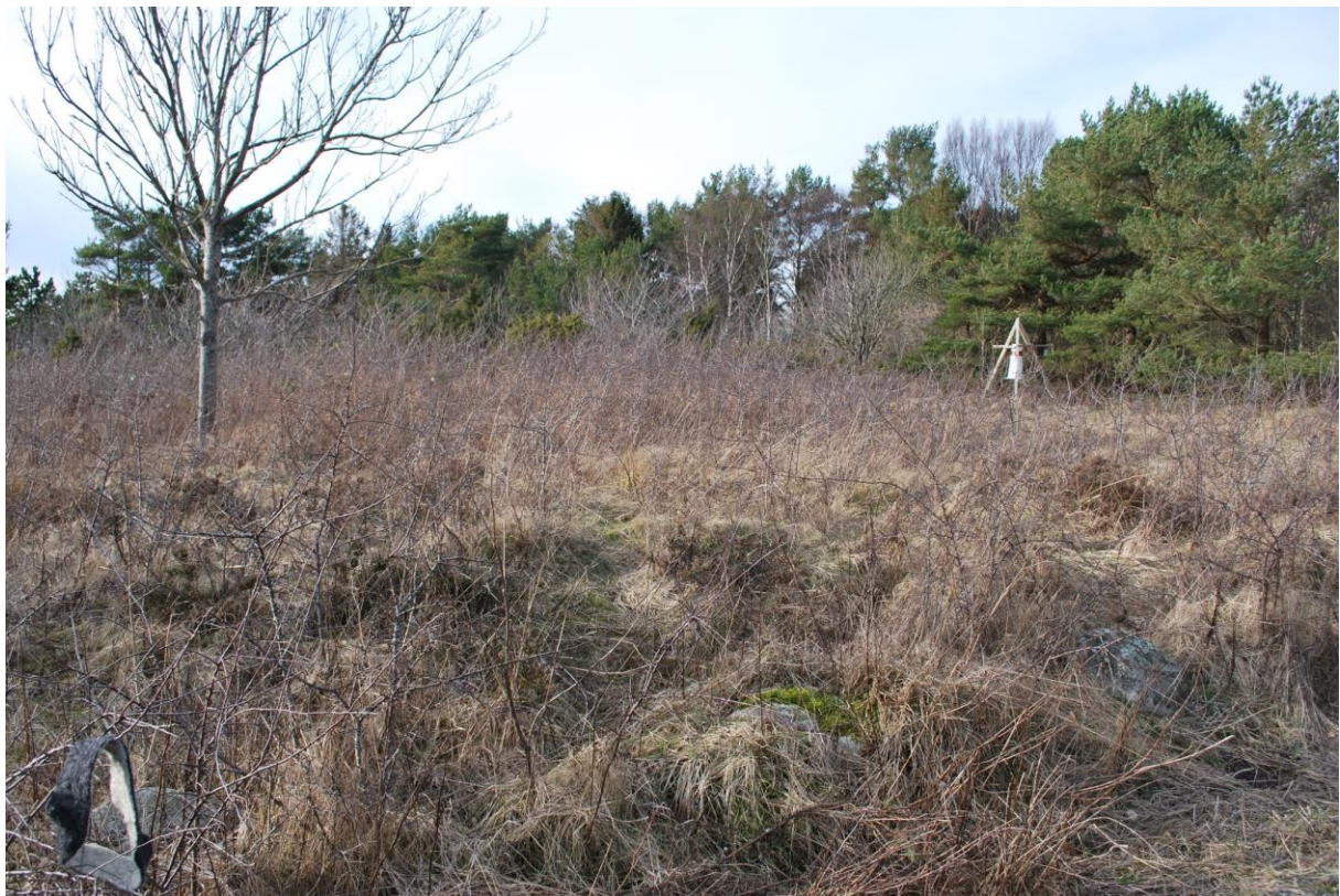
Figur 20. Eng ved parkeringsplass er relativt tua med bl.a. mange maurtuer. Videre er det mye slåpetornkratt jevnt utover. Slåpetornkratt kan sette igjen mot kantene, og en kan forsøke å flytte enkelte av maurtuene inn mot kanten, eller spare maurtuene inne i gjenstående slåpetornkratt. Resten må jevnes ut slik at en får slått enga.