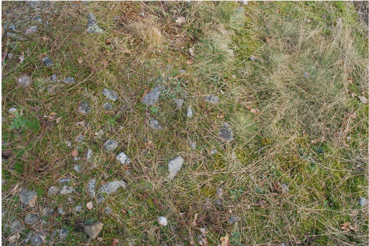
Figur 25. Vegetasjonsdekket oppå rullesteinene er mange steder veldig tynt. Det bør ikke brebberes kvisthauger i områder med så tynt jordsmonn.