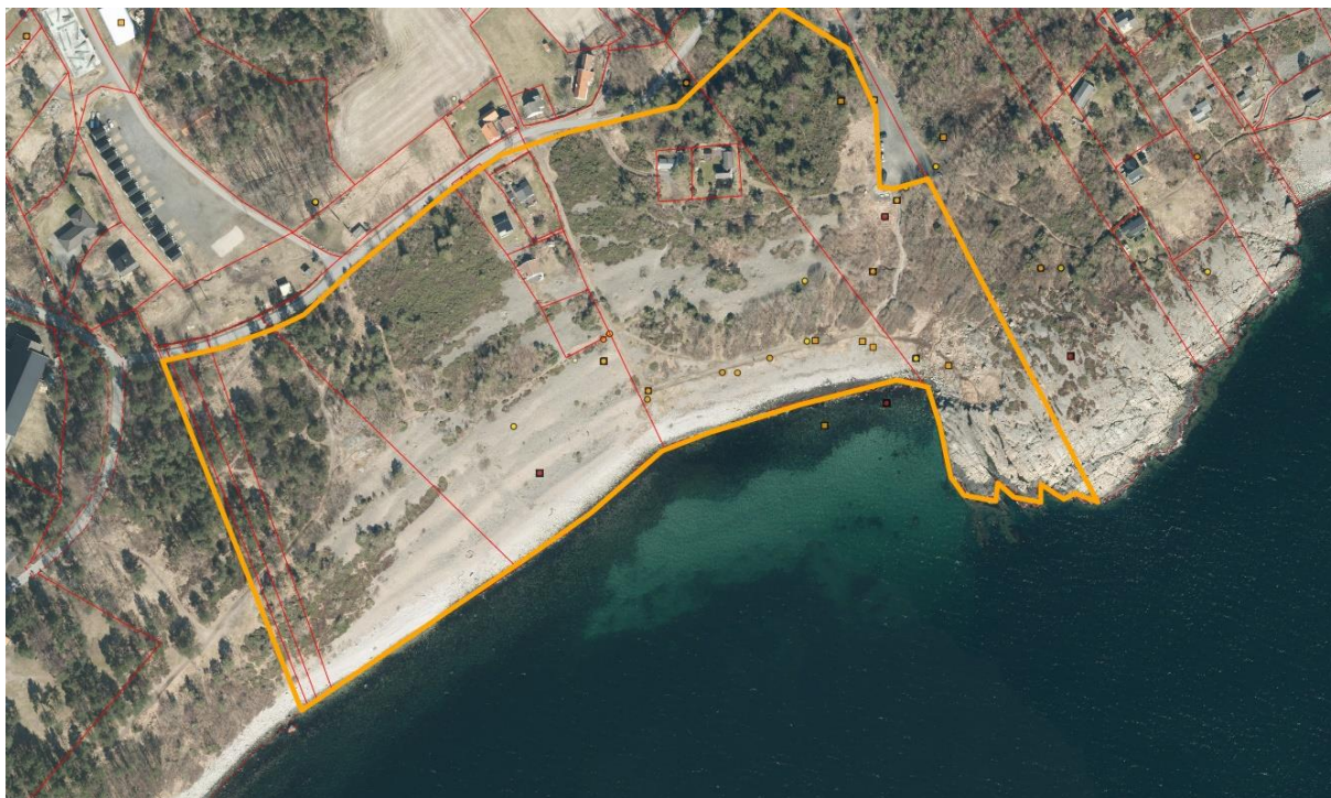
Figur 2. Skjøtselsplanområdet på Spornes er avgrensa med gul markering og utgjør 100 daa. I nord grenser skjøtselsplanområdet av grusvei, i sør mot sjøen, i vest mot eiendom gnr 211 bnr 47, og i øst mot gnr 215 bnr 114. Det finnes i dag fem hytter innen området.