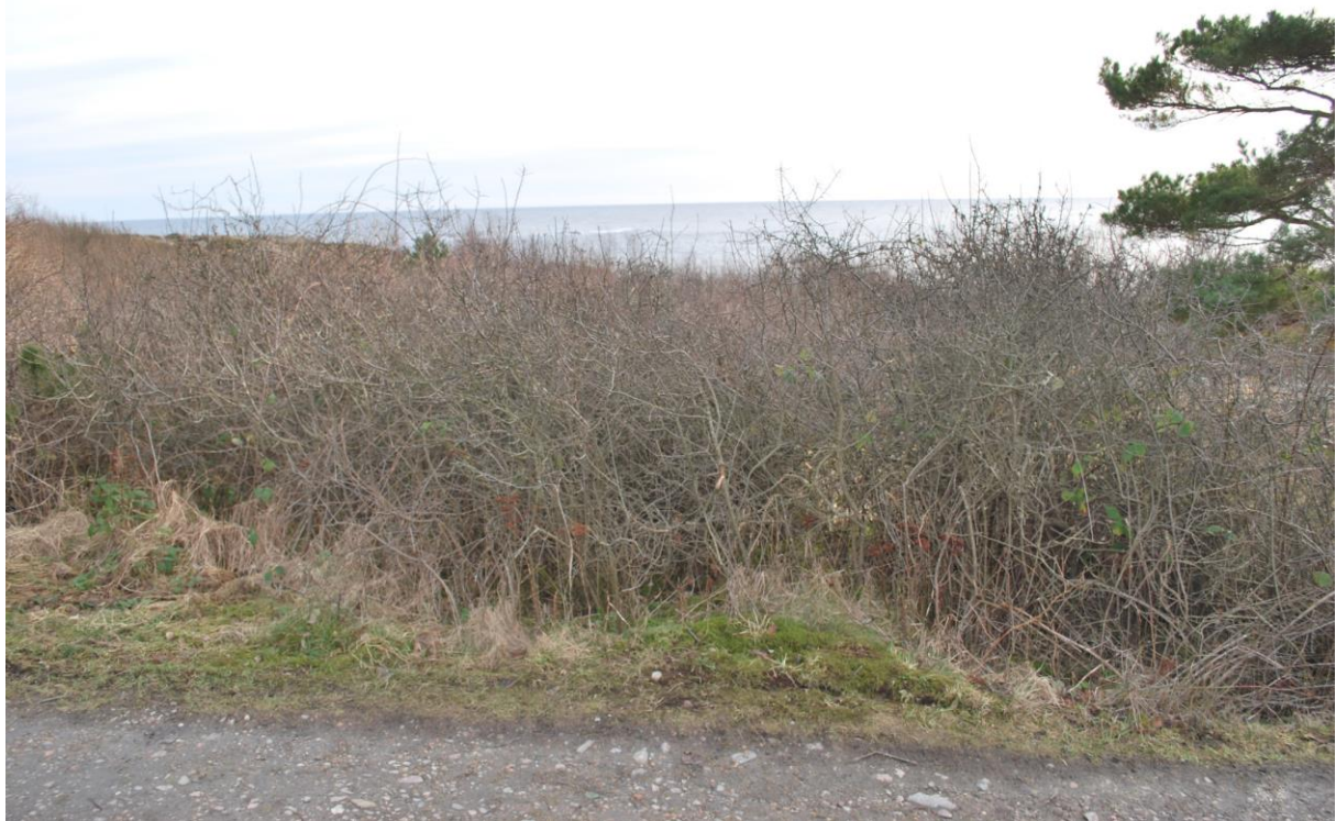
Figur 23. Slåpetornkratt på nedsiden av veien vestover nær rasteplass/parkeringsplass. Mye av dette kan spares ved at gjerdet til Felt 1 settes på baksiden av krattet.