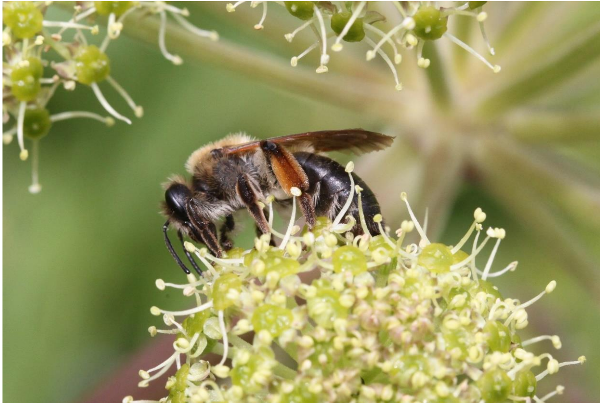
Figur 14. Tresandbie Andrena tibialis på strandkvann på Spornes, Arendal kommune.