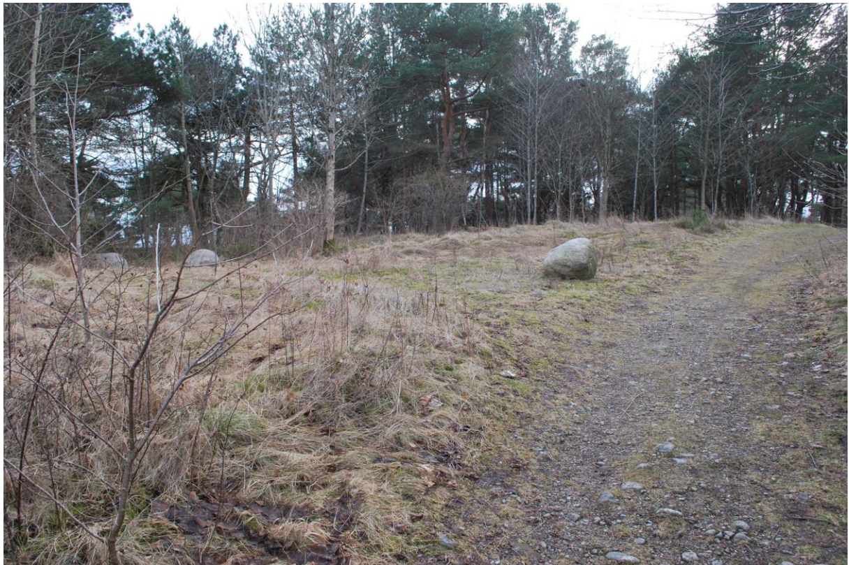
Figur 22. Eng nærmere Hoveleiren, se X2 Figur 13 og 17. Tilgrensende skog i bakgrunnen kan tynnes til en mer lysåpen skog der de rettete furuene tas ut, og de med karakteristiske, krokete spares.