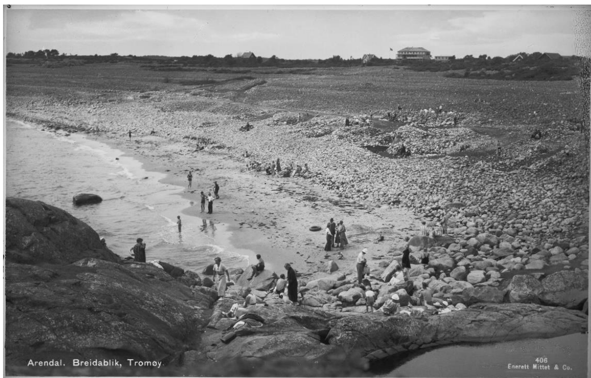
Figur 3. Spornesstranda på Tromøya ved Arendal, år 1900. Området er prega av åpen rullesteinsstrand over store areal. Vegetasjonsdekke kan skimtes mellom steinene i forgrunnen, langs Tangveien og på tangplassene der tang til de ulike gårdene ble samla og tørka. Spredt i de øvre delene forekommer det noen områder med busker.