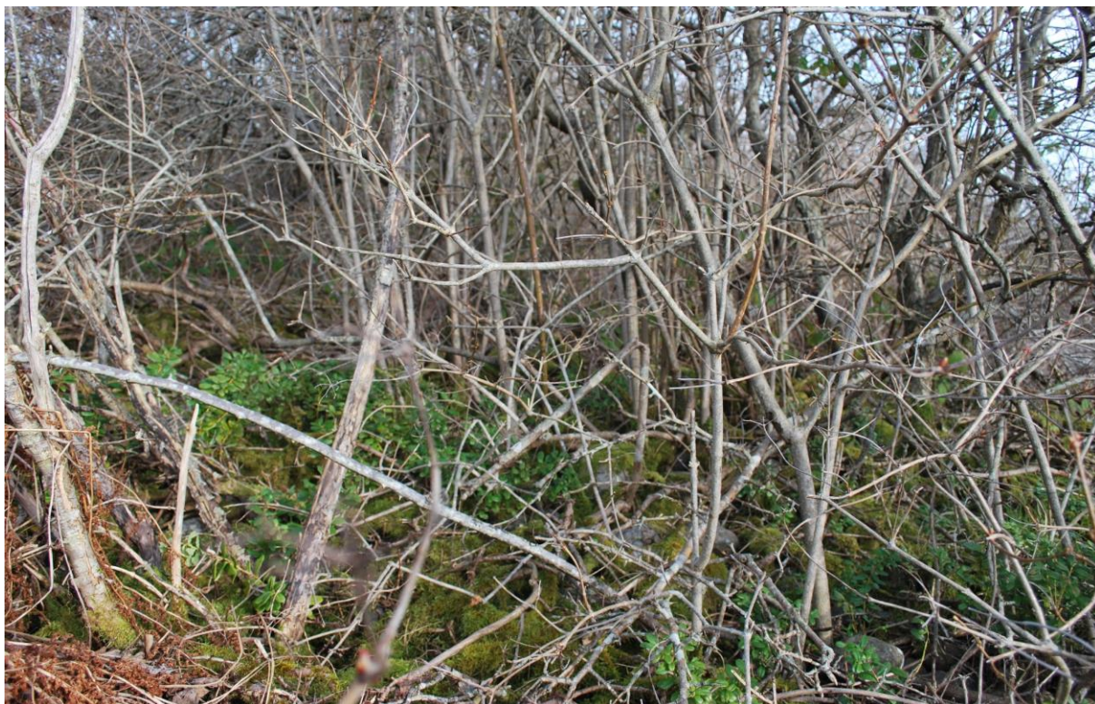
Figur 27. Inne i den tette krattvegetasjonen er det mange steder i bunnen et godt utvikla mosedekke, mye siden det er skyggefullt og fuktig. Her også med en del tyttebær i feltsjiktet. En må regne med at mosedominansen endrer seg med økt lystilgang og endra mikroklima. Hvor tykt humuslaget og vegetasjonsdekket er varierer en god del i området. Det er derfor vanskelig å si hvor mye natureng det reelt blir etter gjenåpning.