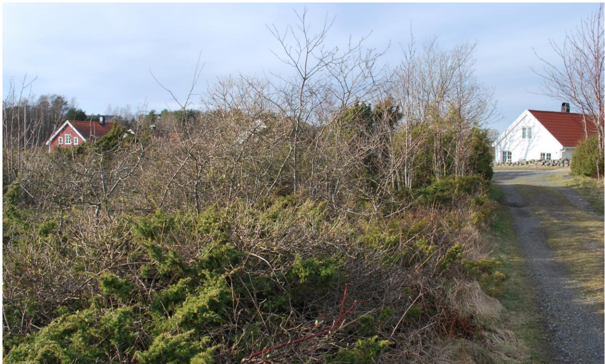
Figur 30. Fra felt 2 som skal gjenåpnes. Her dominerer bl.a. mye einer.