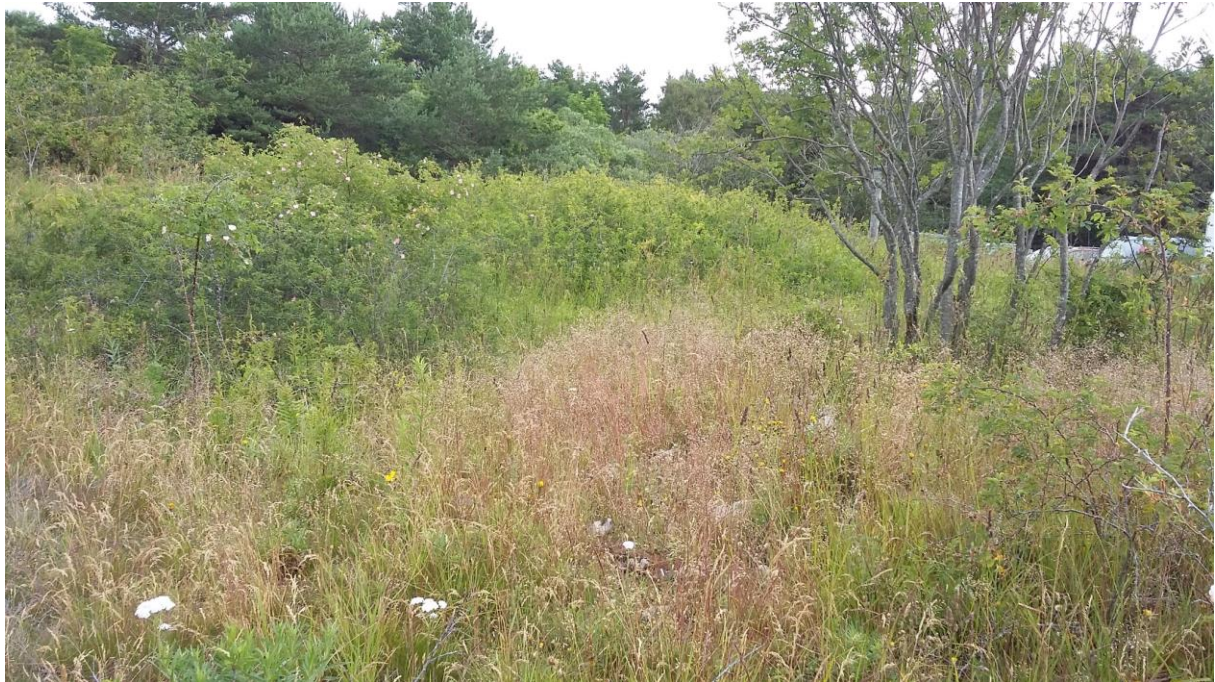
Figur 19. Eng med slåpetornkratt nær parkering. Denne vil være aktuell å restaurere med tanke på slåttemark. Det ble registrert naturengarter som tilsier at slått vil være rett skjøtselsform. Det bør spares slåpetornkratt fortrinnsvis inn mot kantene og rundt gjenstående trær i enga, se også Figur 17.