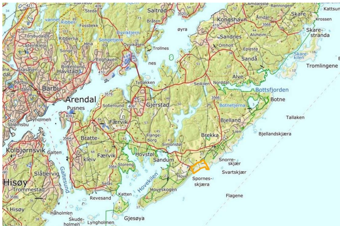
Figur 1. Skjøtselsplanområdet på Spornes er markert med gul avgrensning. Spornes ligger på yttersida av Tromøya ved Arendal. Kart: www.gardskart.no

Rullessteinsstranda på Spornes er en del av raet og har store geologiske verdier med godt synlige terskler fra landhevingen etter siste istid. Men gjengroingen dekker nå over store deler av de geologiske fenomenene og forringer ved det mye av det karakteristiske uttrykket. Ved en gjenåpning vil de kvartærgeologiske formasjonene igjen kunne bli mer framtrede og tydlige.