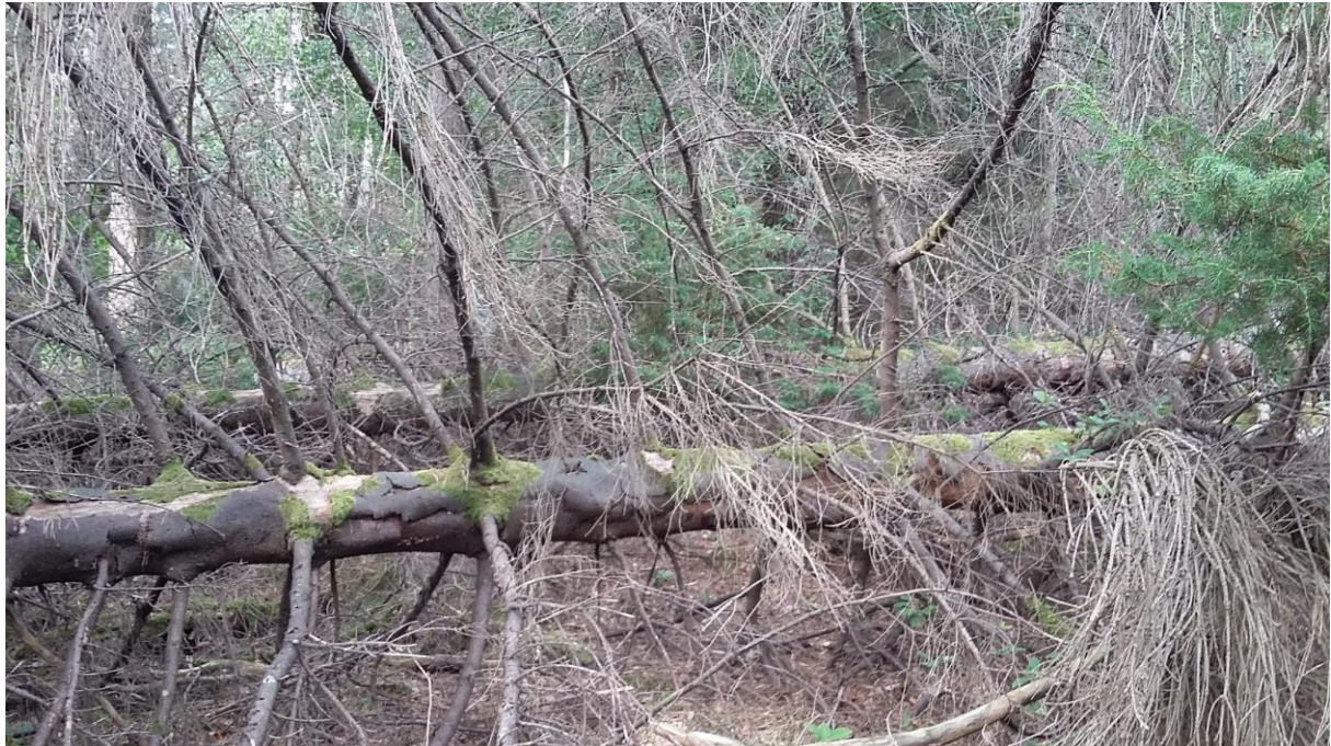
Figur 31. Vindfall av gran inne i nærliggende skog ved parkering. Død ved er viktig for bl.a. mange insekter.