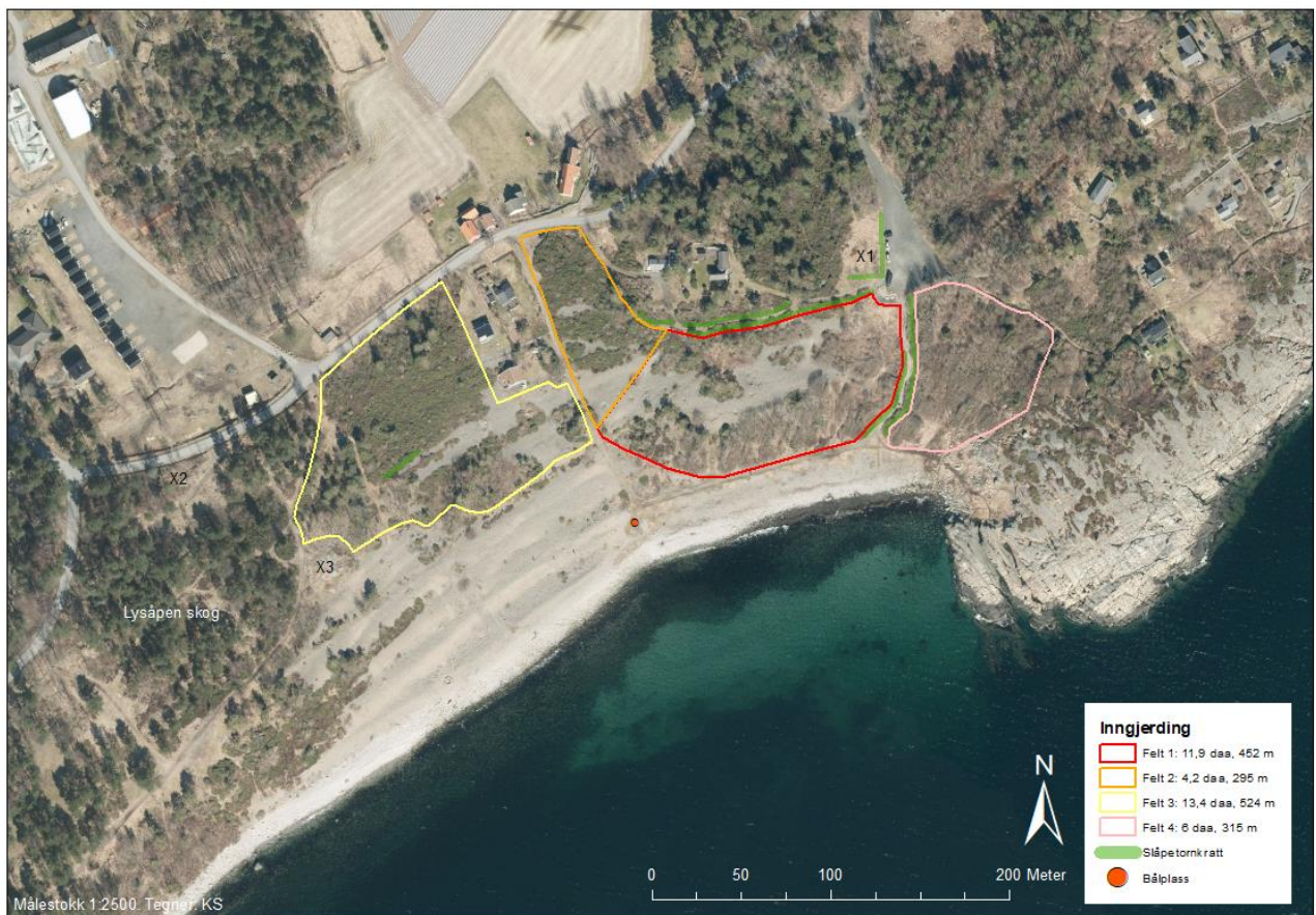
Figur 17. Inndeling i aktuelle arealer som prioriteres for gjenåpning. Felt 1, rød markering, har førsteprioritet over felt 2, 3 og 4. Farva streker antyder gjerdeplassing. Gjerdene kan om mulig settes opp i rette strekk, slik at rike kantkratt kan spares utenfor gjerdene, se grønne markeringer.