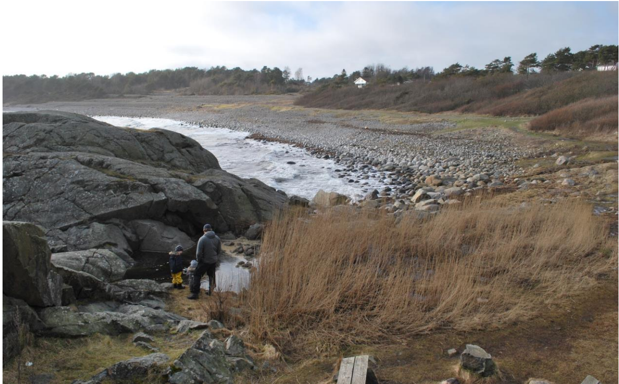
Figur 5. Spornesstranda i mars 2020, sett fra Spornesodden og omlag fra samme sted som bildet fra 1900, se Figur 3. I forgrunnen var det tidligere et steinbrudd som ble laga av tyskerne under 2.verdenskrig. Her er det i nyere tid fylt på masse som har hatt en naturlig revegetering etterpå. Foto Kristine Sundsdal 2020.