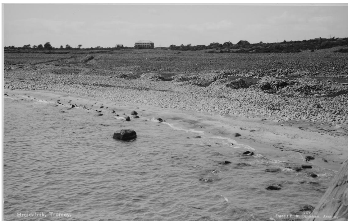
Figur 12. Spornesstranda for over hundre år tilbake, med hotellet (nå Arendal Herregård) i bakgrunnen. Ned mot sjøkanten sees tydelig tangvollene der hver gård hadde sin faste plass for å mellomlagre tang før henting. Denne tangretten er fortsatt i bruk. Foto: Mittet & Co 1.1.1900 Bredablik. Kilde: Nasjonalbiblioteket.

Etter krigen har det kun vært sporadisk med beitedyr i området. På 1980-tallet beita en fjording i området her. 5