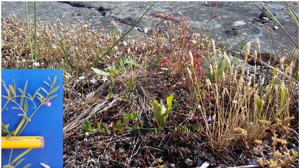
Figur 11. Utsnitt av tørrberg/tørrengvegetasjon innen skjøtelsesplanområdet med bl.a. småsmelle, blåfjær, harekløver, dvergsmyle, flerårsknavel, kystgriseøre, småsyre. I dette området vokste også vårvikke, EN (innfelt). Varme tørrenger er gode insekthabitater.