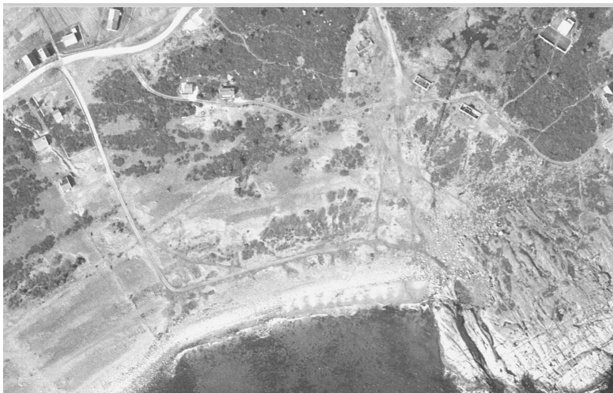
Figur 4. Flybilde fra 1968 over deler av Spornes. Områdene med mørk grå farge er busker og kratt, noe lysere grå viser vegetasjonsdekke, mens lysere felter domineres av rullestein.