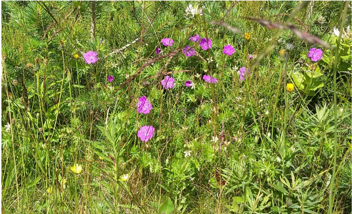
Figur 10. På Spornes i tørrenga rett ved bunkers, innimellom småfurer og kratt, vokser det bl.a. blodstorknebb, smalkjempe, skjermesveve, prestekrage, legeveronika og føllblom.