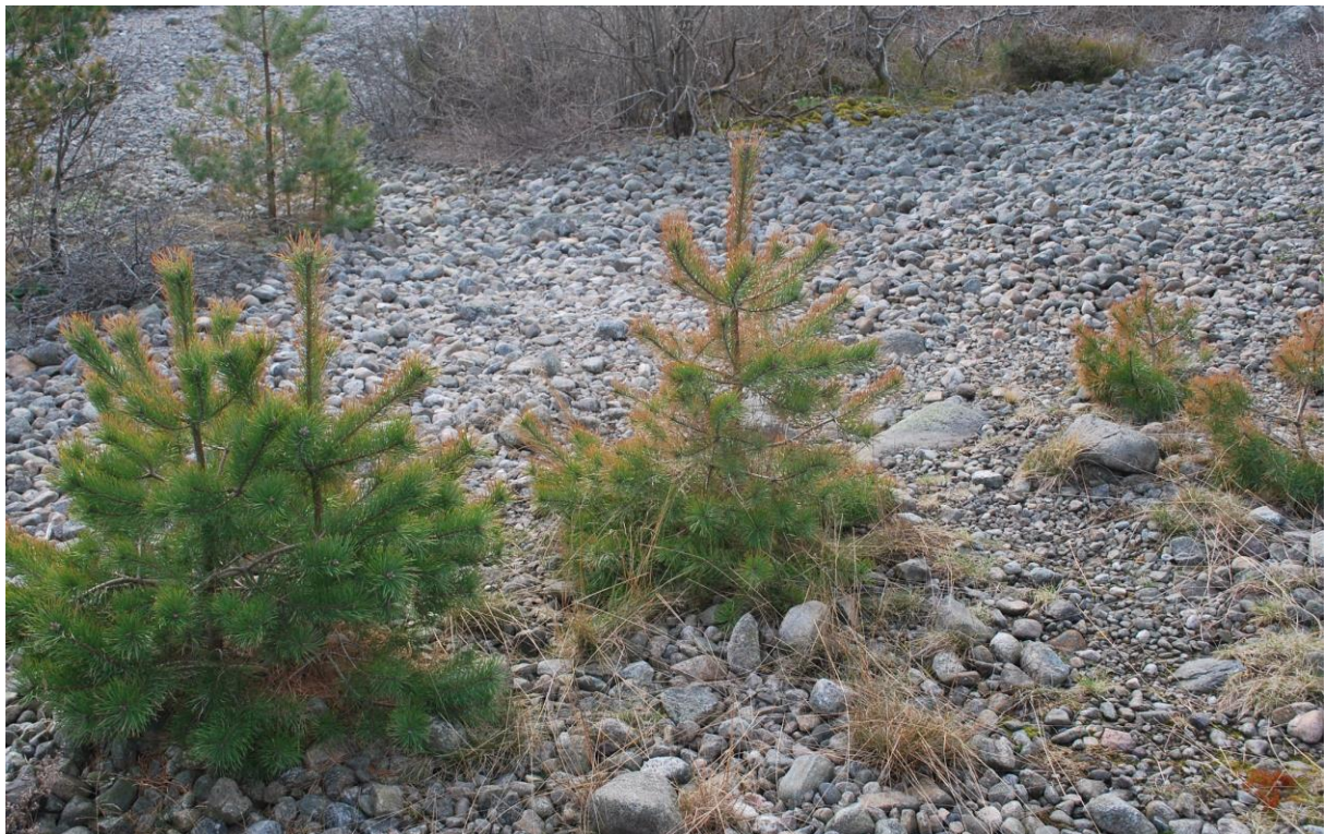
Figur 26. Enkeltstående trær på vei opp utenom inngjerdingene bør rykkes opp/fjernes.