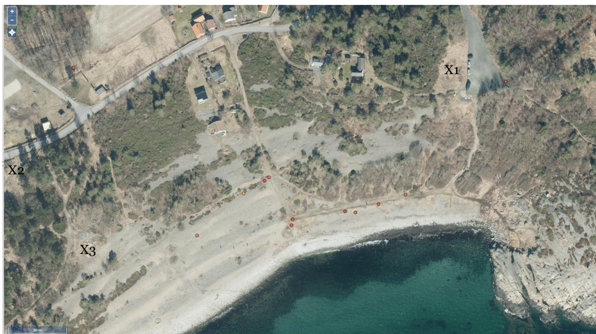
Figur 13. Prikkene viser rødlistede karplanter og sopp innenfor skjøtelsesplanområdet på Spornes. X1, X2 og X3 markerer områder med engvegetasjon befarat 3. juli 2019. I tillegg ble det også registrert naturengflora langs stier og i åpne vegetasjonsområder.

Spredt i området fant vi også fremmedarter som platanlønn, edelgran, klustersvineblom og rødhyll. Se Vedlegg 1, tabell 4. for flere fremmedarter i området.