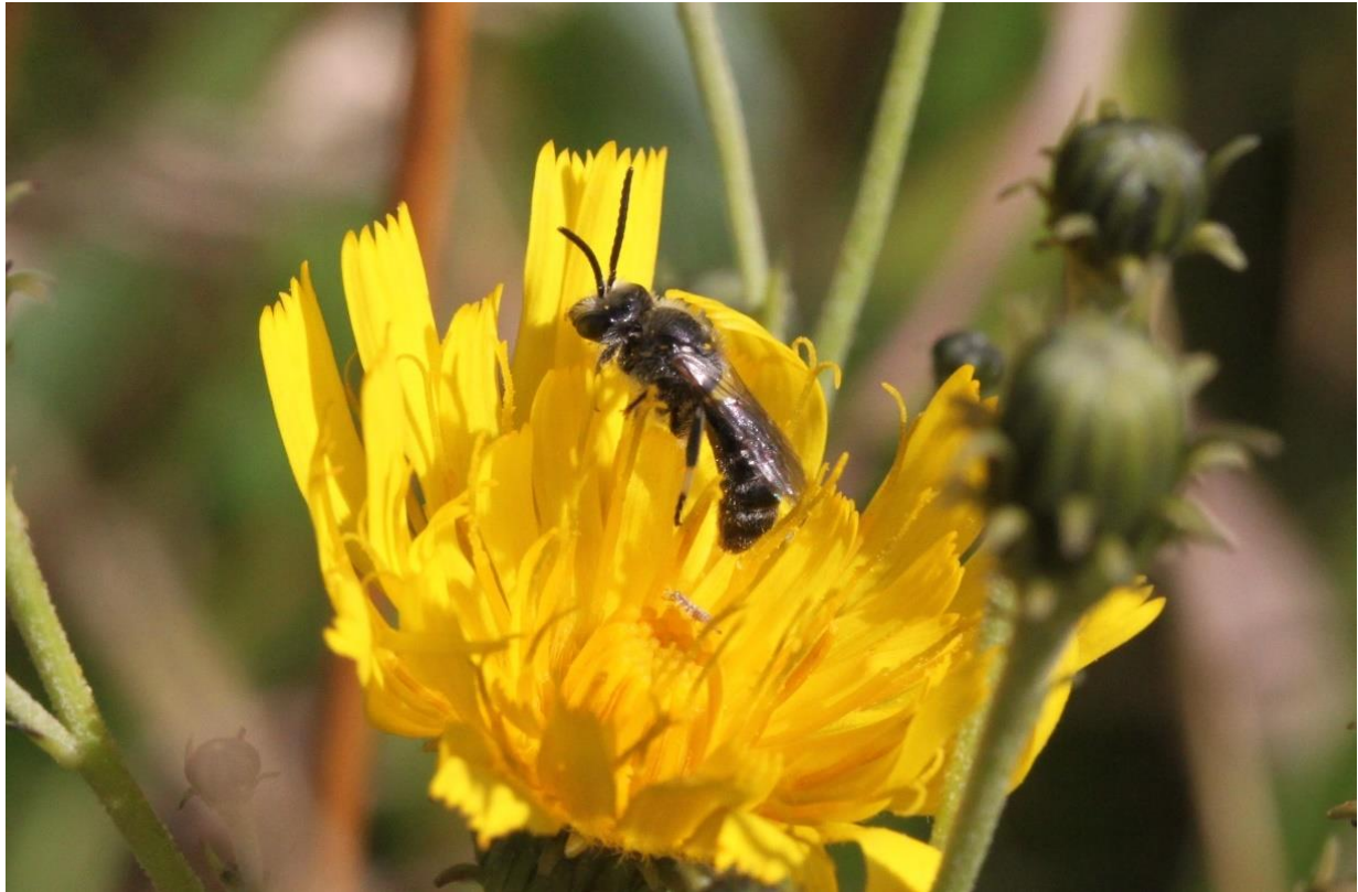
Figur 16. Markjordbie Lasioglossum leucozonium hann på skjærmsveve på Spornes, Arendal kommune.