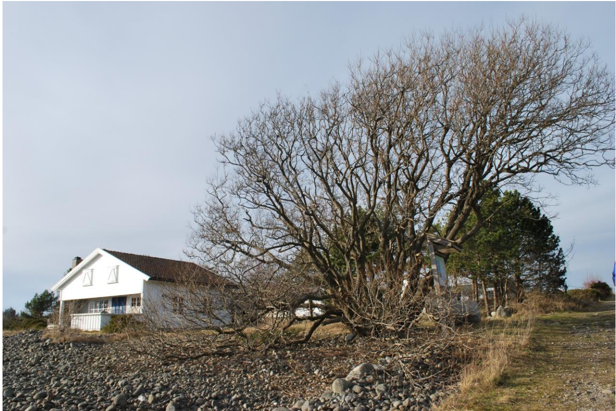
Figur 29. Stor selje inntil Tangveien. Denne står utenom beiteområdene og bør få stå uberørt. Ei av de fem private hyttene ses i bakgrunnen.