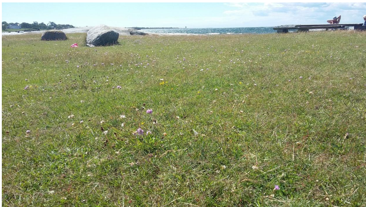
Figur 7 Strandnært og artsrikt naturbeite i Kuhavna på Jomfruland. Jomfruland er lik Spornes en del av det store raet. Foto Ellen Svalheim, juni 2016.

Beste måten å skjøtte ei gammel artsrik naturbeitemark på, er å følge opp den tradisjonelle driftsformen, uten tilført gjødsel og med fortsatt beite. Det tradisjonelle utnyttelsen har variert fra sted til sted avhengig av driftsform og tilgang på dyreslag. Derfor er det viktig å finne ut hva som har vært vanlig på den aktuelle lokaliteten eller i nærområdet fra gammelt av. Helst bør en bruke samme dyreslag som har beitet området før.