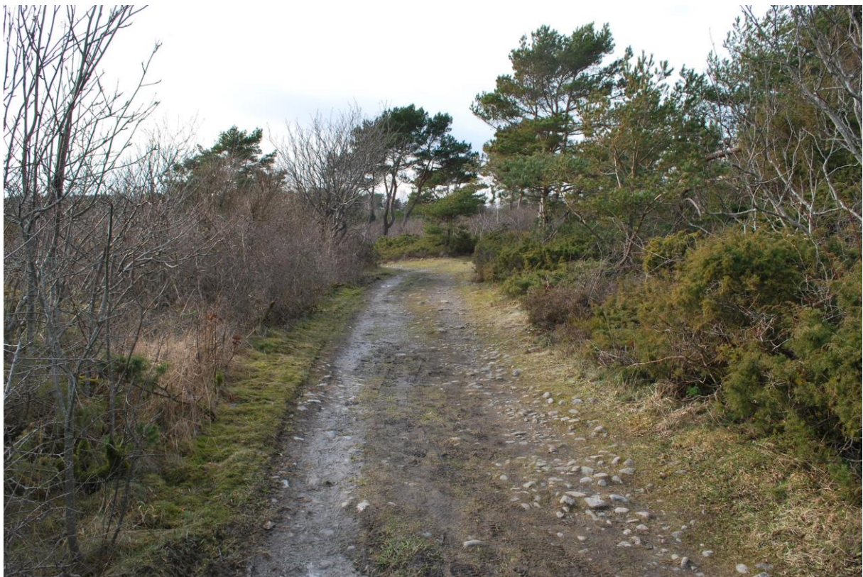
Figur 24. Endel semi-naturlig vegetasjon vokser langst veier og stier innen skjøtselsplanområdet. Her er veien som går rett vestover fra parkering i de øvre deler. Merk slåpetornkrattet som vokser på venstre side av veien og som kan spares om en setter gjerdet til felt 1 på innsiden av dette.