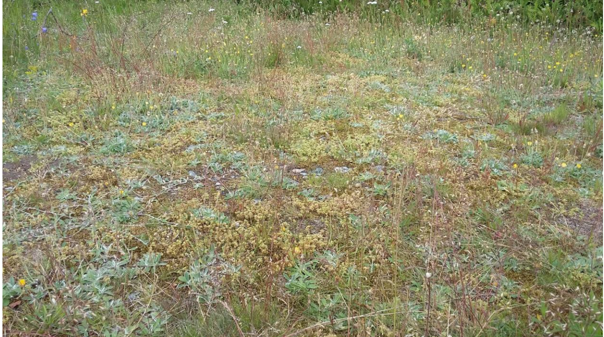
Figur 21. Tørrengvegetasjon i eng nær parkeringsplass/sti vestover. Her vokser mye hårsveve som er ei viktig matplante for mange insekter.