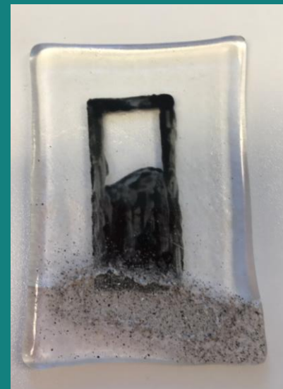
Portalen i glass v/Bjørg Kunsthandverk