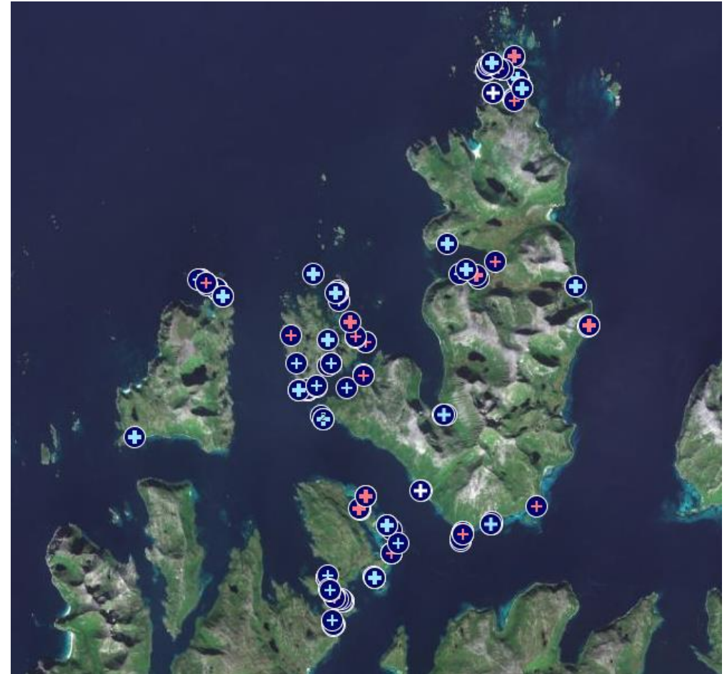
Kart som viser felt mink fra 2020 til 2023. Blå kors hanner og røde tisper. Totalt 152 stk.