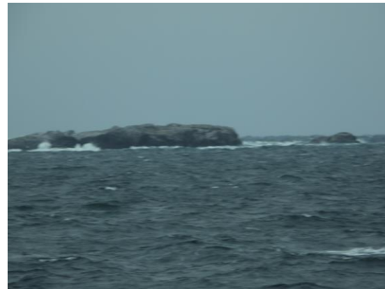
Bilder fra Kvitvær. Til venstre havsule i 2008. Til høyre tomme holmer i 2023.