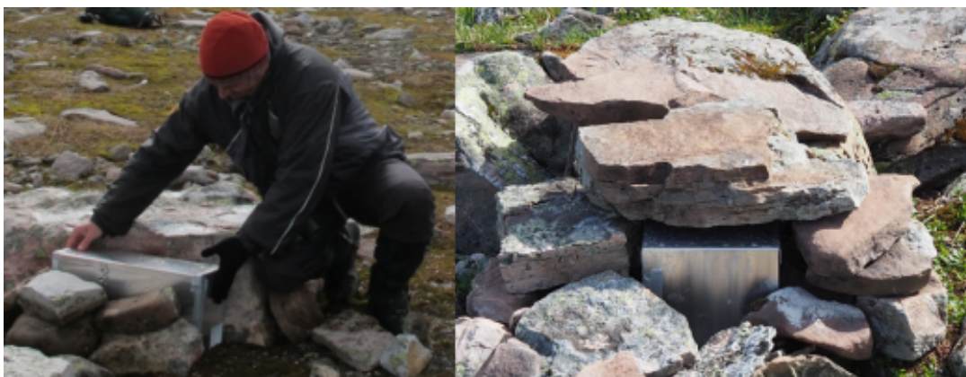
Figur 2. Innplassering av en kamerafelle i terrenget (venstre), og kamerafella etter at den har blitt forankret og dekket av steiner (høyre).

Kamerafellene plasseres på steder i terrenget som ut fra vegetasjon og topografi kan forventes å ha tilstedeværelse av lemen og andre småpattedyr. Det brukes ikke åte i fellene i og med at lemen og mange andre arter bruker kamerafellene som en naturlig passasje i terrenget. For at kamerafellene skal være beskyttet for vind og inntrenging av snø dekkes metallboksen med steiner (Figur 2). Dette gjør også at fellene er svært lite synlige i terrenget.