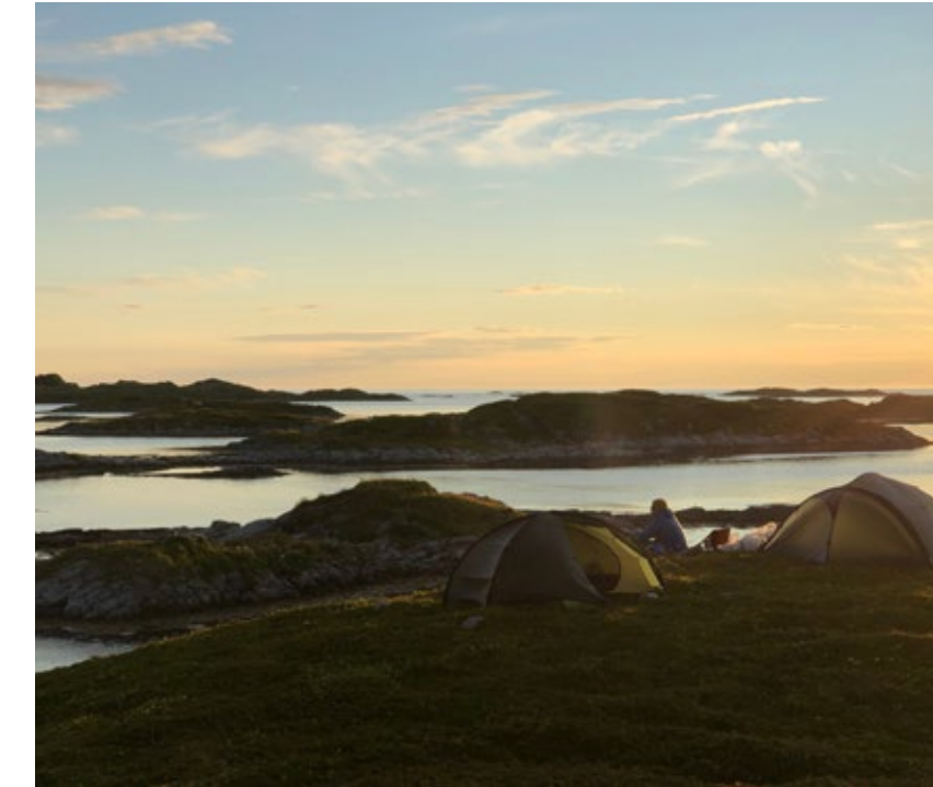
Det er mange flotte steder å sette opp teltet.

Det finnes flere toppturer man kan ta i og nær verneområdet. Ønsker man å gå til toppen av Store Måsværet (138 moh) eller opp Grøtøyaksla (545 moh) må man først ta båt ut. Også på Nordkvaløya er det en rekke topper man kan bestige – blant annet Sørskarkollen (251 moh) hvor det er satt opp to varder som viser trygg innseiling inn Sørskarvågen. Dersom man ikke har båt kan man ta ferja over til Rebbernesøya og gå opp Helvetestinden (675 moh), og fortsette rundløypa til Stortinden (629 moh) før man går ned til bilen eller over til Breivika. Turen kan karakteriseres som noe krevende, ettersom det er bratte partier og smale egger å forsere.