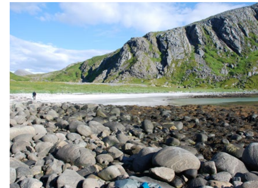
Rullesteinsfjære og kritthvit sandstrand.