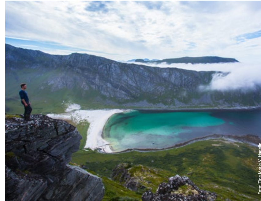
En topptur kan gi belønning i form av flott utsikt over øyer og hav.

Det yrer av liv i det næringsrike havet, og den ivrige fisker kan få både torsk, sei, kveite og steinbit på kroken. Når du er ute med båt kan du dessuten treffe på både steinkobbe og den største av selene våre, havert. Er du riktig heldig, får du øye på spekkhoggere eller knølhval. Det kan også være mulig å få se en oter eller to som leker seg i fjæresteinene. Ta med kikkert og kamera, og nyt dette ville og vakre verneområdet.