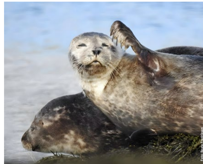
Det er god sjanse for å få sett steinkobbe og andre selarter.