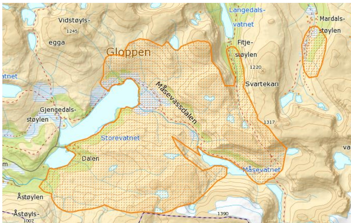
Kartutsnitt som syner kalvingsområda til reinen i Førdefjella siste åra.

Dei mest sårbare områda for villreinen er altså kalvingsområda og områda som fostringsflokken brukar fram mot kalving. Dei siste åra har reinen hatt kalvingsområde aust og sør for Storevatnet i Gjengedalen I tillegg bør ein ta omsyn til vinterbeita, og trekkvegane som reinen brukar mellom ulike beite- og kalvingsområde. Ein må og vere klar over at områdebruken endrar seg over tid, og gjerne går i syklusar. Den mest sårbare perioden gjennom året er april og mai.