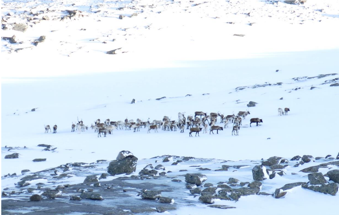
Villreinflokken i Førdefjella villreinområde fotografert på vinterbeite ved Vardevatnet i januar 2017.

Noreg har eit særskilt internasjonalt ansvar for å ta vare på villrein. Ti av villreinområda er definerte som nasjonalt viktige villreinområde. Førdefjella er ikkje blant desse, men det særskilde ansvaret for villrein skal likevel vektleggast i forvaltninga.