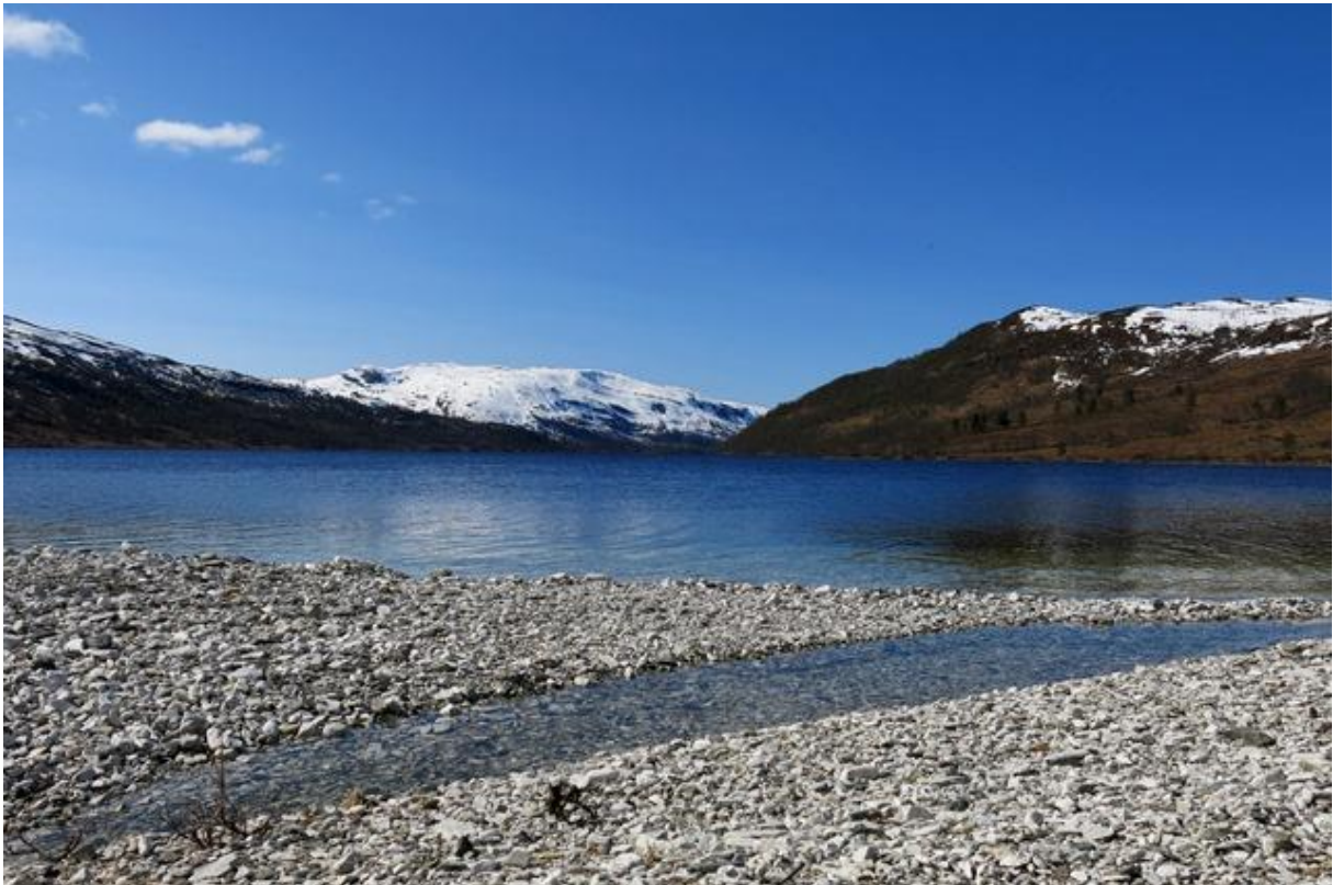
Byrkjeneset i Gjengedalen