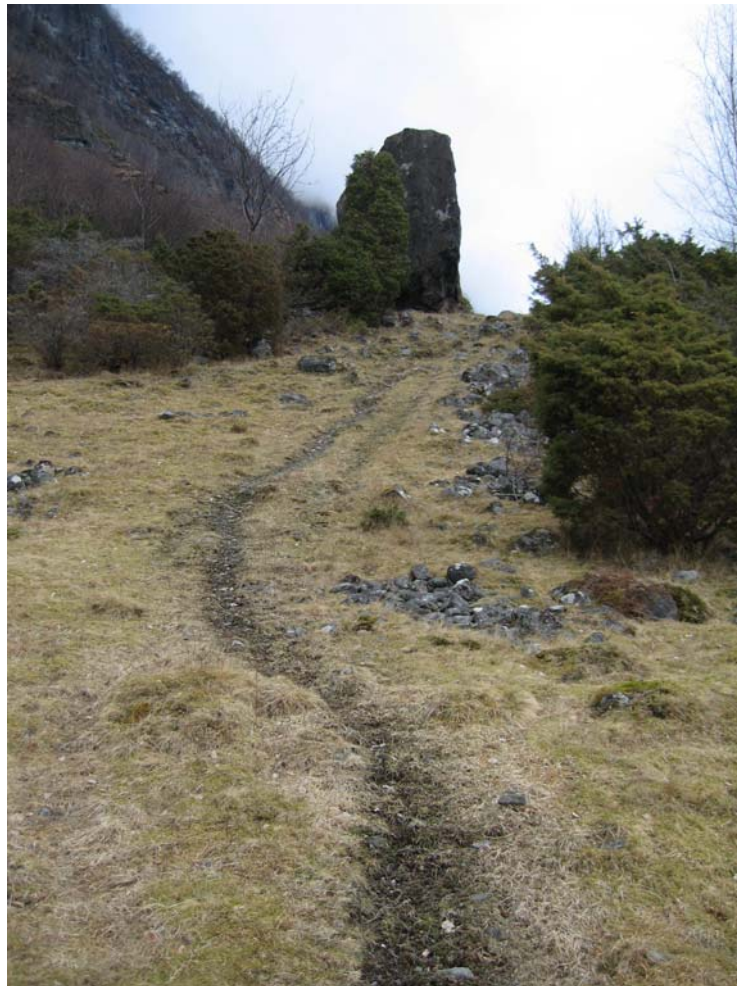
Figur 1 Starten på stølsvegen frå Inste Fronnes

Fronnes har framleis nokre opne areal og mykje areal som er i varierende fase av gjengroing. Eit av delmåla er å ta vare på dei kulturlandskapskvalitetane området framleis har, og opne opp landskapet slik at det får tilbake noko av sitt opphavlege preg. Det er ikkje noko mål å fjerne all vegetasjon for å gje inntrykk av intensiv drift. Planen freistar heller å finne eit realistisk mål som vil føre området tilbake til eit stadium av aktiv, men noko ekstensiv drift, som har vore typisk for siste generasjon si utnytting av areala "bortom" (på motsett side av fjorden for garden). Neset er tydeleg kulturpåverka og beite- og slåttebruk bør syne att i landskapet.