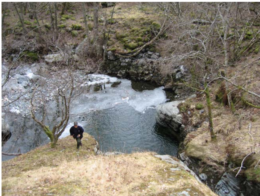
Figur 11 Naturleg, og opphavleg plass for bru: det smalaste partiet ovanfor kulpen.