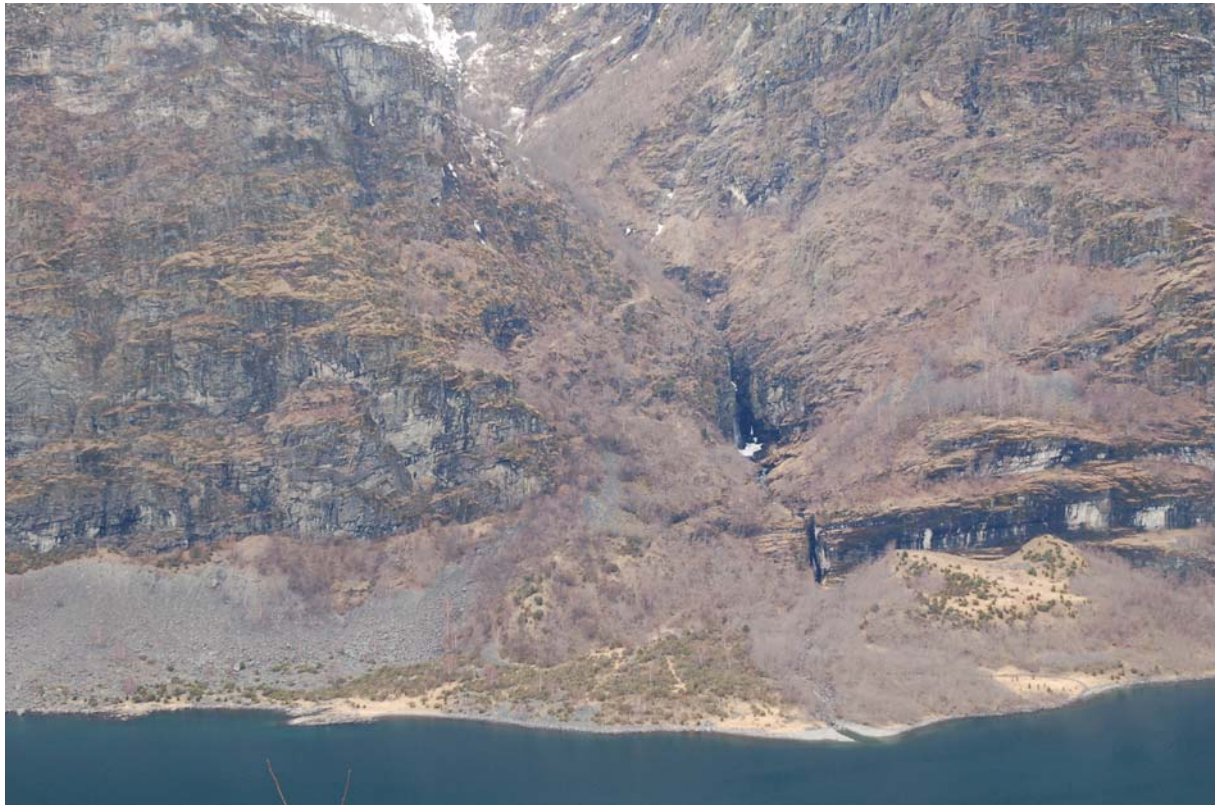
Figur 4 Oversiktsbilete teke i april syner tydeleg dei fire opne men gjengroande areala og dominansen av einer på Inste Frønnes og gråor på Ytste Frønnes

Tidlegare har området vore nytta til slåttemark og beitemark for geit. Slåttebruken har opphøyrd, og beitebruken er sterkt redusert noko som fører til kraftig gjengroing av einer. Gråorskogen utvidar seg og kraftig. Lokalfolk seier at veksten av skog og einer har skote større fart dei siste ti åra. Dei enno opne areala minkar no kvart år. Ein kan likevel framleis sjå att strukturar etter den gamle bruken. Noko slåttemark er framleis ope, og steingarden som heldt beitedyr ute frå viktig slåttemark, er framleis høg og intakt over lengre strekkjer. Utanom fortidsminna og spora etter slått og beite, fortel veiter og murar om utnytting av kraft frå elva til kvernhus og sag.