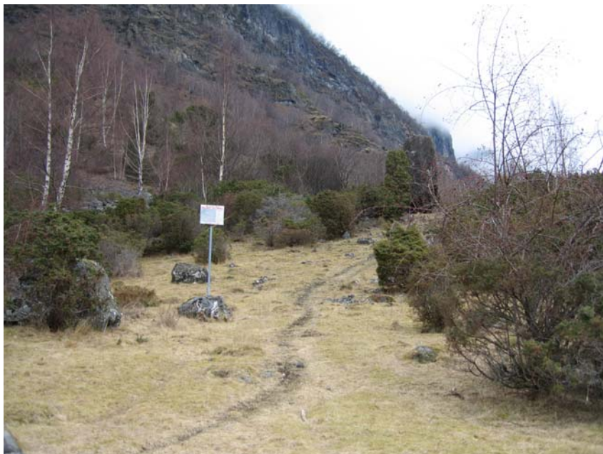
Figur 10 Skiltet med åtvaring om skytefelt på Grindafletene bør samlokaliseras med informasjonsoppslag for Fronnes, på den store steinen.