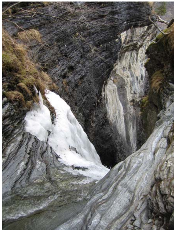
Figur 2 Frondøla lager juv og jettegryter

Den sørlege terrassen ligg lågare i terrenget. På terrasseflata har det vore beitemark, men no er vegetasjonen i hovudsak tett einer. Det er opna nokre gater og stiar for å lette sauesankinga. Nedre nivå er delt i to mindre flater som består av eng delvis attgrodd av einer. Engene avgrensast nedover mot sjøen av strand. Mellom desse engene går terrasseskråninga heilt ned i sjøen. Skråninga er her bygd opp av rasmassar og ikkje grus. Langs kanten av denne terrassen ligg ei samling av i alt 9 gravrøyser av ulik storleik. 2-3 av desse er godt synlege i terrenget og kan oppfattast som gravminne også på avstand.