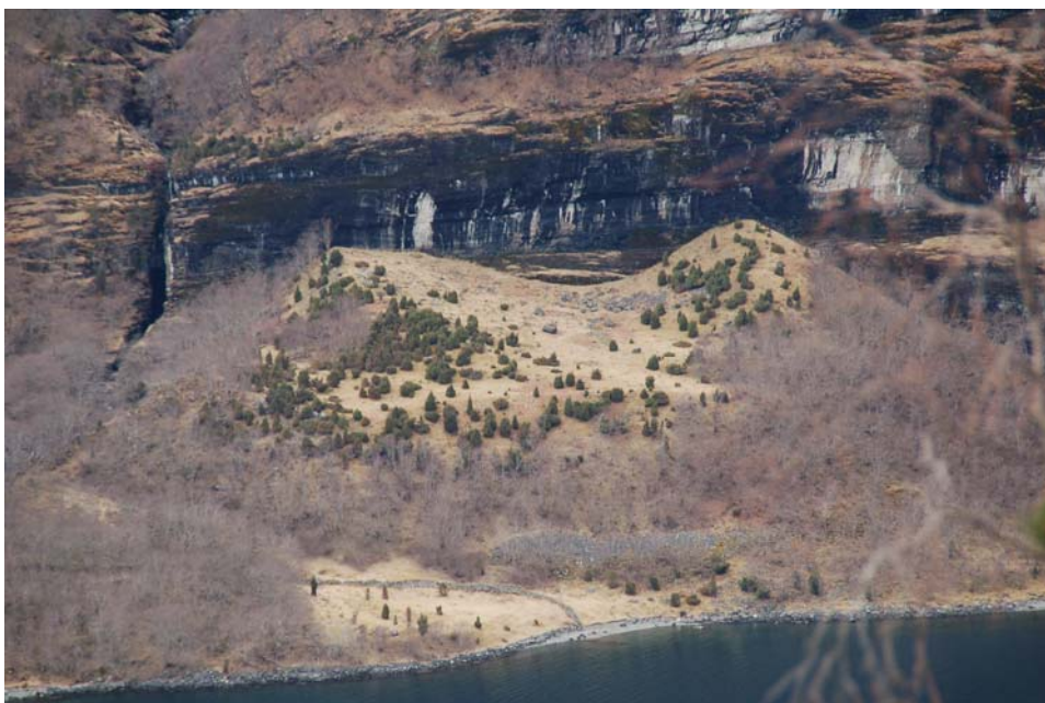
Figur 5 Ytste Fronnes, april 2006

Dette er eit område med tydelege spor etter bruk av elvevatn til kraft. Øvst i feltet er eit veiteuttak til ei stor veit med mura sider. Denne veita går heilt til sjøen. Nede ved sjøen ligg ein mur som er restar etter ei sag som sto her (sjå kap. 5.4.2, Kulturminne). Mellom veita og elva ligg og fleire murar etter kvernhus. Dette området ligg inne i eldre gråorskog. Ingen informantar kan hugse anna enn at det har vore skog i dette området.