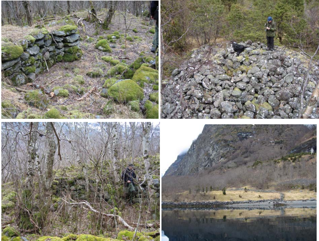
Figur 9 Stein utgjør mange typar kulturminne: øvst, v: murar etter kvernhus, øvst, h: gravhaug nr. 6, nedst, v: murar etter stølshus som forsvinn i skog, nedst, h: steingarden på ytste Fronnes.

Utanfor slåtteearealet, like inne i gråorskogen ligg ei større tuft som har vore stølshus. Fronnes vart sist nytta til vår- og hauststøl av Lensmannsgarden (bnr.1). Sidan vart eigedomen teken over av andre på Onstad, som nytta området som slåtteeareal til fram på 40 - talet. Stølen er registrert i ei undersøking kring norske stølar i Noreg gjennomført på 1930 - talet av Bondesamfunnsavdelinga ved Institutt for samanliknande kulturforskning i Oslo (Sætrar og Sæterbruk i Noreg). Han var på den tida allereie nedlagd. Den nyare tufta på enga kan ha vore ei løe el. anna mindre bygg knytt til stølsdrifta. Det høge steingjerdet som framleis er mykje intakt har og truleg vore knytt til stølsdrifta.