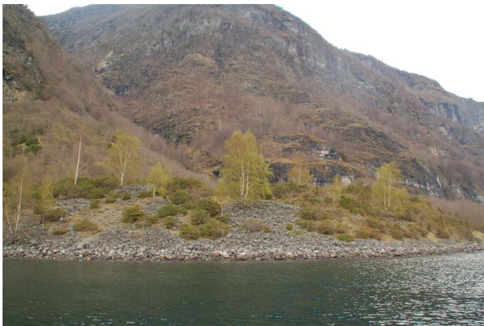
Figur 3 Terrasseskråninga på insta Fronnes med gravrøyser dels skjult av gjengroing.

Fronnes har ei lang brukshistorie. Jernaldertufta syner aktiv bruk i minst 1000 år. Ennå før dette, truleg i bronsealder (1500 – 500 BC) var neset nytta som gravplass. Opphavet til gravrøysene kan tolkast på fleire måtar. Eit forslag som kjem fram i bygdeboka, er at det kan ha vore garden Otternes på andre sida av fjorden, som har hatt gravrøysene sine der.