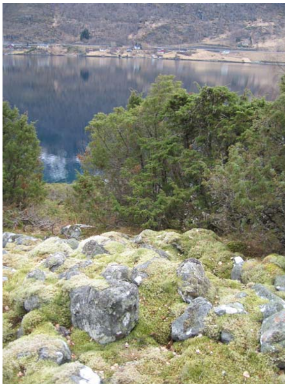
Figur 6 Einer sperrar for utsynet, her frå gravhaug nr. 7

Utanom desse areala er det ei sone med rasmark i terrasseskråninga mot fjorden, under delområde for fornminne. Denne har delvis vakse til med einer og har noko bjørk. Kring delområde C og eit stykke utover langs fjorden er det tidlegare ope areal som no er kraftig tilgrodd med einer. I skråninga over delområdet veks lauvskog, i hovudsak gråor-heggeskog med mykje hegg og innslag av meir krevjande treslag som alm og hassel. I nokre soner dominerer bjørk, og skogen er broten opp av steinrøyser. Høgare oppover mot Frondalen kjem bjørka gradvis sterkare inn.