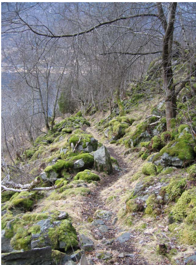
Figur 8 Stølsvegen er lett å fylgje innanfor området til skjøtselsplanen

Ein mindre sti tar av frå stølsvegen og går fram til øvste fossen.