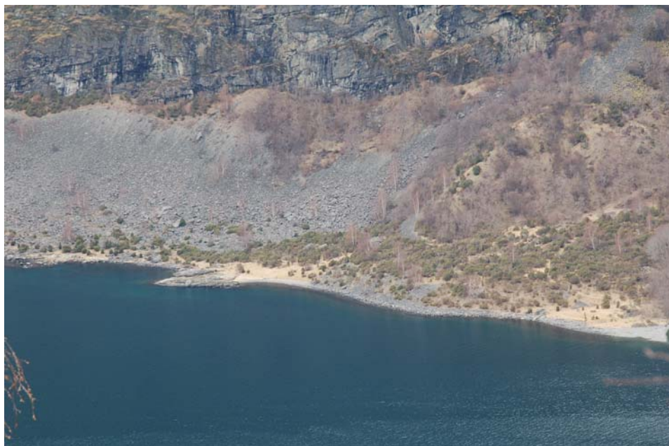
Figur 7 Inste Fronnes, april 2006

Utanom desse areala er det ei sone med rasmark i terrasseskråninga mot fjorden, under delområde for fornminne. Denne har delvis vakse til med einer og har noko bjørk. Kring delområde C og eit stykke utover langs fjorden er det tidlegare ope areal som no er kraftig tilgrodd med einer. I skråninga over delområdet veks lauvskog, i hovudsak gråor-heggeskog med mykje hegg og innslag av meir krevjande treslag som alm og hassel. I nokre soner dominerer bjørk, og skogen er broten opp av steinrøyser. Høgare oppover mot Frondalen kjem bjørka gradvis sterkare inn.