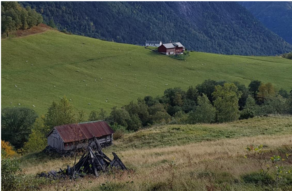
Figur 1 Stølen Løhaug med Drægo i bakgrunnen. Kopi frå søknad

Tak vert ikkje omfatta av denne restaureringa.»