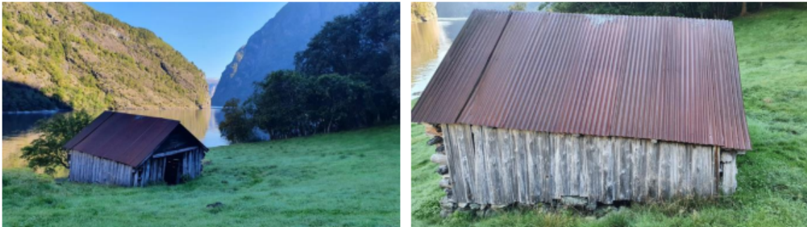
Figur 2 Langvegg med ytterkledning. Kopi av bilde fra søknad