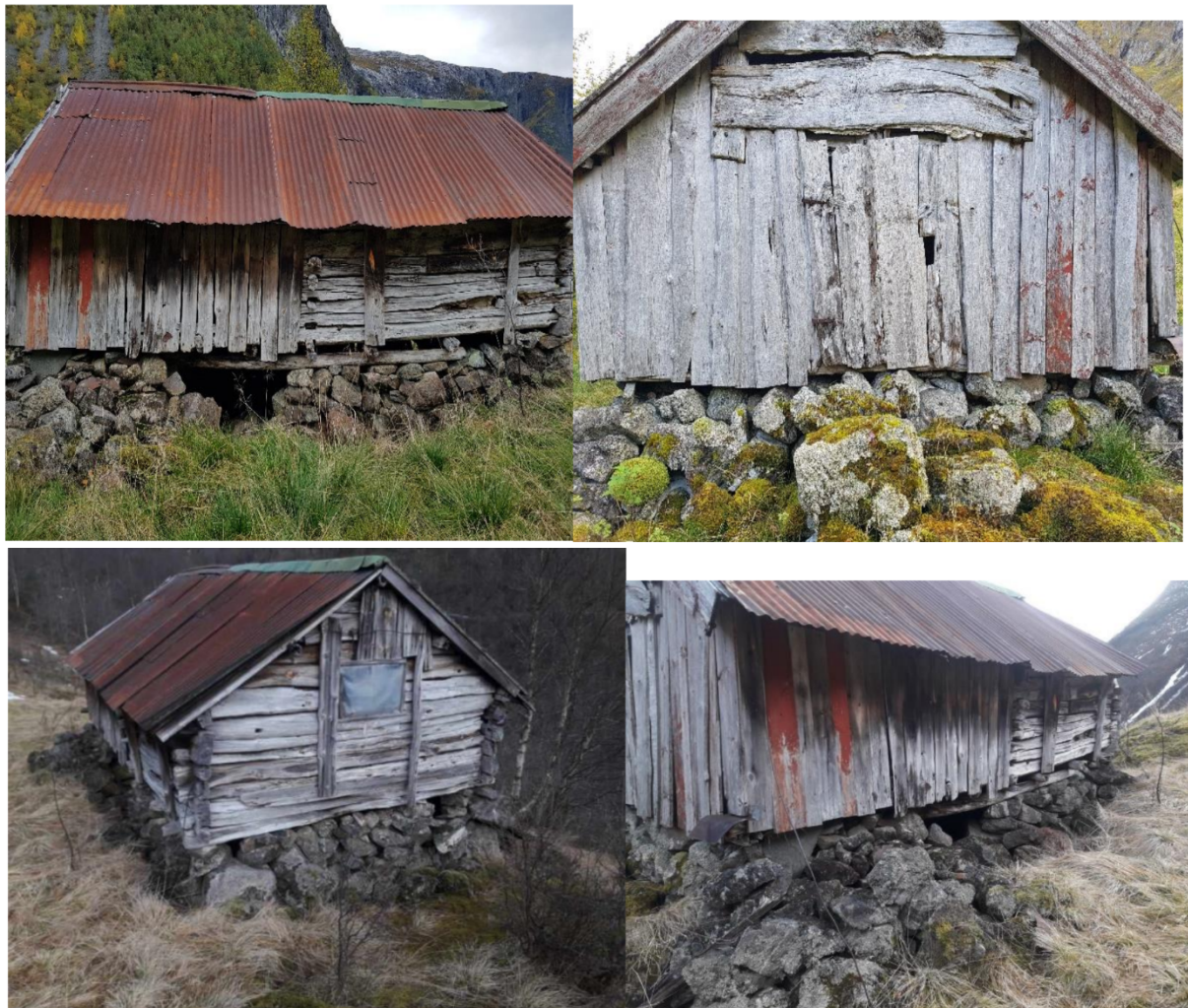
Figur 2 Bilde viser stølshuset slik det står i dag. Kopi frå søknad

Tiltakshavar opplyser at målet med restaureringa er å ta vare på eit kulturhistorisk verdifullt stølshus. Stølen er eit viktig opplevingselement. Dei vil bruka stølen til overnatting for fotturistar, og til privat bruk i samband med turar, jakt og fiske.