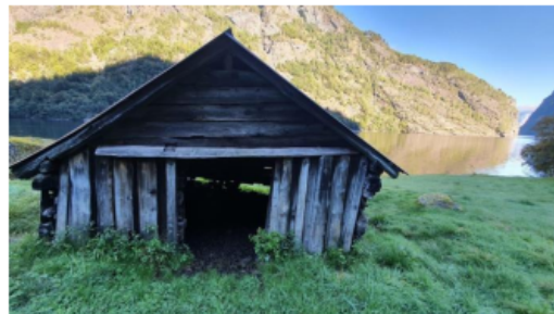
Figur 1 Kopi av bilde frå søknad