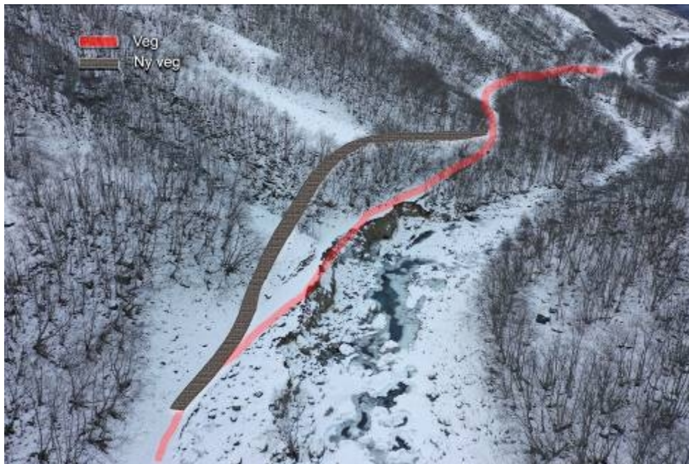
Figur 1 Bildet viser utgraving av gamlevegen (markert med raud strek) og framlegg til ny trase (grå strek).

Undredal sameigelag søker om å få reparera gamlevegen mellom Brattemoten og Langhuso. Vegen på dette punktet vart utgraven under flaum hausten 2020. Vegen har rasa litt meir etter flaumen. Denne vegen vert brukt som tursti, buføring med dyr og til uttak av ved. Fram til 1939 var det kløvjaveg fram til stølen. I 1939 vart vegen utbetra til kjerreveg, og vegbreidda vart auka til kring 2 meter breidde på fleire stader.