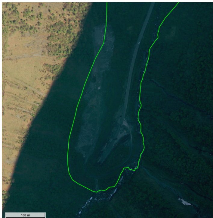
Fylkesatlas, flyfoto 2019 med vernegrensa for Nærøyfjorden landskapsvernområde

I sak 54/21 gjorde Nærøyfjorden verneområdestyre vedtak om retting av tiltaket med massedeponi i Nærøyfjorden landskapsvernområde. Viser til saksutgreiinga i saka. Etter vedtaket vart gjort kjend, vart verneområdeforvaltar kontakta av Miljødirektoratet med spørsmål om styret har vurdert å anmelding det ulovlege tiltaket med massedeponi i Nærøyfjorden landskapsvernområde. På bakgrunn av spørsmål frå Miljødirektoratet ville styret vurdere anmelding av tiltaket.