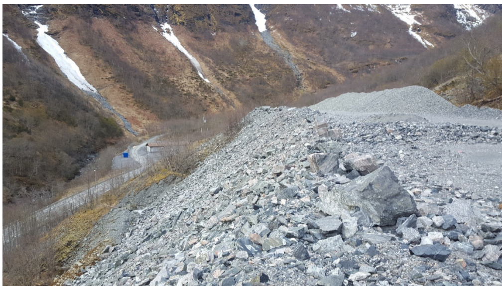
Deponerte massar på fyllinga ved Gudvangatunnelen. Kopi av bilde i brev frå Aurland kommune. Bildet er tatt 06.05.2021.

På Langhuso ved Gudvangatunnelen var det etablert eit massedeponi i samband med bygging av Gudvangatunnelen på 1980-talet. Dette deponiet var etablert før området vart verna som Nærøfjorden landskapsvernområde. Vernegrensa vart lagt utanom tunnelmunning og deponiet i dette området. Frå 2014 og fram til i dag (sjå flyfoto frå 2014 og 2019) er massedeponiet utvida, og deponiet er kome innanfor grensa til Nærøfjorden landskapsvernområdet. Heile dette området ligg i tillegg i verdsarvområdet Vestnorsk fjordlandskap. Bildet under er tatt frå den delen av massedeponiet som er innanfor landskapsvernområdet. Massane inneheld steinmassar frå tunnelen, og i tillegg restar av PE-skum frå tunnelen.