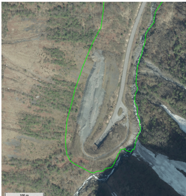
Fylkesatlas, flyfoto 2014 med vernegrensa for Nærøfjorden landskapsvernområde