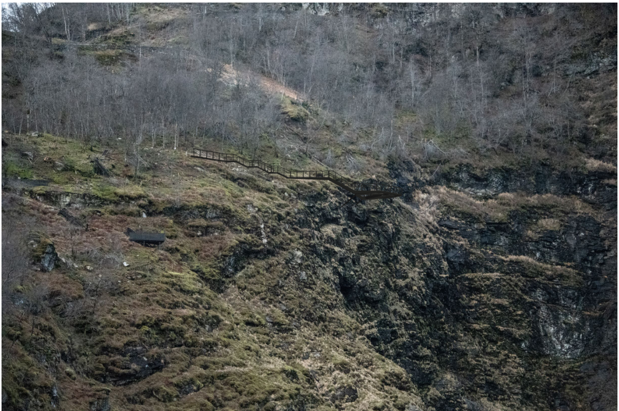
Figur 4: Innzoma bilde frå E16 (tatt frå same stad som figur 3)