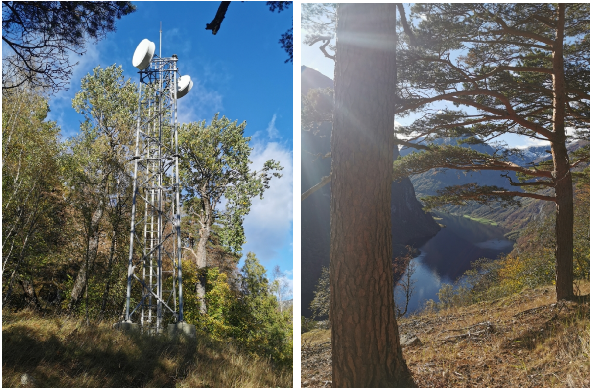
Figur 3. Trass i naudnettmasta som er satt opp er det framleis eit naturskjønt område på Rognaldsskori.

tidlegare. Kunnskapen om området er kjent gjennom forvaltningsplan for Nærøfjorden, skjøtselsplan for Skogane og gjennom synfaringar i området. Det er gamle styvingstre i området som viser at området har vore nytta av gardbrukarane på Skogane i tidlegare tider. Det er eit rikt fugleliv og mykje hjort i området. Det er ikkje registrert trua artar eller naturtypar i området som vil kunne ta skade av auka ferdsel (naturbase 08.10.2021). Kunnskapsgrunnlaget jf. nml. § 8 er vurdert som godt nok til å handsame saka, og føre-var-prinsippet jf. nml. § 9 er difor ikkje tillagt vekt i saka.