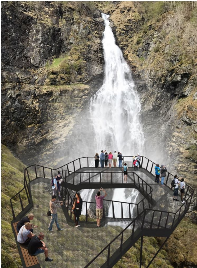
Figur 1: Teikning av det omsøkte utsiktspunktet.