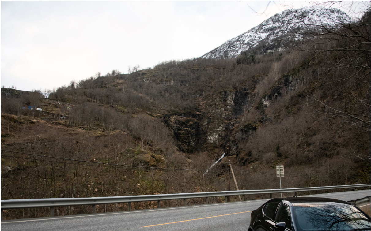
Figur 3: Utsiktspunktet vil vere lite synleg frå E16.