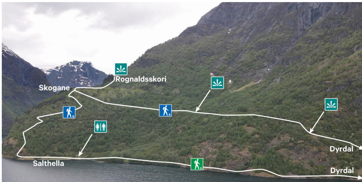
Figur 2. Flyfoto med stiar utvikla til skilt i Dyrdal.