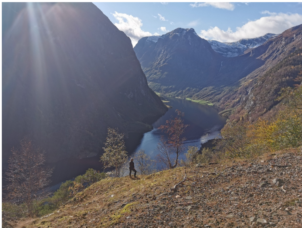
Figur 4. Det er skrått terreng ned mot fjorden frå Rognaldsskori. Dette kan vere skummelt dersom folk vil lengst mogleg ned på kanten for å ta bilde, men dette er ikkje vurdert å vere verre enn på andre turmål i området.

Fordelen med denne turen framfor andre turar i området, er at turmålet ligg godt nedanfor leveområdet til villreinen. Samtidig kjem du høgt nok opp til å få flott utsikt. Ein kan håpe at marknadsføring av denne turen til ein viss grad kan avlaste andre populære turområde i Dyrdal, som er meir sårbare for slitasje på sårbar vegetasjon og påverknad på villrein.