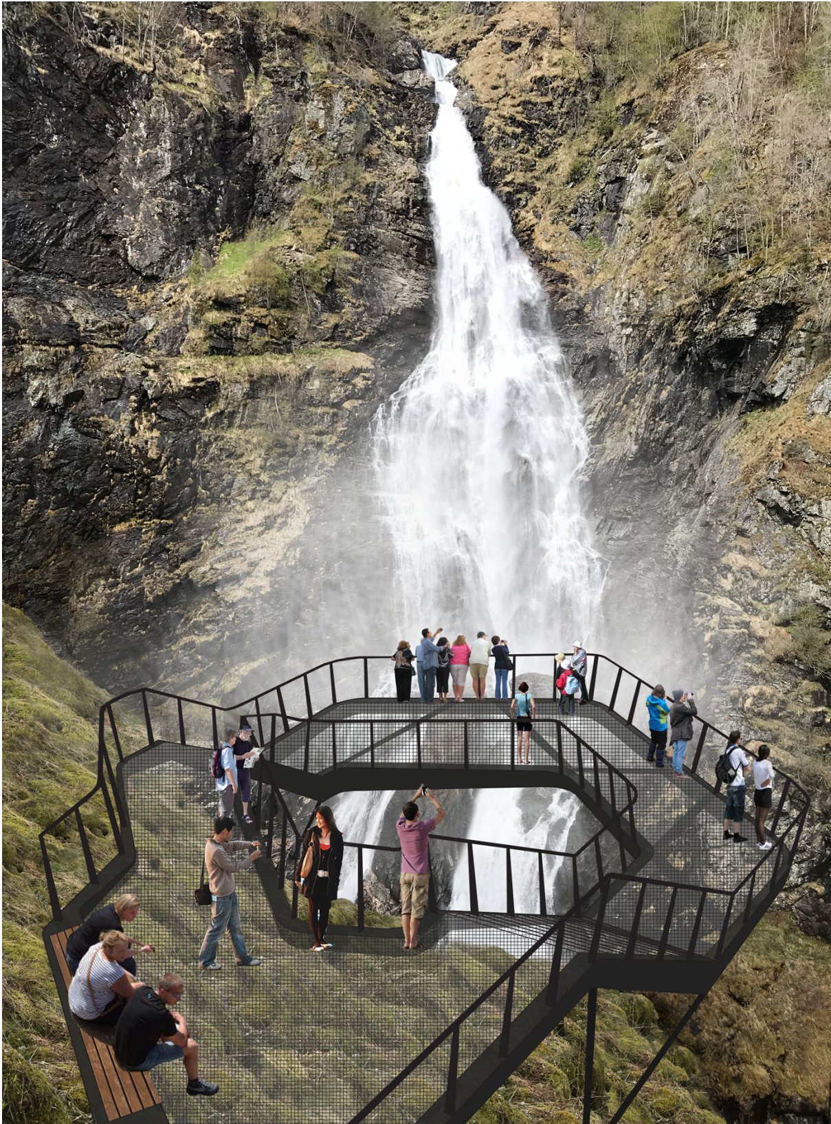
Figur 1: Teikning av det omsøkte utsiktspunktet.