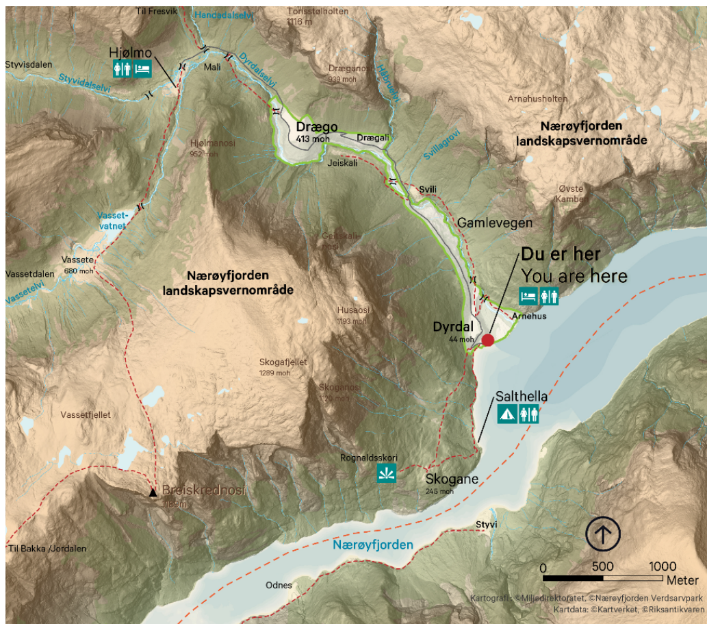
Figur 1. Kart utvikla til skilt i Dyrdal.