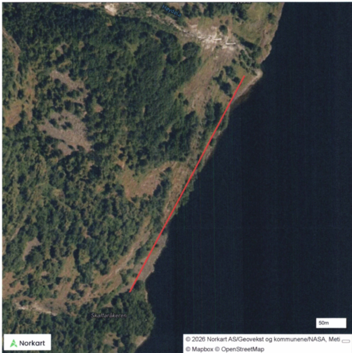
Figur 3. Flyfoto som viser området langs fjorden der søylene er tenkt satt opp.