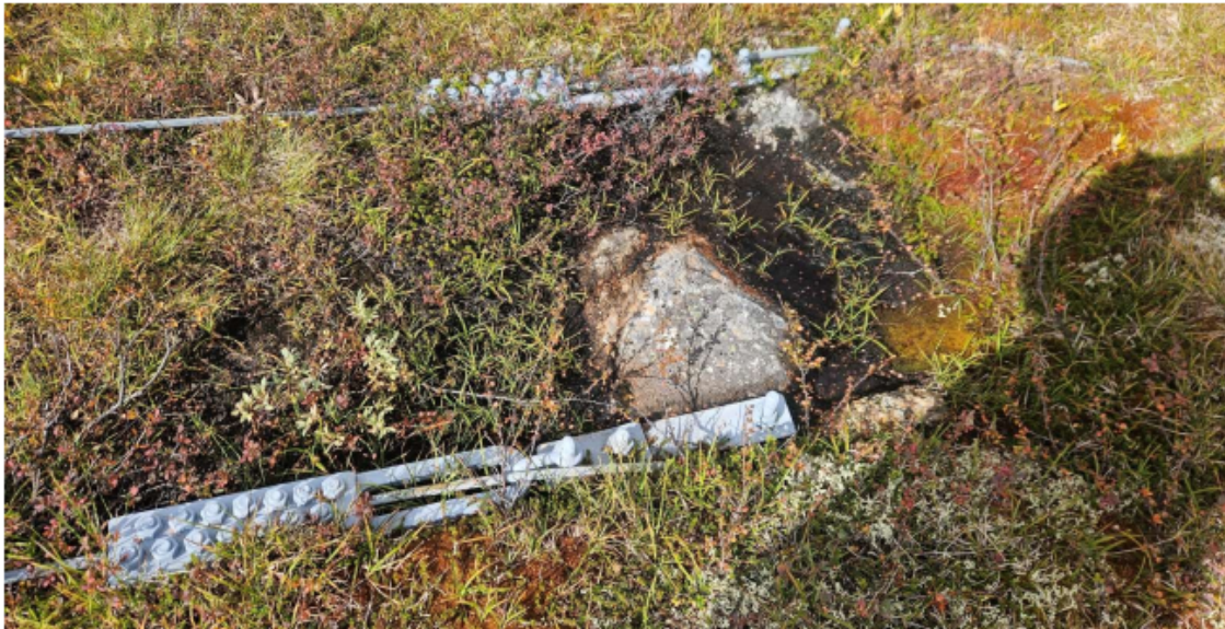
Feste ikkje synleg for kontroll og fare for korrosjon