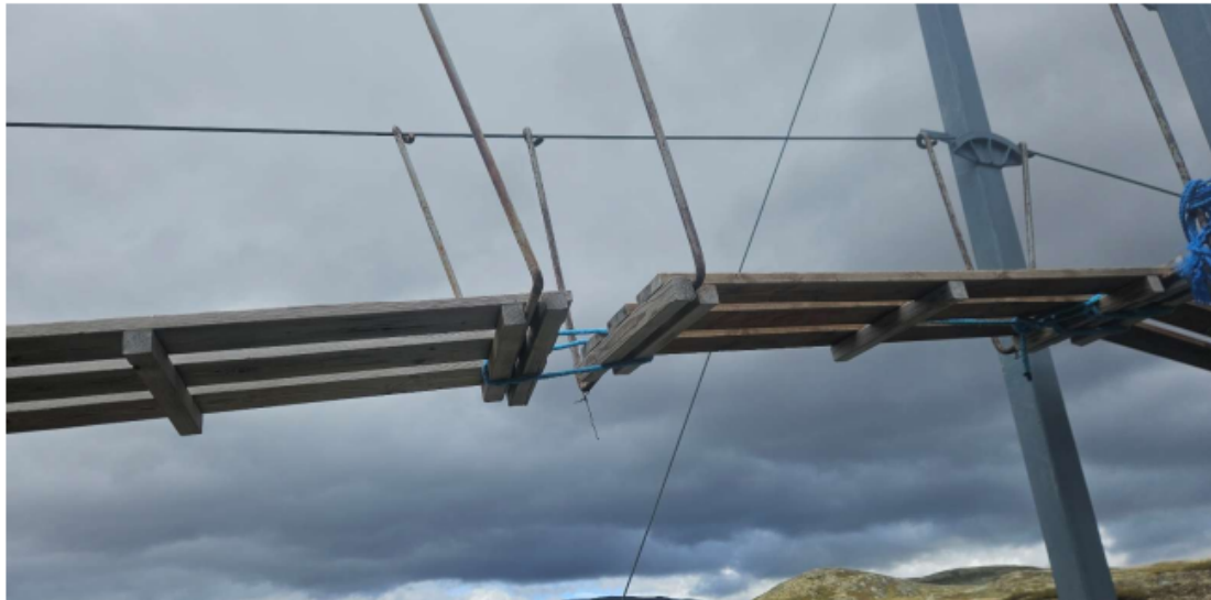
Flekane er smale og heng ikkje saman