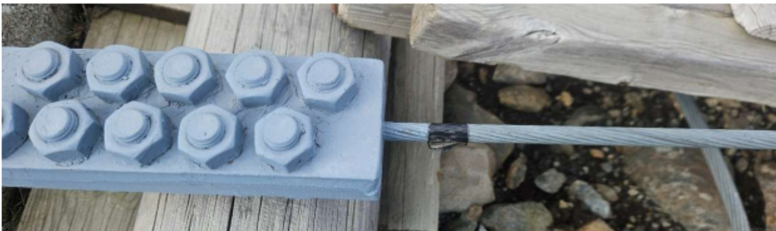
Har tauet sklidd i klemme?