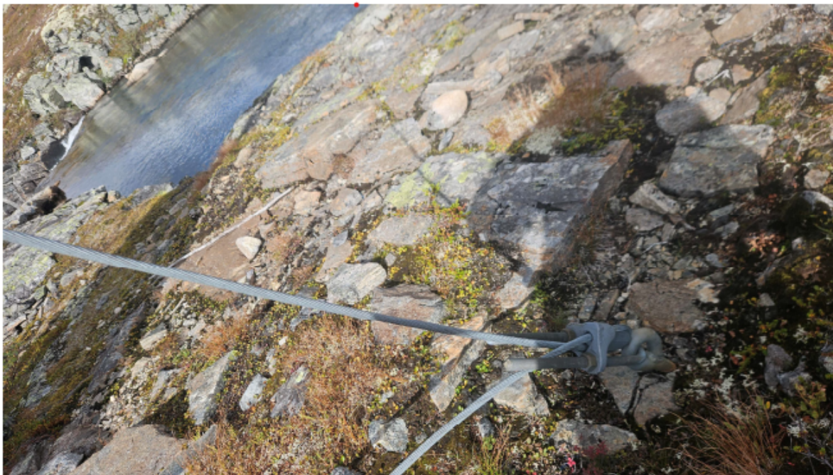
Slakke barduner i sør