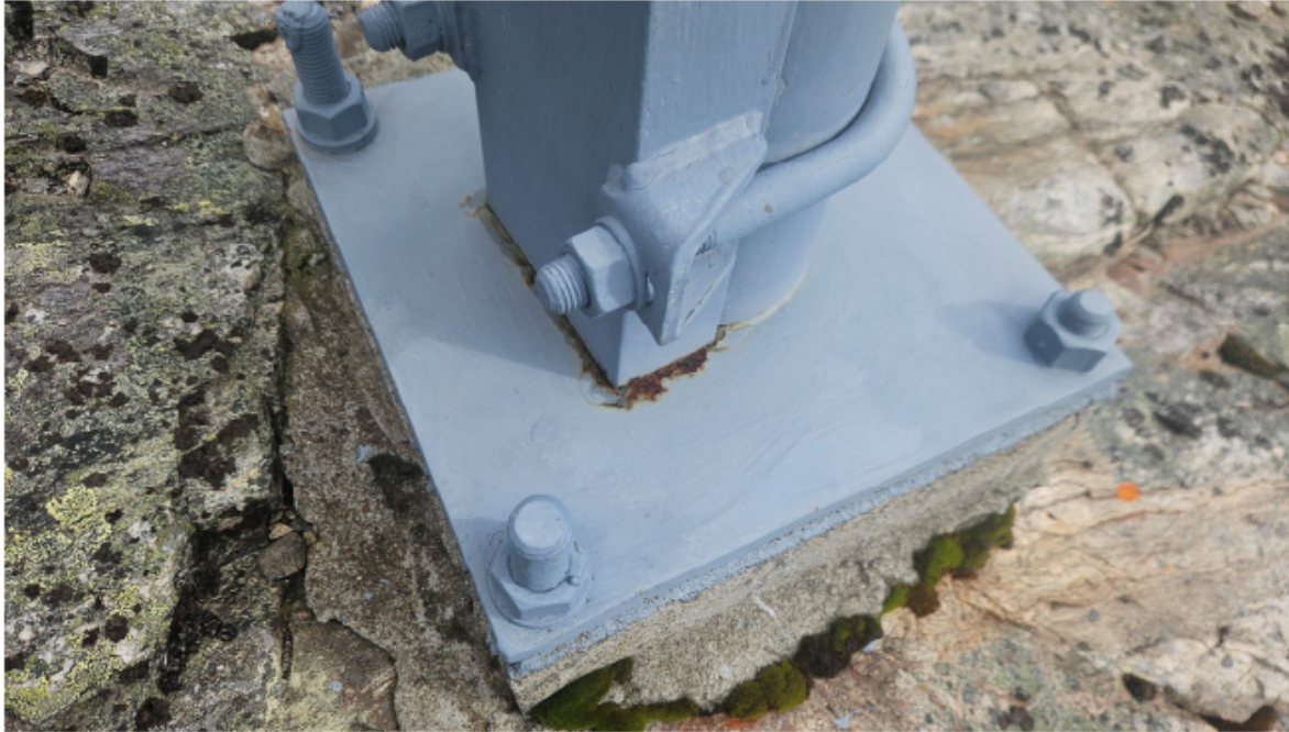
Korrosjon på mastefot i nord