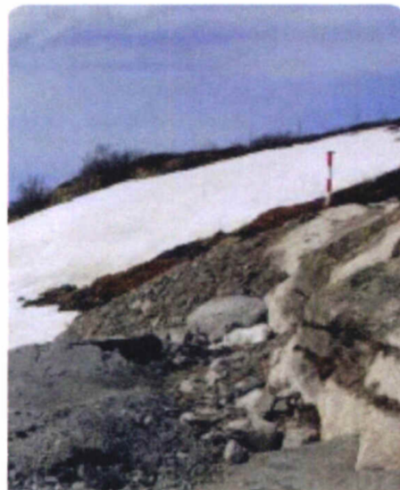
Fastmerkesøyle 1 meter