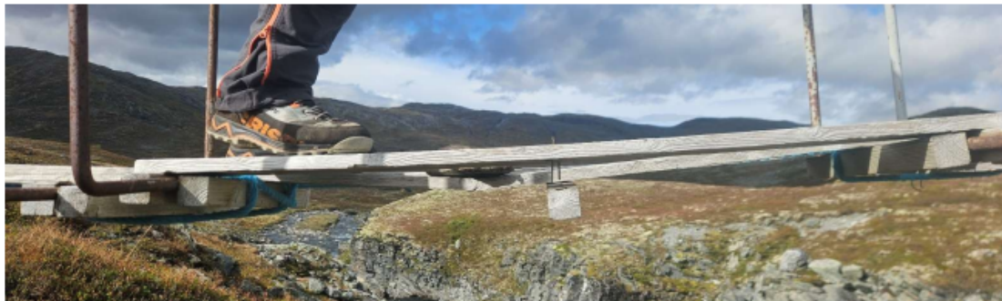
Ein fleke var knekt