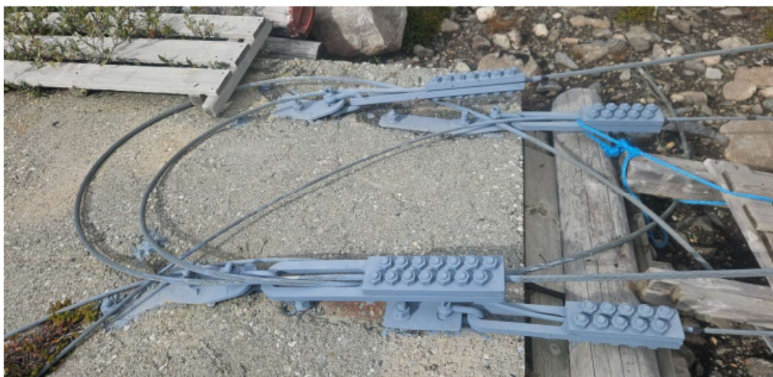
Godt feste i sør men eit rot av ståltau