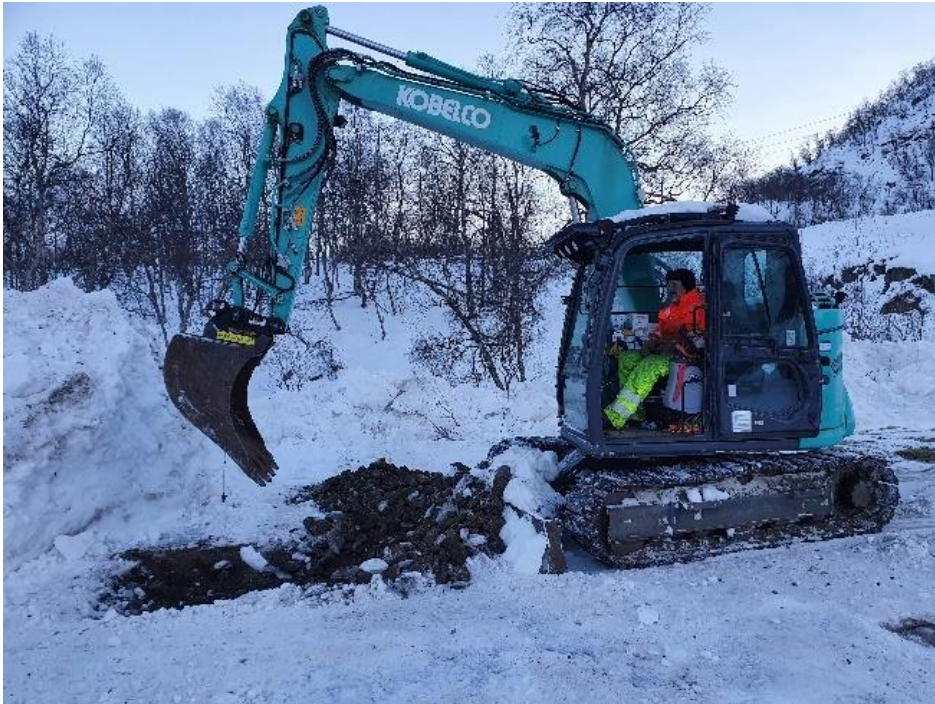
Foto øverst: Det graves fundament. Nederst: plassering av portalskilt på Skagen flyplass

Den gamle betalingsautomaten på Skagen flyplass skal erstattes av et portalskilt i cortenstål som man kan se Møysalen igjennom, og som forteller at det er en nasjonalpark rett over sundet fra flyplassen. Skiltet settes ut så snart tela går av grunnen.