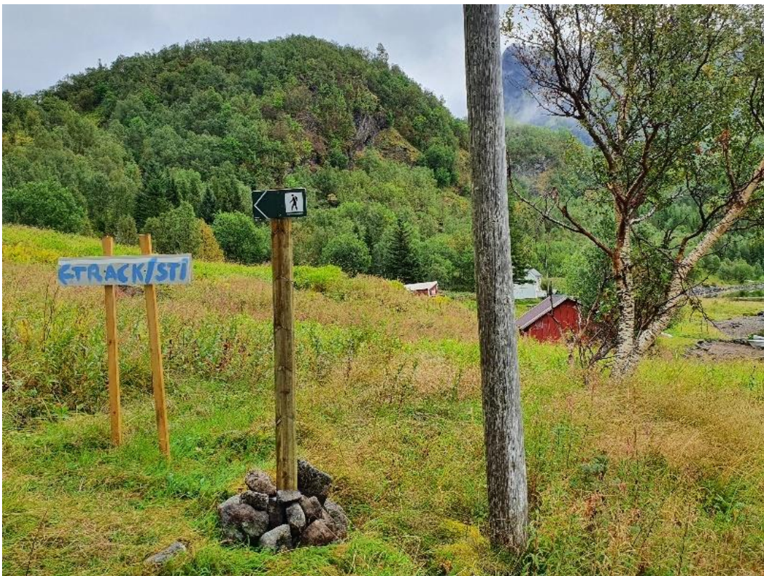
Pekeskilt ved Gammelgården. Gamhaugen i bakgrunnen.

Det er nylig satt opp pekeskilt som leder folk utenom innmark som her på Gammelgården (foto nederst). Deler av stien gikk gjennom såpass vått område at det kan være behov for klopper. Det er også 4 løpestrenger som krysser stien uten å være skikkelig merket. Det ble også registrert et rotvelta tre over stien som ble flyttet.