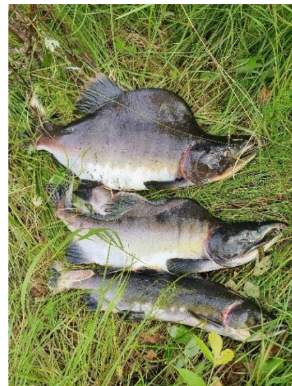
Foto: Oppgraving av parkslirekne (øverst) og fangst av pukkellaks i Vestpollelva (nederst)