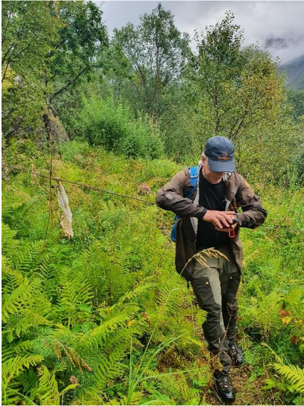
Løpestring over stien

Dersom du går fra Hennes eller Kaljord til nasjonalparken, følger du en sti langs Lonkanfjorden. Framkommeligheten på denne stien ble kontrollert fra Gamhaugen i Nordbotn og utover til Bjørnneset.