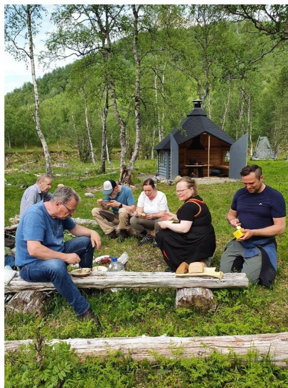
Styremøte ved gapahuken i Austpollen, juni 2023. Befaringer er viktige!