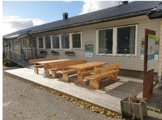
Hovedinnfallsport – Hennes (begge)