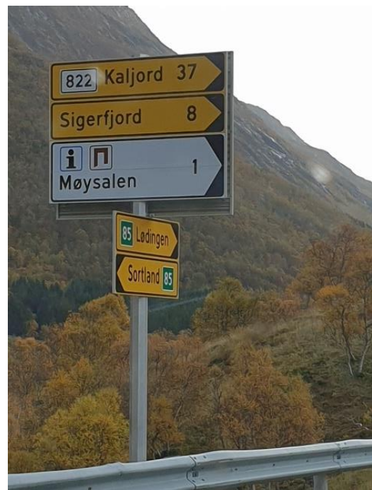
Venstre kolonne: Skilting på Lofast