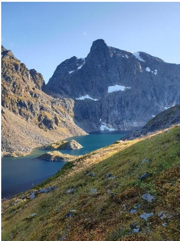
Fjerdevatn, Fiskfjorden, med Møysalen bak

SNO er selve feltapparatet i verneområdene, og utfører en rekke serviceoppgaver i tillegg til oppsyn.