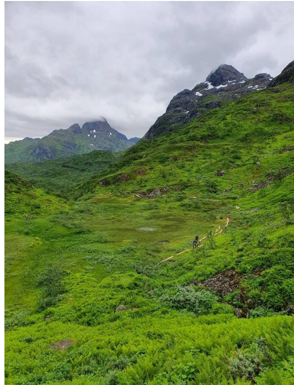
Klopping i Forkledalen

I likhet med tidligere år ble kulturlandskapsrydding gjennomført med elever og lærere fra Kleiva landbruksskole, 2. og 3. september.