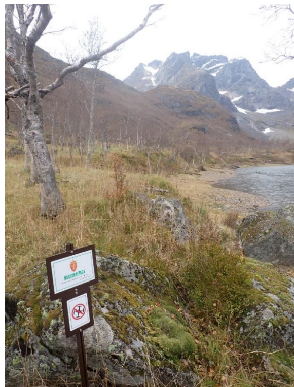
SNO har bl.a. montert drone-forbudsskilt i Vestpollen.

SNO er selve feltapparatet i verneområdene, og utfører en rekke oppgaver i tillegg til oppsyn. I 2020 har de blant annet satt opp og fornyet info-skilt rundt om i verneområdene.