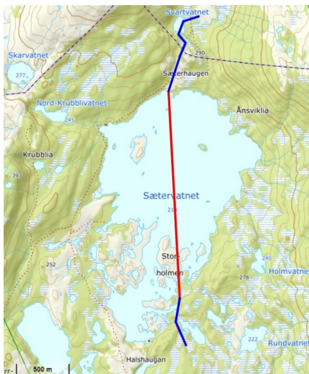
Bilde 2: Kartutsnittet viser Sætervatnet med inntegnet trasé som vil binde sammen løypene i Røsvik med løypenettet i Øvre Valnesfjord. Rød linje er omsøkt trasé, blå linjer er traseer som blir kjørt i dag.