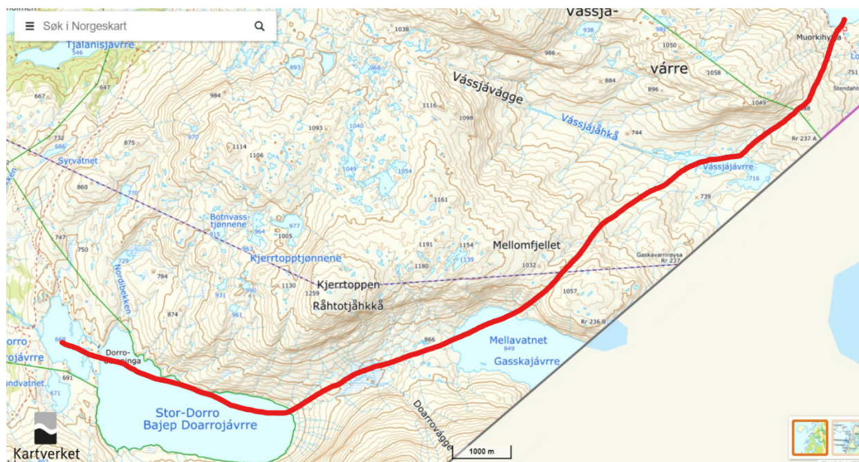
Figur 1: trasé for den omsøkte kjøringen

De søker om å få gjennomføre turen med 8 snøskutere i tidsrommet rundt den 2. mars