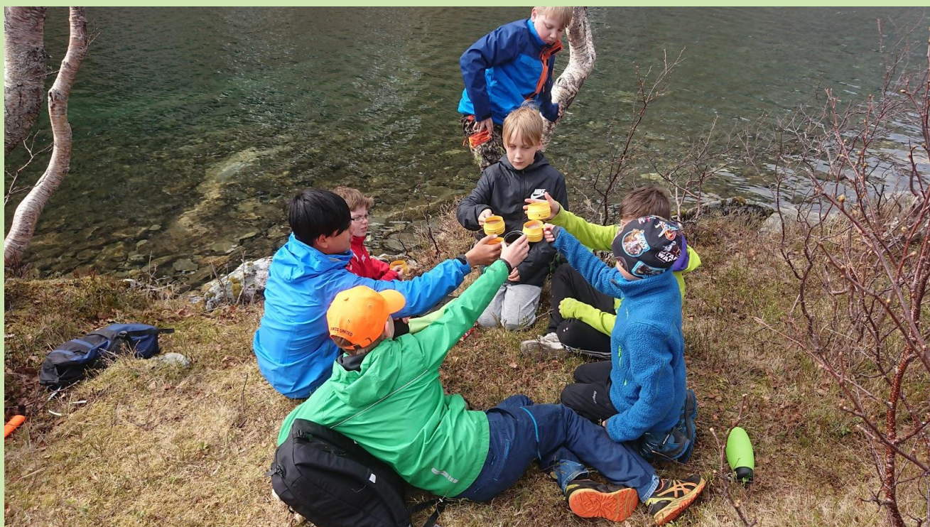
Bilde 9 Skål for «Barnas nasjonalpark»

Sjunkhatten nasjonalpark er et stort, sammenhengende og tilnærmet urørt fjellområde med omkransende fjordsystemer. Landskapet er preget av breerosjon med både spisse topper og avrundete fjell, bratte fjellsider, dalbotner og morener. Området er rikt på elver og vann, hvorav viltre fjellelver særpreger landskapet. Sjunkhatten er i dag et yndet område for den som liker ski under bena. Du kan stå på randone- og telemarkski, eller du kan laffe innover Bodømarka/Fridalen på fjellski. Til og med de som går på tynne løypeski vil finne preparerte løyper inn i nasjonalparken.