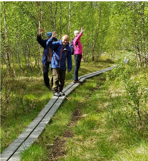
Bilde 4 Fornøyde brukere av kloppene til Finnkonakken la igjen hilsningen: "Kjære kloppleggere, sender takknemlighetsbilde fra gårsdagens tur til Finnkonakken. Fint å gå tørrskodd over våte partier"

En realisering av Sjunkhatten folkehøgskole vil også generere mer trafikk inn i området. Siden folkehøgskola skal rettes mot ungdom med funksjonsnedsettelse er det nærliggende å tro at de vil benytte seg av eksisterende tilrettelegging, og at denne kan utbedres slik at det er mulig å ta seg inn til Hømmervatn. Sjunkhatten blir da en av få nasjonalparker som kan besøkes av personer med funksjonsnedsettelser. Det er også viktig å presisere at denne typen tilrettelegging vil være tilgjengelig for alle, og barnefamilier vil også kunne nyte godt av en godt tilrettelagt ferdselsåre inn og ut av nasjonalparken.