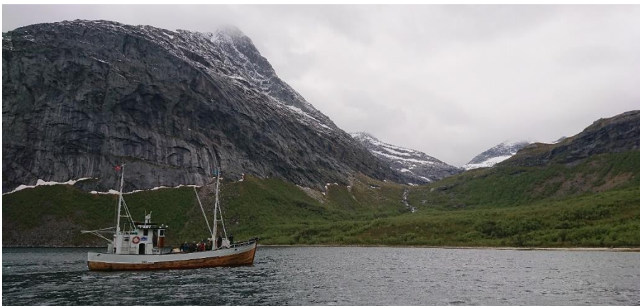
Bilde 7 Salten Veteranbåtlags «M/S Blomøy» inne i Sjunkfjorden

Leder i Sørfold fiskerlag tror ikke økt turisme i Sjunkfjorden vil bli noe problem for yrkesfiskerne.