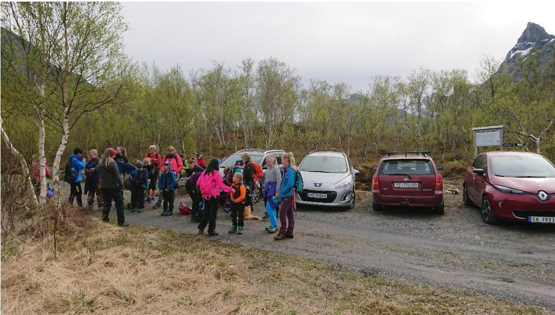
Bilde 8 Parkeringsplass ved Ryavatnet, på tur til Trolltindvatn på Kjerringøy.