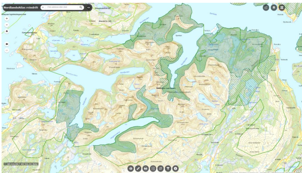
Bilde 6. Kart over Sjunkhatten nasjonalpark. Polygoner med tett grønn skravering er de viktigste kalvingslandene, mens de polygonene med mindre tett skravering er områder reinen trekker til etter kalving. Disse vurderes som mindre sårbare.

Duokta har få installasjoner inne i nasjonalparken. Ei reindriftshytte og gamle ved Heggmobotn, ei gjeterhytte og gamle ved Nord-Krubbvatnet og en gamle ved Skarvatnet. Ellers brukes det en del arbeidsgjerder, men disse settes opp ved behov og fjernes etter bruk.