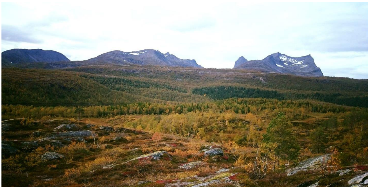
Bilde 5 Fridalen i Øvre Valnesfjord