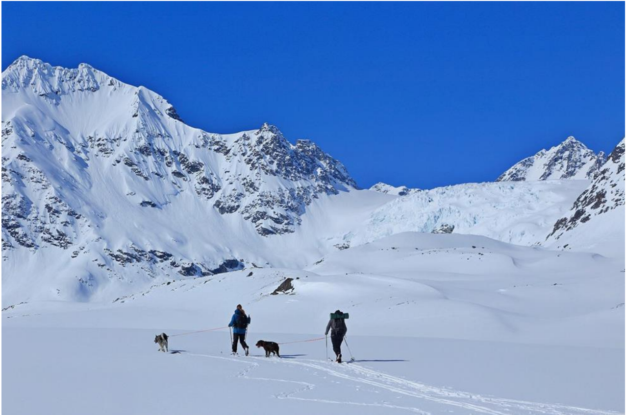
Ved vannskillet, Russedalen og Stortinddalen

Lyngsalpan verneområdestyre hadde i 2020 to tellere fra SNO i drift. Vi har i noen år hatt teller på stien til Steindalen. Denne har vist at besøket til dalen er stabilt med en liten økning. Denne telleren kan gå til andre dersom noen har behov for den. Den er fortsatt nedgravd og må i tilfelle graves opp til våren. I 2020 hadde vi også en teller på stien utover til Lyngstuva. Vi ønsker å kunne beholde denne telleren også i 2021 slik at vi har data for to år. Vi har egen teller (Ishavskysten friluftsråd) på stien til Blåisvatnet. Denne får fortsatt stå i dette området.