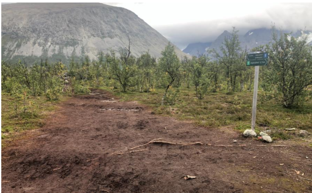
Bildet over viser stien ved krysset mellom stien til Aspevatnet og Blåisvatnet.

Stien er minst 4 meter bred og ganske så gjørmete på våte dager. Slik er det nesten hele veien opp til vernegrensen (5-600 meter), med unntak av stykket vi har lagt klopper. Her bør vi gjøre tiltak for å hindre at stien blir enda bredere, samt forsøke å få vegetasjonen til å komme tilbake på en del av stien. Verneområdeforvalterne ønsker å gjøre forsøk på å legge flis av furu på stien, og styre ferdsele opp på flisen. I tillegg må det bygges møteplasser på kloppen. Vi ser tendenser til at folk går på siden av kloppen når man møter andre underveis. Etter vernegrensen er det mer morene og ur slik at der vil det ikke være aktuelt å legge flis. Vi skal imidlertid merke enda tettere for å forsøke å styre ferdsele enda bedre.