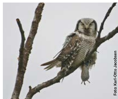
Haukugla er dagaktiv.