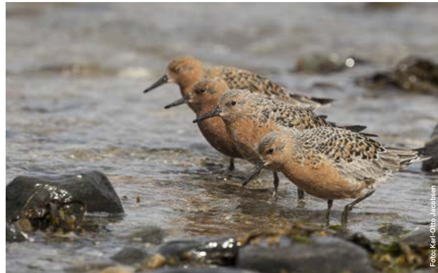
Polarsnipe er en av mange fuglearter som trives i området.

Har du fiskestanga med, kan du gjerne få røye på kroken i elver og vann, men også en og annen ørret.