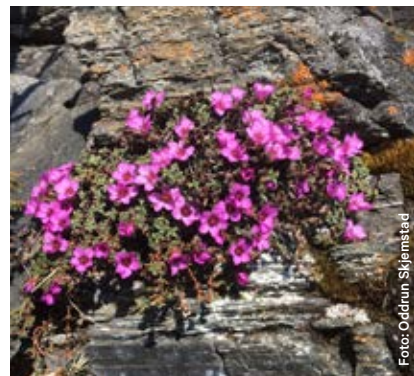
Rødsildre er den nordligst voksende planten i verden.