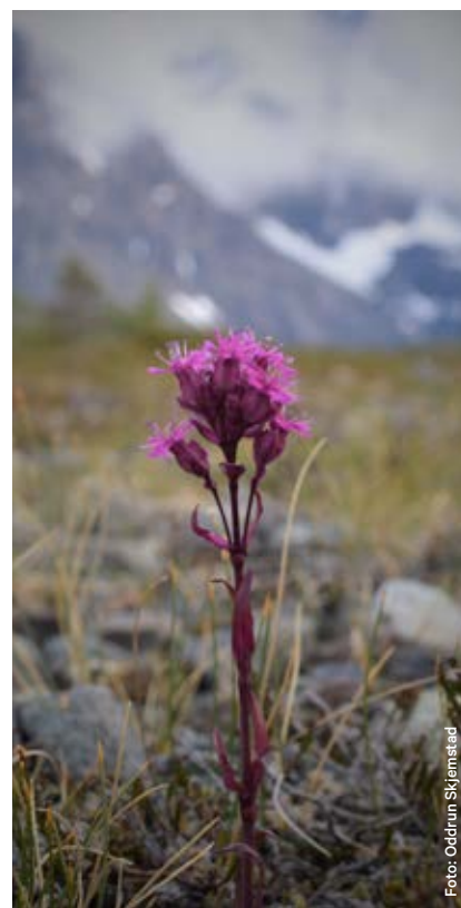
Fjellfloraen har ofte sterke farger. Her ser vi fjelltjæreblom.