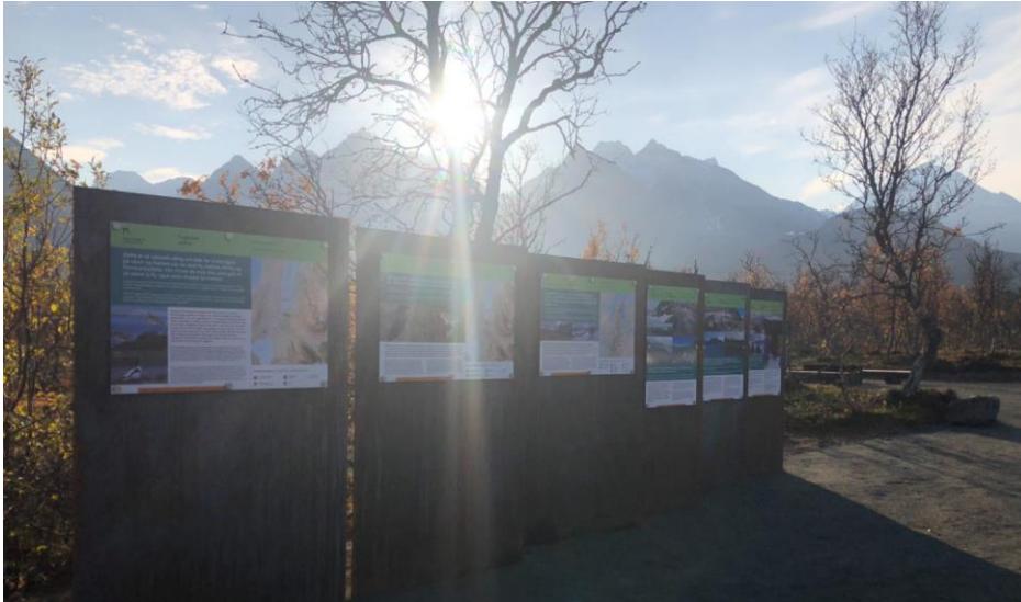
Cortenskiilt med plakater i Sørlenangsbotn