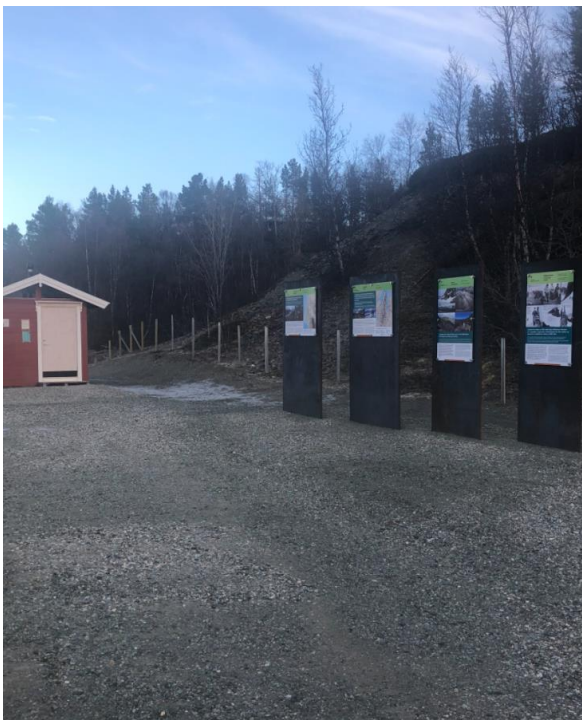
Cortenskiilt med plakater i Faueldalen

I tillegg har butikken i Lakselvbukt blitt et lite informasjonspunkt. De har fått en roll-up, brosjyrer og informasjonsplakater om Lyngsalpan og Faueldalen. Plakatene skal