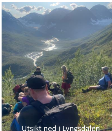
Utsikt ned i Lyngsdalen