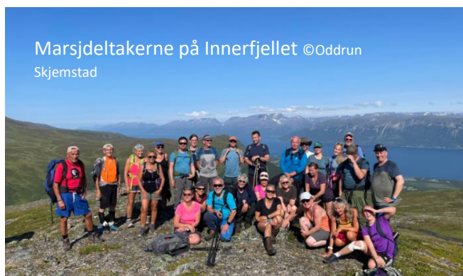
Marsjdeltakerne på Innerfjellet