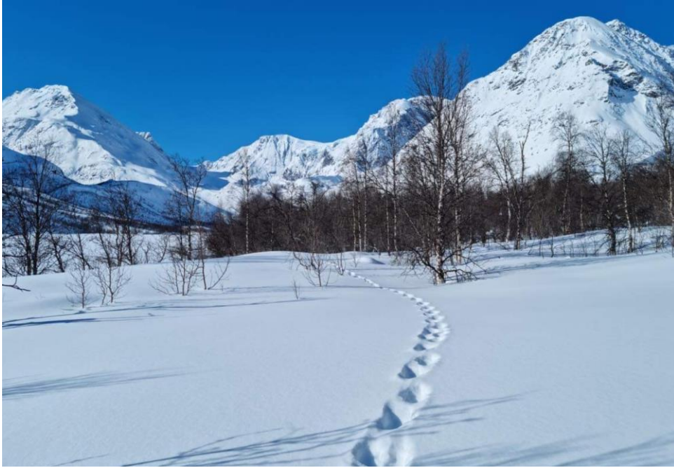
Bildet: Jervespor i Lyngsdalen, april 2023

Etter å ha plassert portalen der den skulle settes opp, gikk forvalterne på ski inn til minnetavla i Dalbotn.