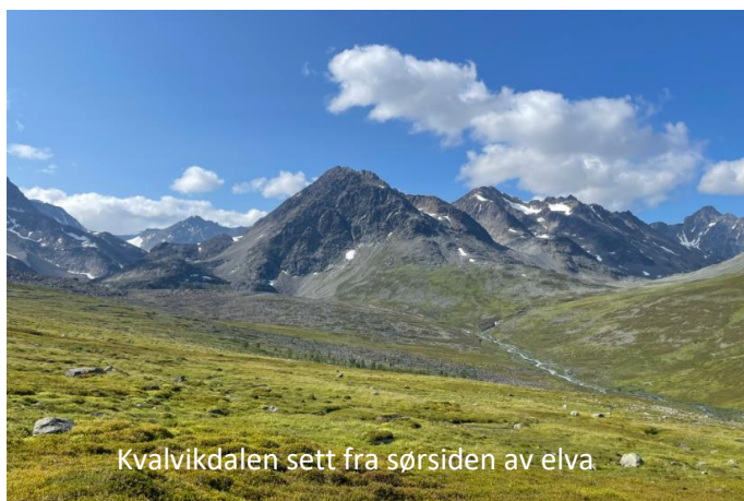
Kvalvikdalen sett fra sørsiden av elva