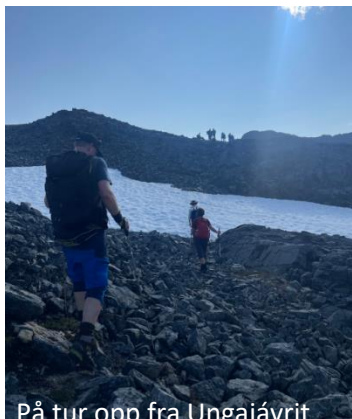
På tur opp fra Ungajávrít