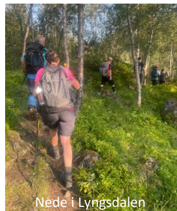
Nede i Lyngsdalen