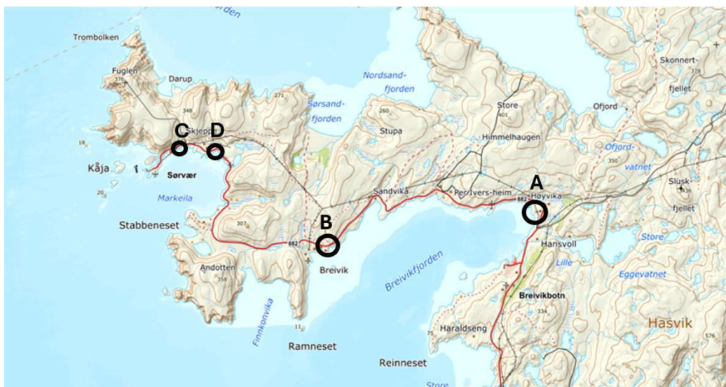
Figur 1: Fire lokaliteter ble undersøkt for døde fugler, Høyvika (A), Breivik (B), Sørvær 1 (C) og Sørvær 2 (D). Sirklene som markerer lokaliteten er omtrentlig

Forvalter dro ut til Sørøya 11.mars etter tips fra styreleder om døde lundefugler. Det ble funnet 22 døde sjøfugler ved fire lokaliteter mellom Breivikbotn og Sørvær (Figur 1).