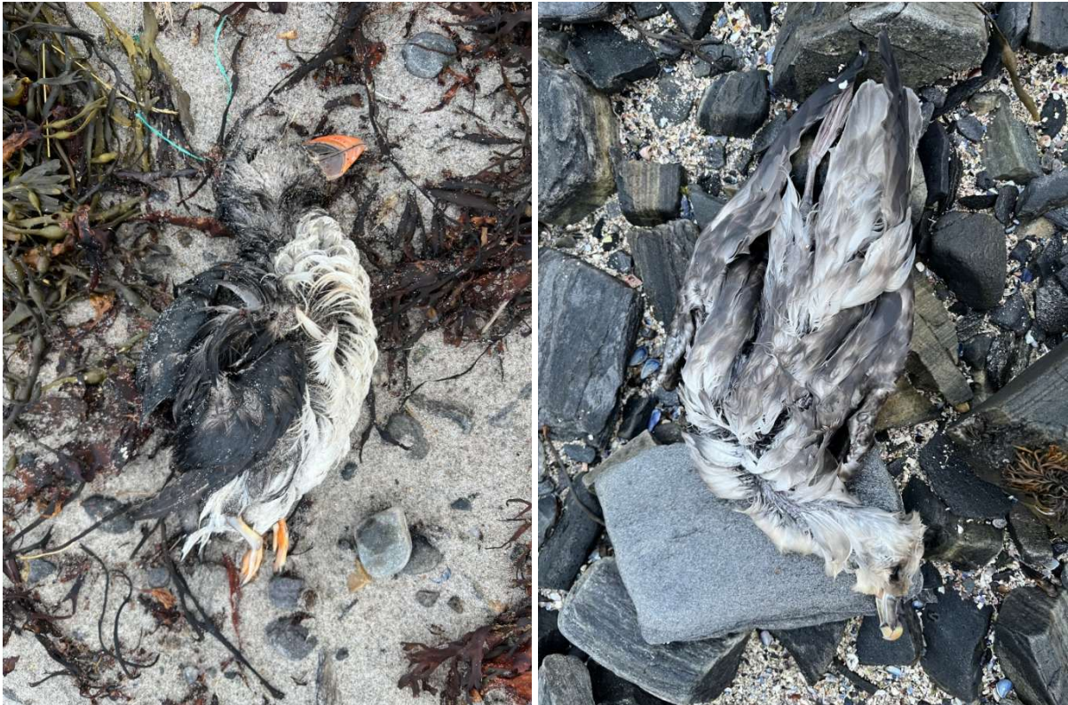
Figur 2: Et kadaver av en lundefugl funnet ved lokalitet A (venstre) og en død havhest funnet ved lokalitet C (høyre).

Kadavrene ble samlet inn i dialog med mattilsynet og sendt inn til undersøkelse for dødsårsak. Fuglene fikk ikke påvist fugleinfluensa og obduksjonsrapporten viser at fuglene var avmagret da de døde (vedlegg 1 og 2).