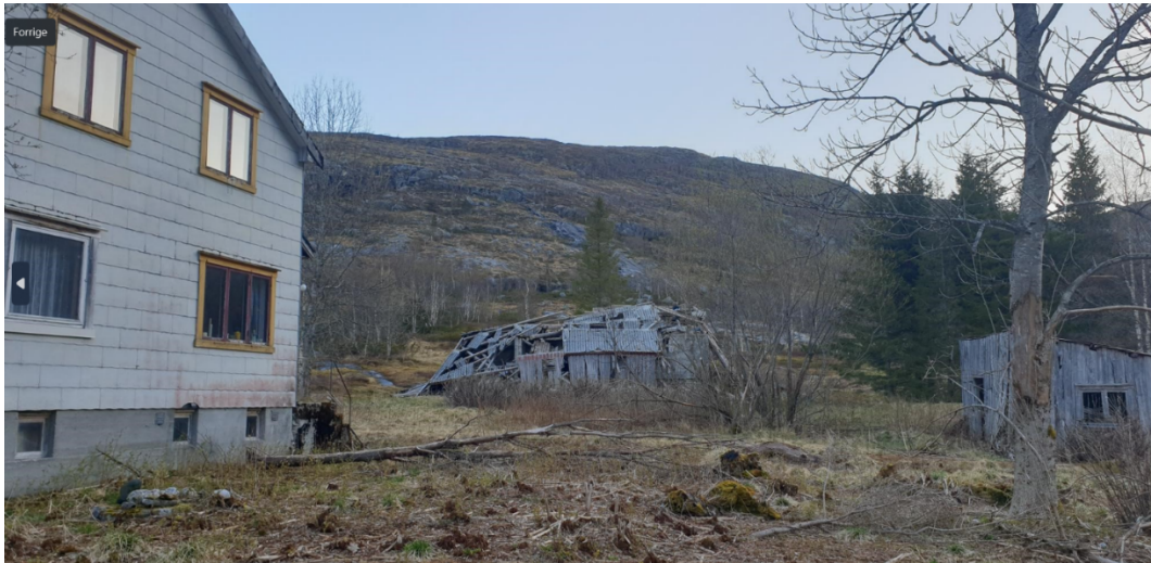
Tunet i Storfjorden: bildet er tatt i forbindelse med befaring i mai 2021.

Fjordarmene i Velfjord er sterkt påvirket av menneskelige aktiviteter langt tilbake i tid. Helt tilbake til 1600- tallet har disse områdene hatt tett bosetting. Bosettingen avtok kraftig og opphørte helt i store delområder for 50-60 år siden. Bruken av naturressursene var intens med omfattende hogst, beite og slått. Den "urørte naturtilstanden" som observeres i dag er m.a.o. et suksesjonsstadium fra et landskap som har vært intensivt utnyttet og opplagt har vært langt åpnere