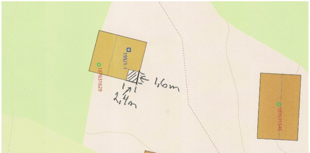
Målsatt tegning – inngangsparti Storfjorden i søknad 4. mai 2023