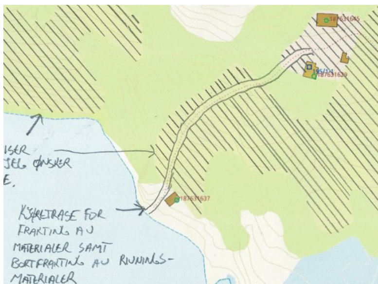
Inntegnet kjøretrase fra naust til tunet.

Søker har definert en trase hvor kjøringen er tenkt utført. Dette området strekker seg fra nauset og opp til gårdstunet, det er sannsynlig at dette området har blitt benyttet til transport tidligere. Ut fra ortofoto og markslagskart er området markert som innmarksbeite og tun. Deler av området har også vært behandlet med sprøytemidler for å ta vekk et område med parkslirekne (art som er svartelistet). Området fremstår som tørt uten spesielt våte partier.