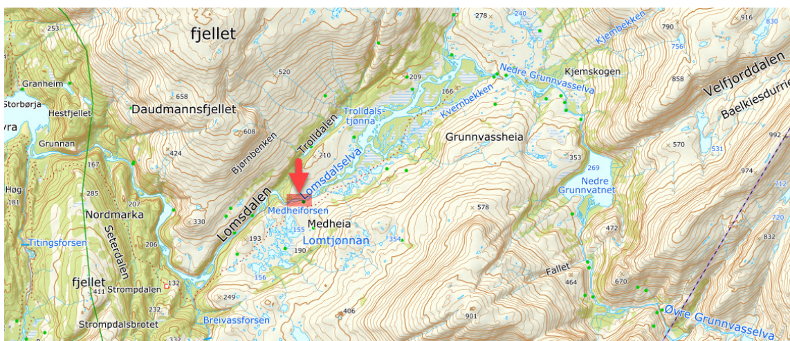
Kart: Søker har markert hvor dronebruk er tenkt – Lomsdalen, Medheia