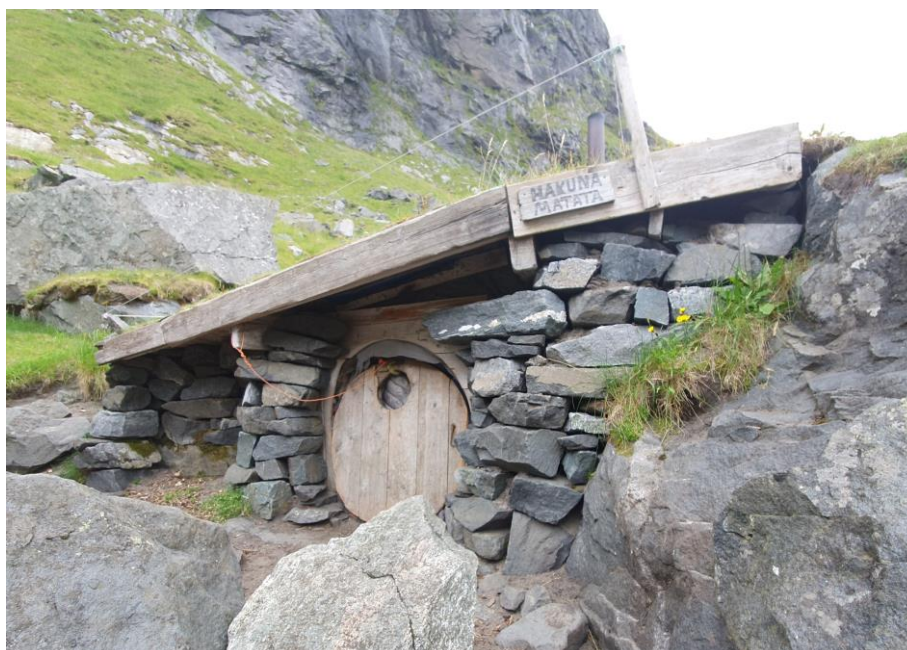
2 Hobbithula i Kvalvika er nå registrert i verneområdeloggen