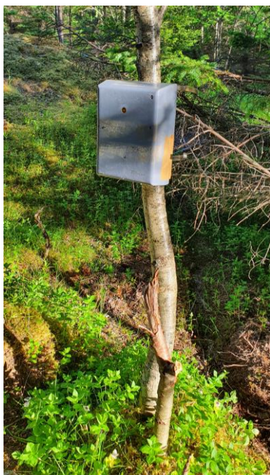
5 Telleren i Selfjorden

Ferdselstelloene som SNO bruker har pyro-sensorer. Det vil si at de registrerer varmen på personen eller dyret som passerer ved sensoren. Sensoren blir montert så høyt oppe at den ikke skal telle sauer eller hudner. Teknologoen gjør det mulig å logge bevegelse i begge retninger med en nøyaktighet ned på timesnivå. Som i lignende teknologi vil det forekomme feilregistreringer. For eksempel hvis to personer går rett ved siden av hverandre kan de telles som en person. Man forsøker derfor å sette sensorene på et smalt parti av stien. I 2020 var det satt opp to ferdselstellere i parken, en på vestsida av Ågvatnet og en på stien innafor Selfjordhytta.