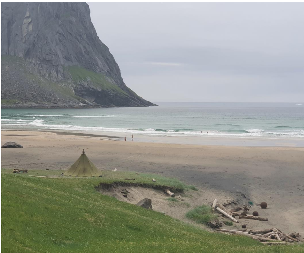
3 Nederlandske badeturister i Kvalvika

SNO lokalt er blitt spurt om å delta på grensemerking av nasjonalparken, og vil i forbindelse med dette ha mulighet til å sette opp løveskilt på sentrale men lite tilgjengelige steder. Øvrige verneskilt må settes opp på eget oppdrag.