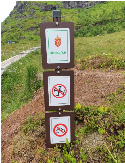
1 Verneskilt med underskilt i Torsfjorden

En av bestillingene fra nasjonalparkstyret er at det skal holdes et ekstra oppsyn med droneaktivitet i nasjonalparken. Dette er ifølge verneforskriften forbudt. Dette har vært gjennomført både ved egne oppsynsturer til Kvalvika/Ryten og Bunessanden, og oppmerksomhet rundt det på oppsynsturer med andre formål. Det er ikke observert bruk av droner av oppsynet under feltaktivitet i nasjonalparken i 2020.