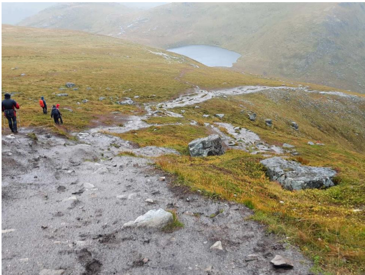
Figur 3. Befaring på Ryten, Foto: Ole Runar Aabrekk, Utmarksressurser AS

på restaurering av stien fra Bunesfjorden til Buessanden, og på Stien fra Forsvatnet (ved vernegrensa) og til Ryten og Kvalvika. Med oss hadde vi også lokal SNO og Anne Rudsengen fra SNO Jostedalsbreen, for å vurdere ulike tilretteleggingstiltak. Dette er bare en liten del av et større arbeid med stirestaurering nasjonalparkstyret kommer til å jobbe med framover. Det ble utarbeidet en rapport med fullstendig tilråding på tiltak på de to stiene.