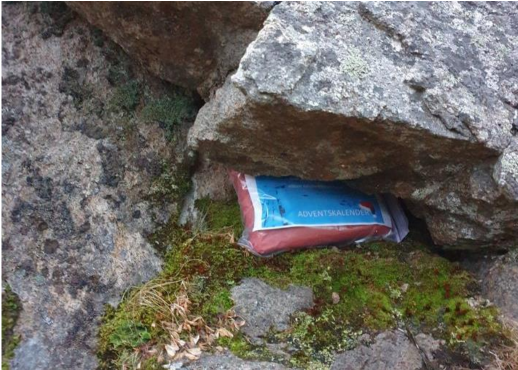
Figur 7. En av julenissens gjemmelasser.