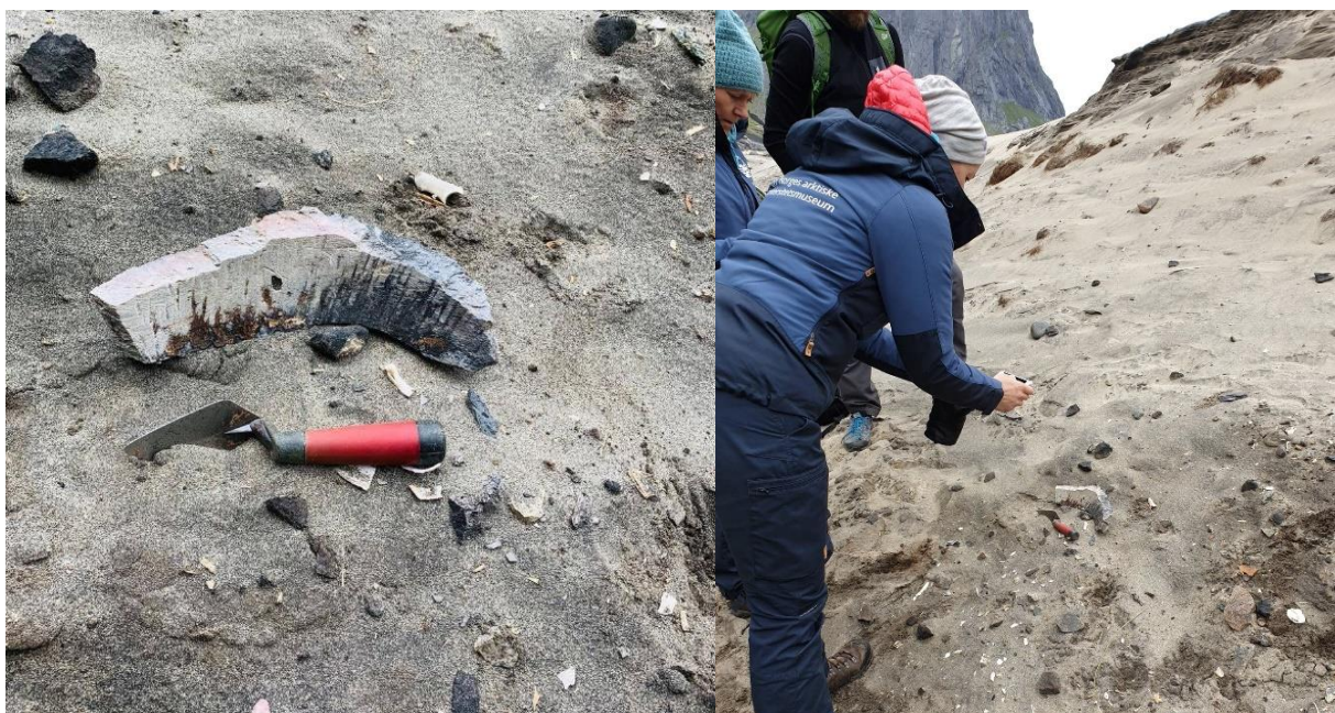
Figur 6. Funn av fragment fra en klebersteingryte, foto: (til venstre) Fylkeskommunen, (til høyre) Ole-Jakob Kvalshaug.