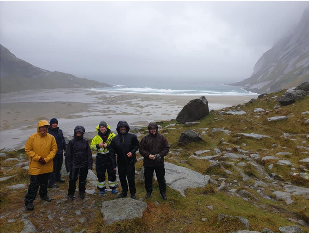
Figur 5. En meget våt tur til Buessanden

Nasjonalparkforvalter brukte mye tid i felt i sommer i forbindelse med sårbarhetsvurderingen. Det ble også befaring med SNO og styringsgruppe for nasjonale turiststier i forbindelse med restaurering av stier. Fra SNO fikk vi besøk av Anne Rudsengen fra Jostedalsbreen og Liv Byrkjeland fra Luster, for erfaringsutveksling på naturovervåking, skjøtsel og tilretteleggingstiltak.