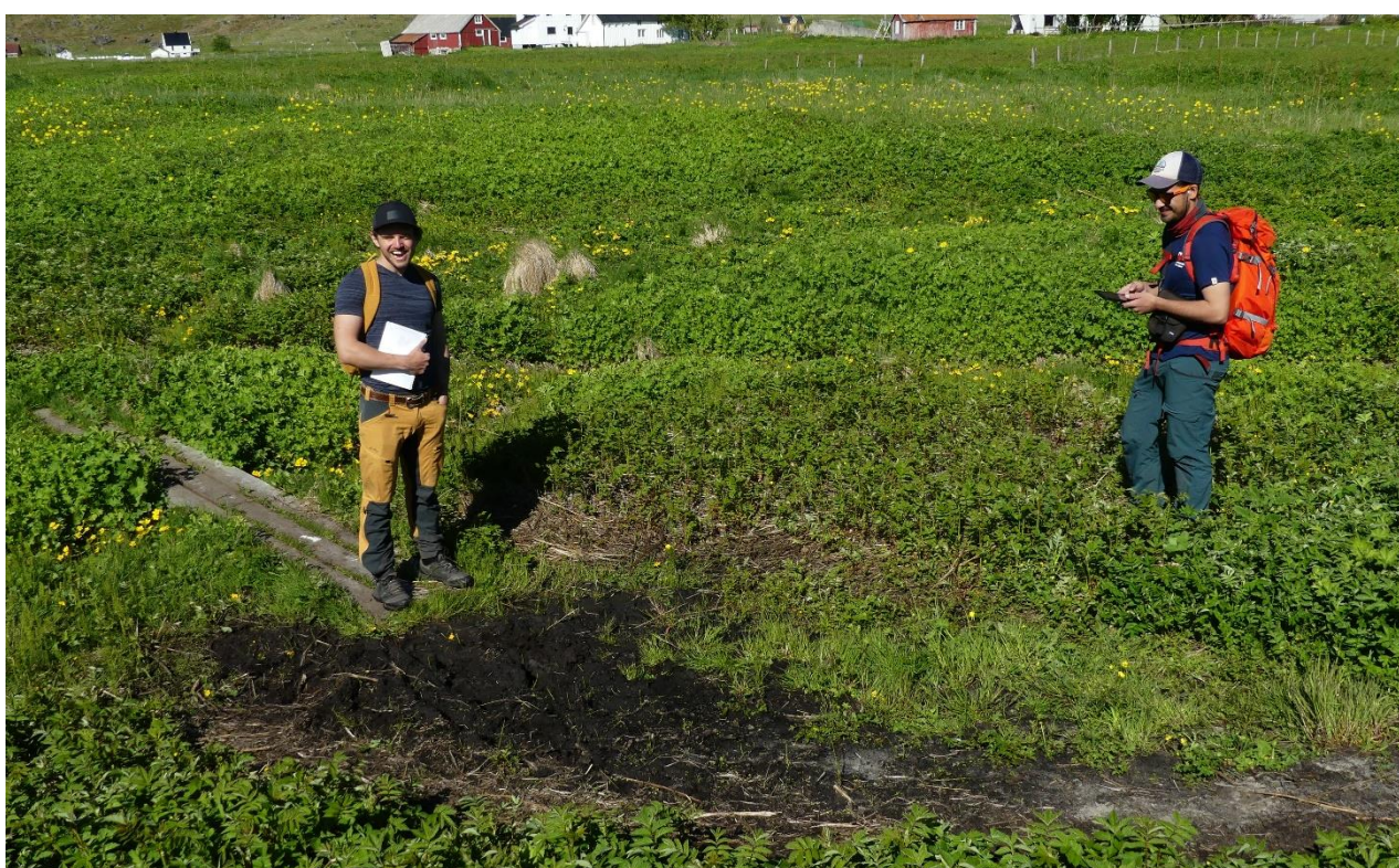
Figur 2. Foto: Sårbarhetsvurdering sammen med kollegaer fra Midtre Nordland nasjonalparkstyre