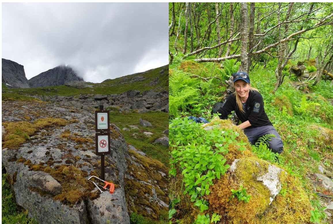
Figur 4. Til venstre: på stier som går inn i nasjonalparken er det satt opp verneskilt/ løveskilt. I vår ble det også montert opp informasjonsskilt om droneforbud på enkelte plasser. Til høyre: Lokalt SNO setter opp en ferdselstiller i Ågdalen.

Ut over midler tildelt over statsbudsjettet brukes også personressurser i form av arbeidstid fra lokalt SNO og nasjonalparkforvalter. Bestillingen ble vedtatt på styret møte i desember 2019, og revidert på styremøtet i mai 2020 etter tildeling av midler. Det ble i styremøtet i november vedtatt å omdisponere midler pga. endret behov som følge av pandemien.