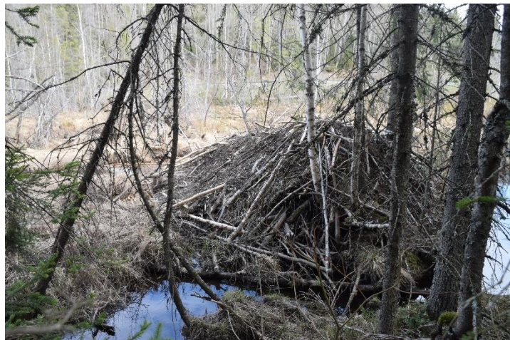
Hytta på Vollen i Saksumdalen