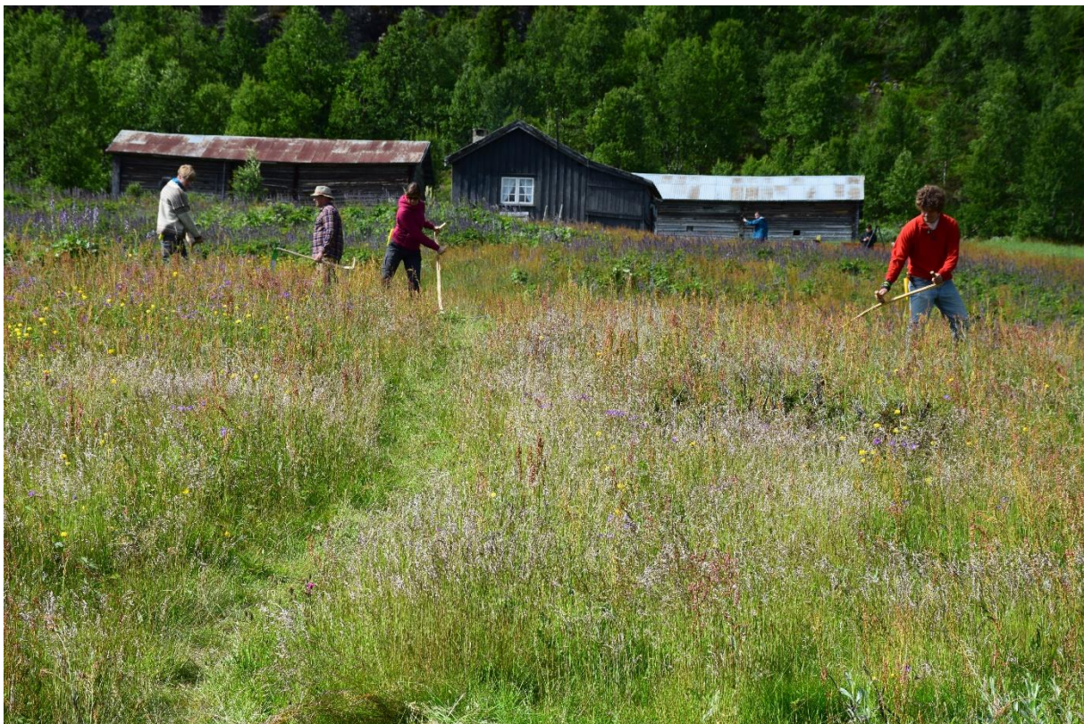
Ånstadsetra i Dokkfaret landskapsvernområde.