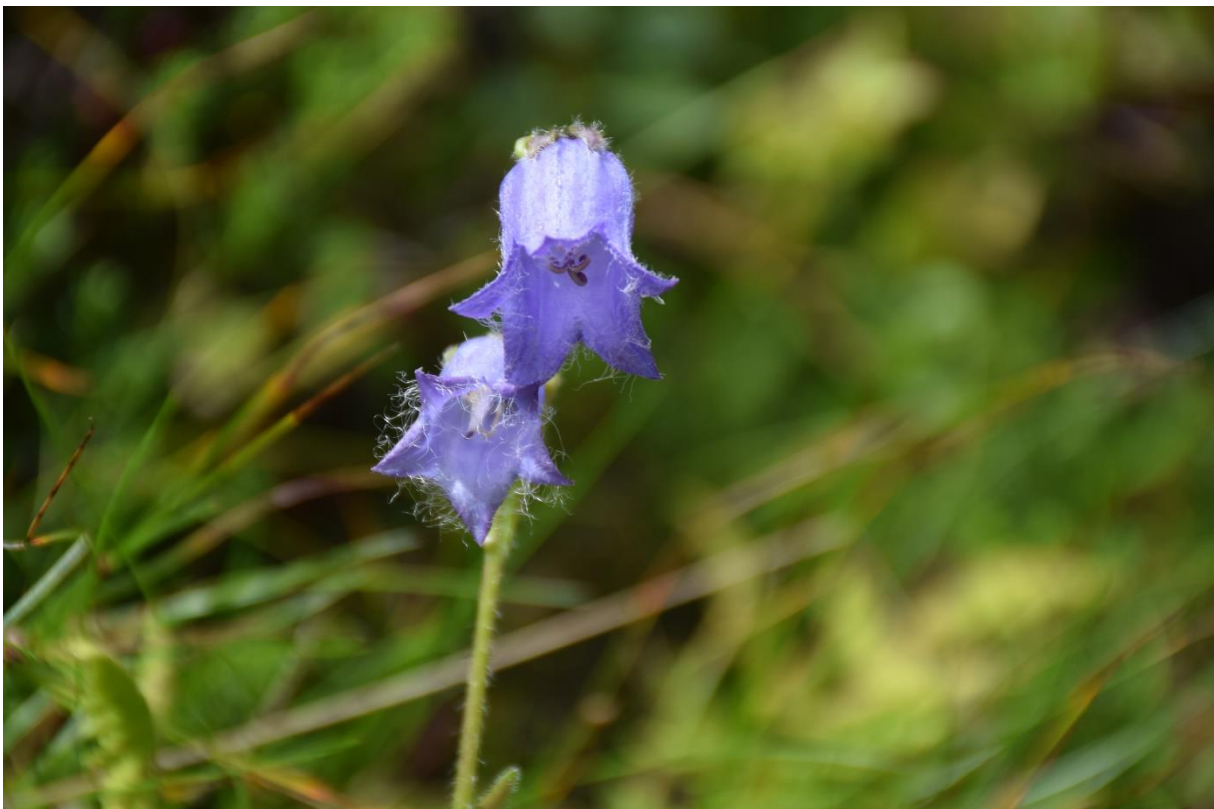
Skjeggklokke - Langsuaområdet er ett av de få voksestedene i verden i tillegg til fjellområdene i Alpene, Karpatene og Sudetene.

Etter opprettingen av Langsua nasjonalpark ble det utarbeidet skjøtselsnotater for et tjuetalls steder med skjøtselsavhengig kulturmark i verneområdene, med beskrivelse av verneverdier og aktuelle skjøtselstiltak. Skjøtselsnotatene danner først og fremst grunnlaget for å utarbeide bevaringsmål for arter og naturtyper, og skjøtselsplaner for prioriterte lokaliteter. Bevaringsmålene framgår av vedtatt forvaltningsplan.