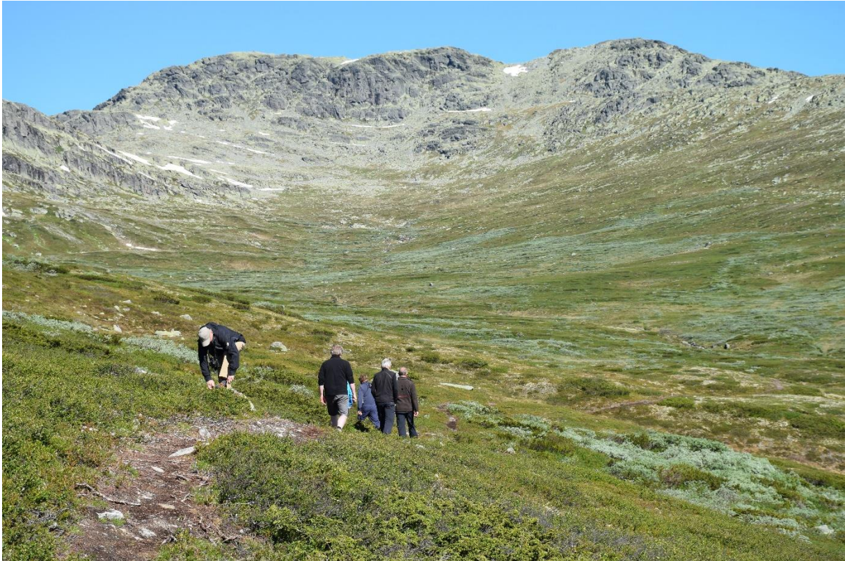
På vei fra innfallsporten Storeskag mot Langsuas høyeste topp, Skaget 1685 moh.