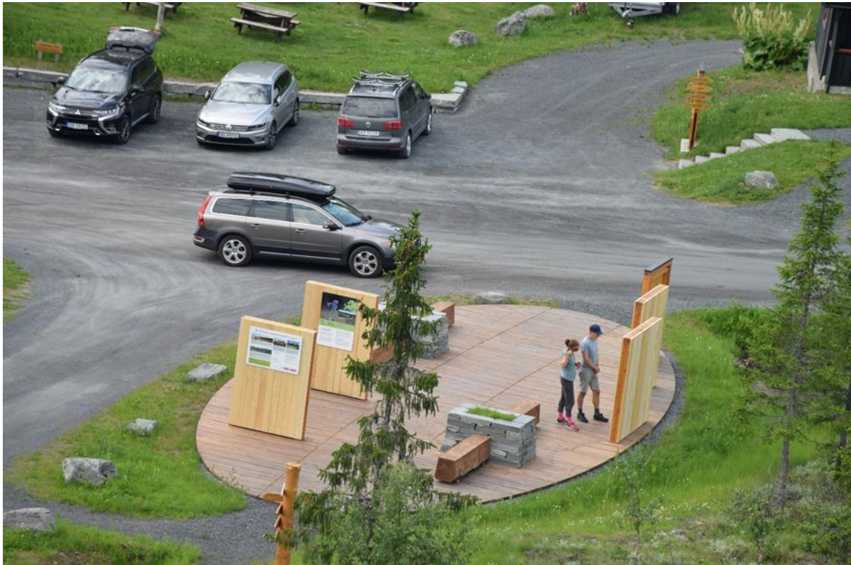
Nytt start- og informasjonspunkt på Holsbru i Gausdal – på vei inn i Dokkfaret.