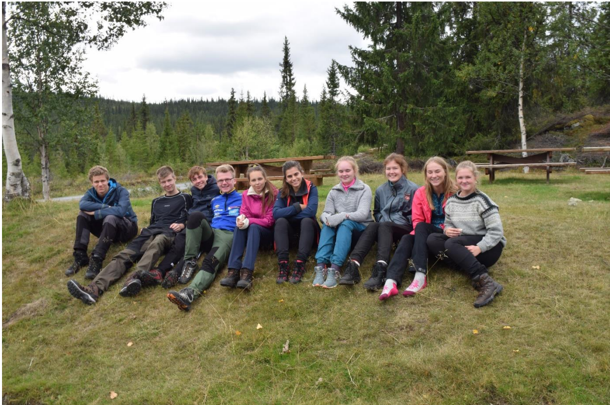
Dokka videregående skole på flerdagers feltarbeid og studietur i 2018.