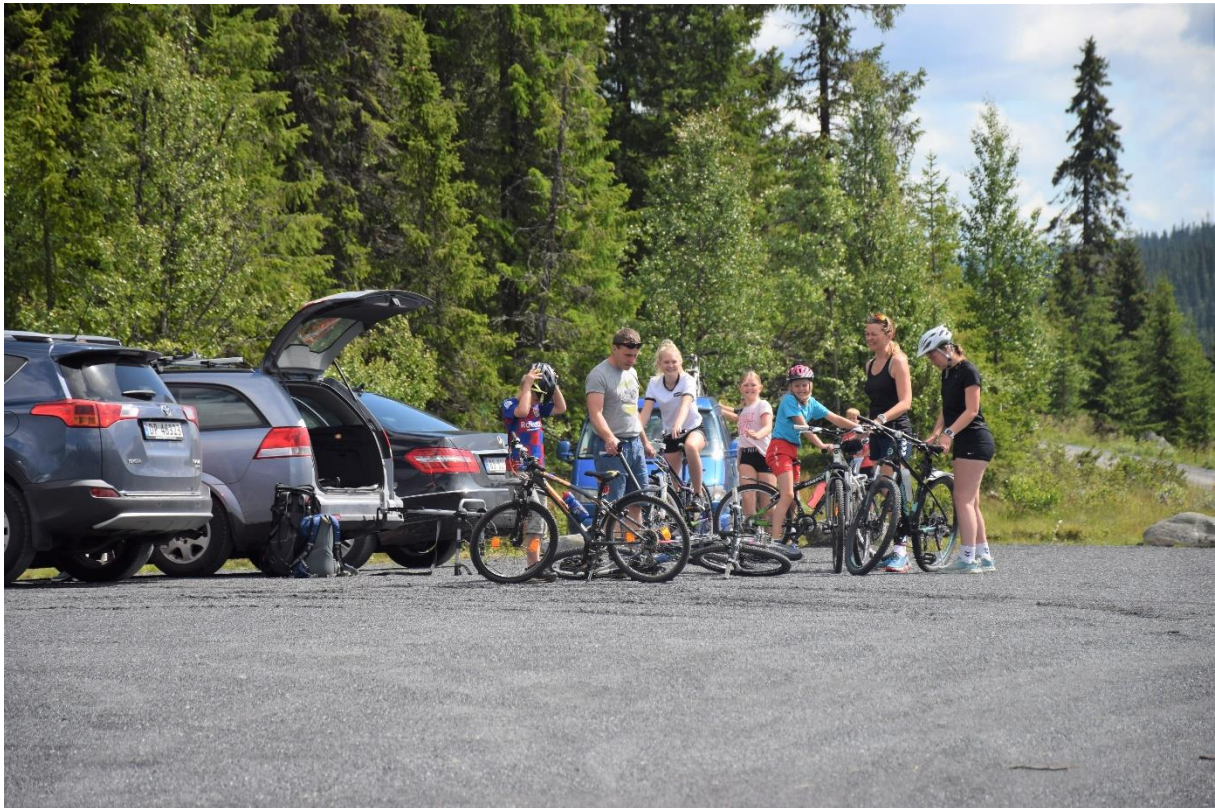
Ut på sykkeltur – mange muligheter.