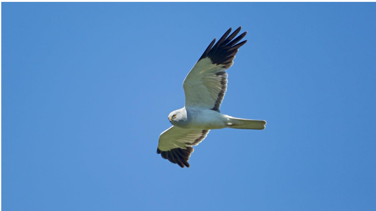
Myrhawkhann på farten – Langsua er et viktig leveområde.

Området inneholder også kulturmiljø- og kulturminneverdier knytt til jakt og fangst av rein og elg, til jernframstilling, fiske, ferdsel, støls-/seterdrift, feplassar og annen beitebruk, mm.