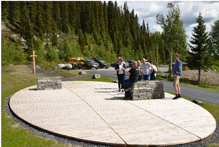
Nasjonalparkstyret befarer første byggetrinn på Holsbru i 2019.