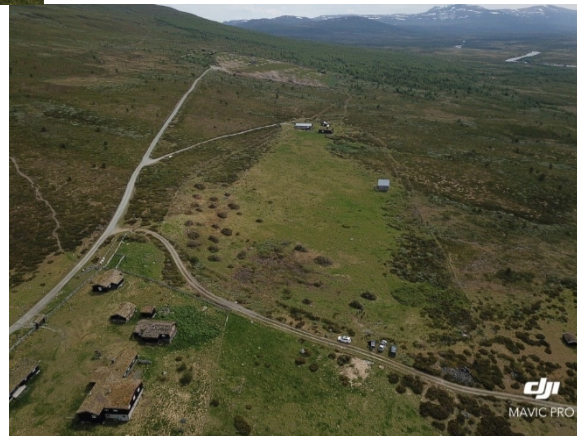
Skjøtselsområde Storhøliseter, etter.