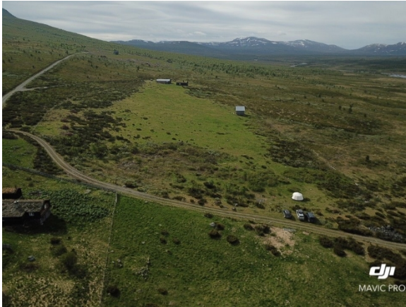
Skjøtselsområde Storhøliseter, før.