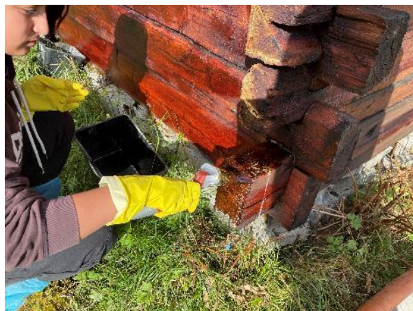
Over: bruk av tjære. Smøring av vegg.