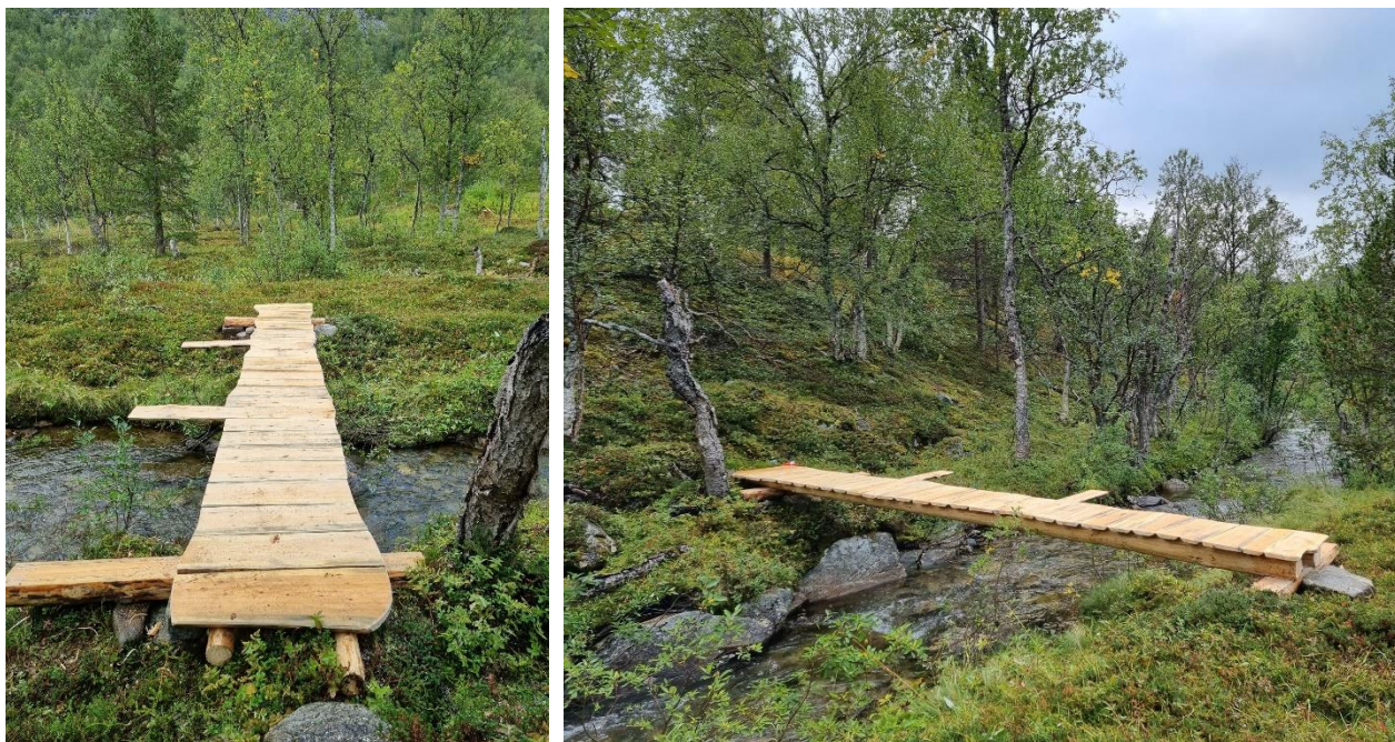
Nye flombruere over Ruoassabekken på veien mot Gearbbet. Bruene er senere malt og det er laget rekkverk.