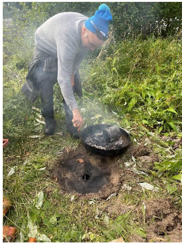
Over: Framtilling av tjære i minile Under: barking av torvhaldsstoker