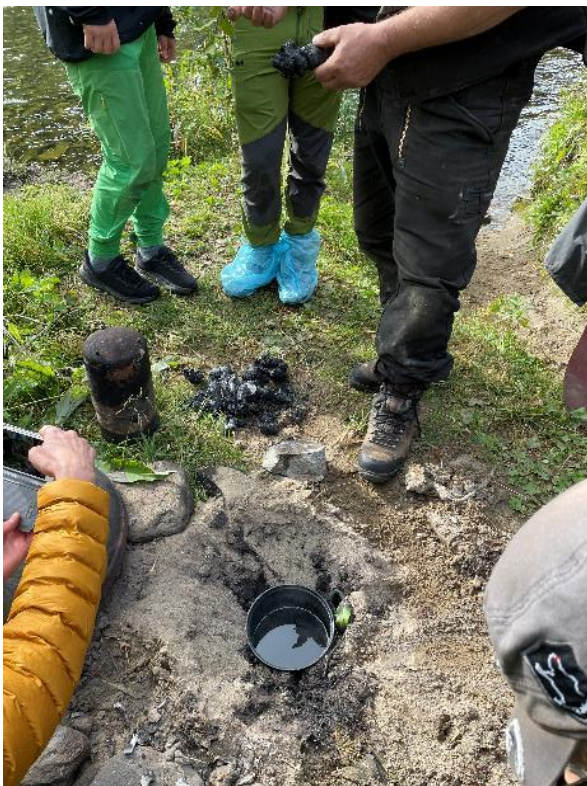
Over: Framtilling av «russeolje» av bjørkenever Under: En navar