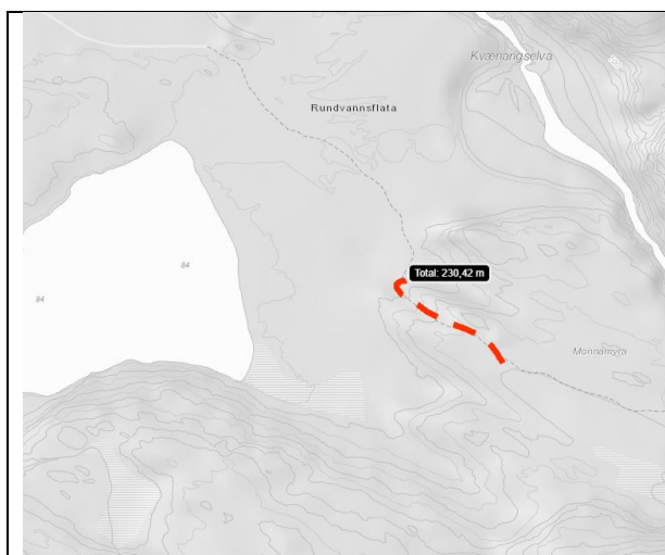
Kartet viser hvor det er gjort tiltak