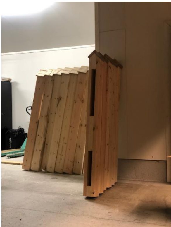
Stolper ferdig produsert