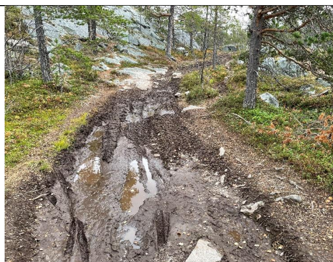
Bildet viser før-situasjon på del av strekningen