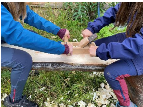
Over: Bruk av okshøvel