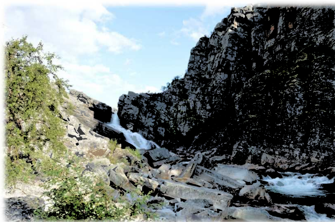
1 Storfossen i Kvænangsbotn