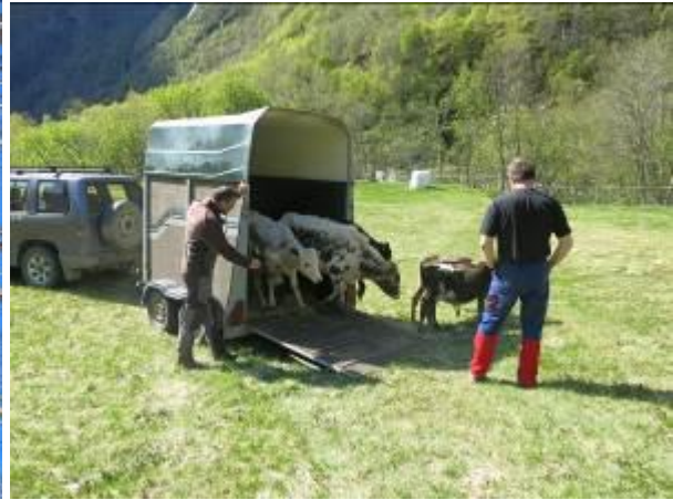
Okseslepp i Vetti 18. mai